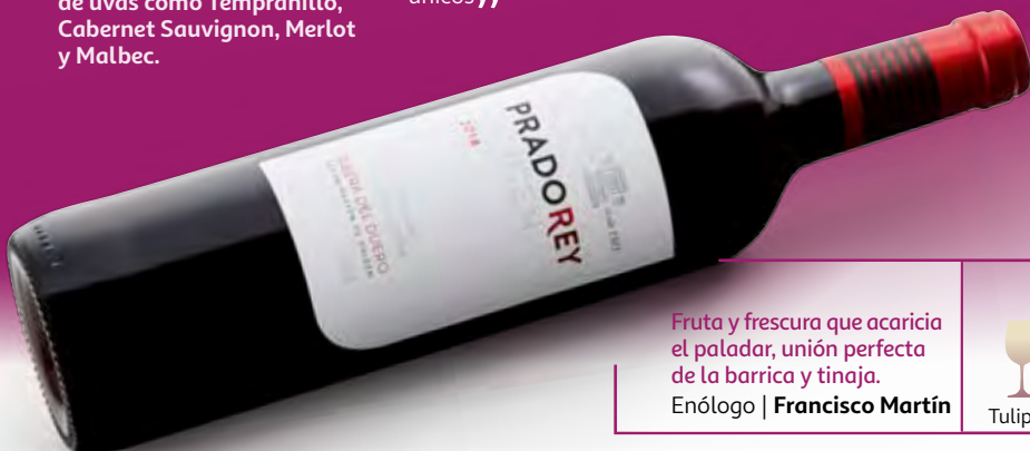
PRADO REY ROBLE 2018 D.O. Ribera del Duero.

Fruta y fresca que acaricia el paladar, unión perfecta de la barrica y tinaja.