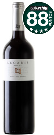
LEGARIS Roble 2015 D.O. Ribera del Duero.