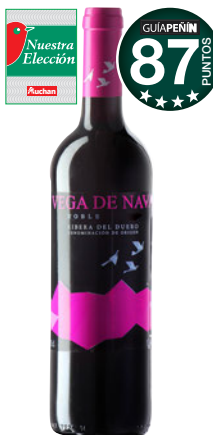
VEGA DE NAVA Roble 2015 D.O. Ribera del Duero.