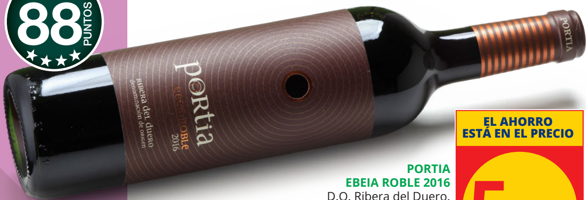
PORTIA EBEIA ROBLE 2016 D.O. Ribera del Duero.