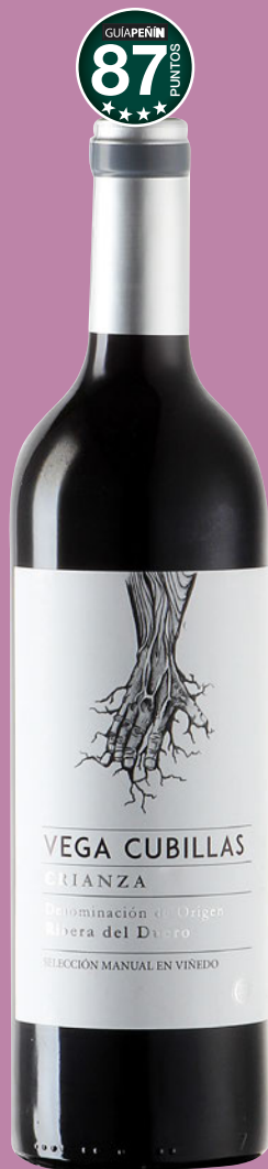
VEGA CUBILLAS Crianza 2014 D.O. Ribera del Duero.