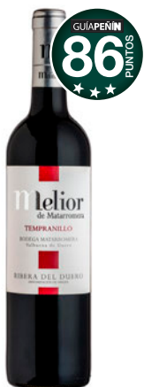
MELIOR Roble 2016 D.O. Ribera del Duero.