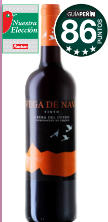
VEGA DE NAVA 2016 D.O. Ribera del Duero.