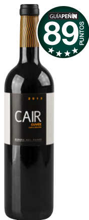
CAIR CUVEE Roble 2013 D.O. Ribera del Duero.