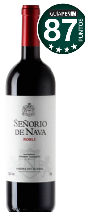
SEÑORÍO DE NAVA Roble 2016 D.O. Ribera del Duero.