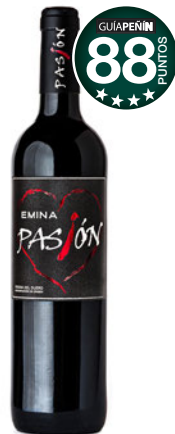
EMINA PASIÓN 2015 D.O. Ribera del Duero.