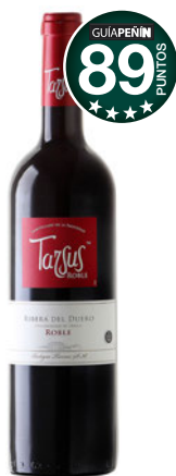
TARSUS Roble 2015 D.O. Ribera del Duero.