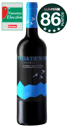
VEGA DE NAVA Crianza 2014 D.O. Ribera del Duero.