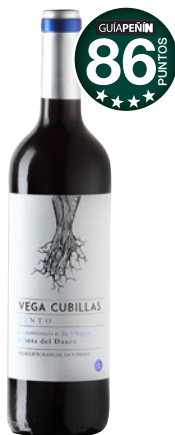
VEGA CUBILLAS 2016 D.O. Ribera del Duero.