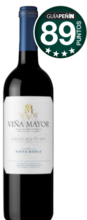
VIÑA MAYOR Roble 2015 D.O. Ribera del Duero