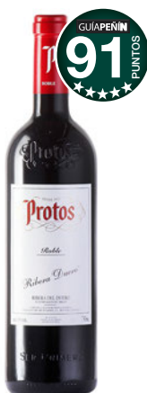
PROTOS Roble 2015 D.O. Ribera del Duero.