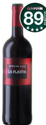
LA PLANTA Roble 2016 D.O. Ribera del Duero.