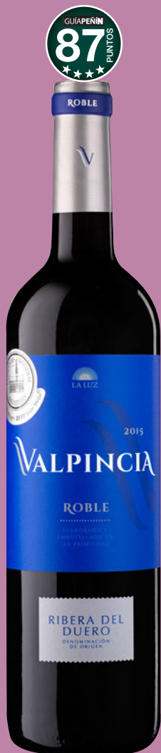
VALPINCIA Roble 2015 D.O. Ribera del Duero.