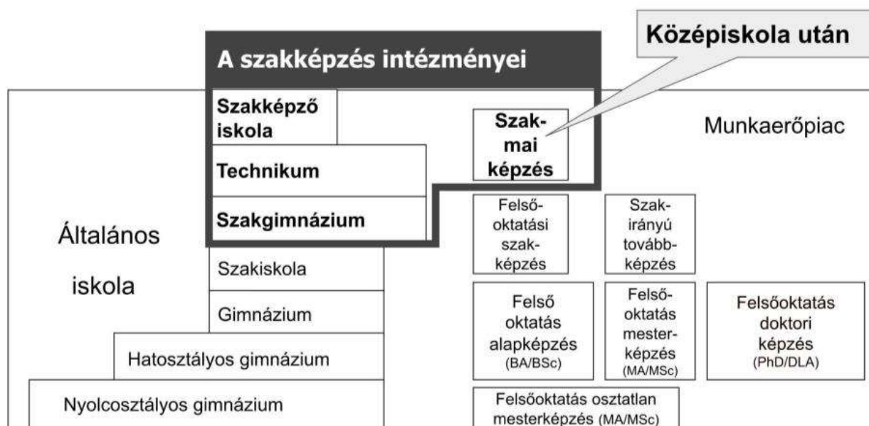
Szakképző intézmények az iskolarendszer térképén

A középiskola utáni szakképzésben gimnáziumot, szakgimnáziumot, technikumot vagy szakképző iskolát végzett fiatalok vehetnek részt.