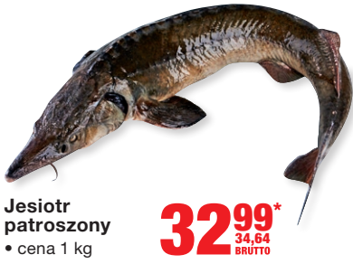
Jesiotr patroszony • cena 1 kg