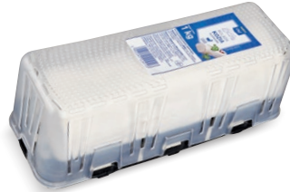
Ser kozi pleśniowy - rolada • opak. 1 kg • cena 1 opak.