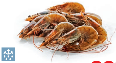
Krewetki białe 30/40** • cena 1 kg