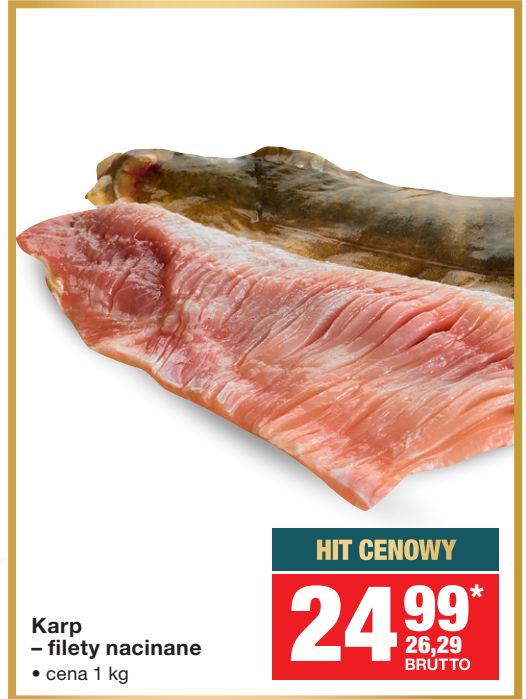
Karp – filety nacinane • cena 1 kg