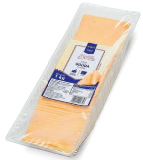
Ser Gouda - plastry • opak. 1 kg • cena 1 opak.