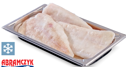
Mintaj – filety • glazura 35% • masa netto bez glazury 3,25 kg • cena 1 opak.