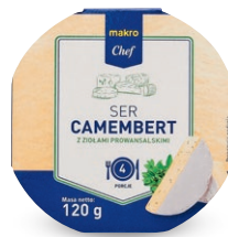
Ser Camembert • opak. 120 g • cena 1 opak.