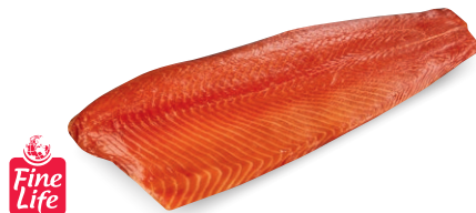
Łosoś atlantycki wędzony na zimno – filety ze skórą** • cena 1 kg