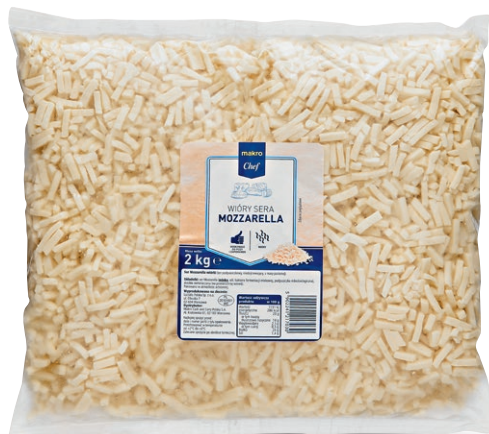
Ser Mozzarella - wióry • opak. 2 kg • cena 1 opak.

**Artykuł niedostępny w halach: Kalisz, Zielona Góra.