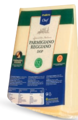
Ser Parmigiano Reggiano** • opak. ok. 1 kg • cena 1 kg