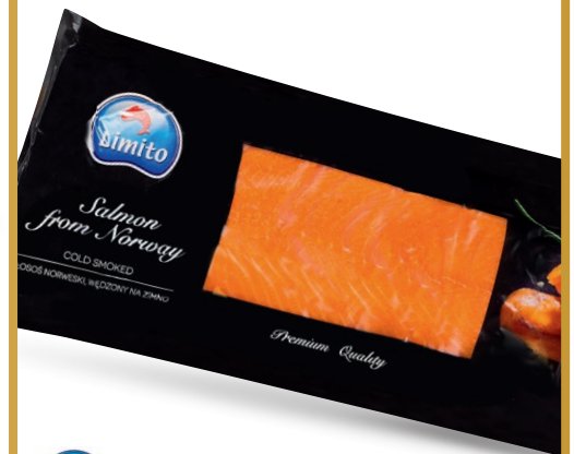
Łosoś norweski wędzony na zimno – plastry** • opak. 1 kg • cena 1 opak.

**Artykuł niedostępny w halach: Kalisz, Słupsk, Zielona Góra.