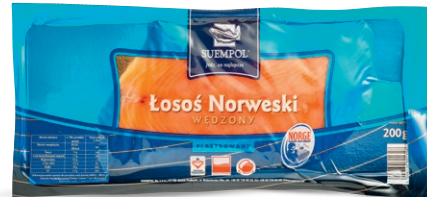
SUEMPOL Łosoś norweski wędzony na zimno – plastry** • opak. 200 g • cena 1 opak.