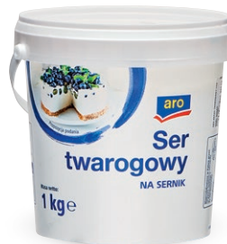
Ser twarogowy • opak. 1 kg • cena 1 opak.