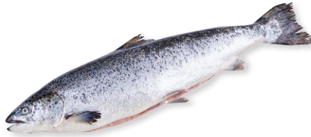
Łosoś atlantycki – patroszony • kal. 5/6 • cena 1 kg