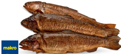
Pstrąg tęczowy wędzony na gorąco** • cena 1 kg

**Artykuł niedostępny w hali Zielona Góra.