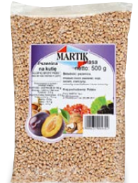
Pszenna na kutię