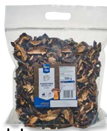
Podgrzybek suszony krojony