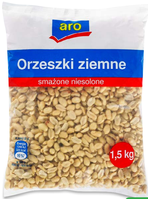
Orzeszki ziemne smażone niesolone