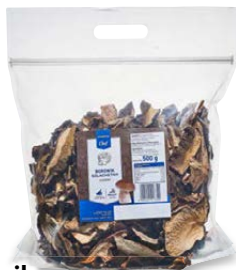
Borowik suszony krojony