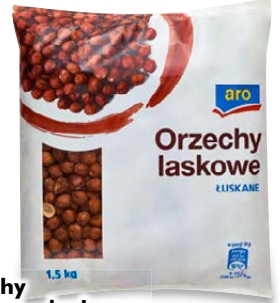
Orzechy laskowe - luskane