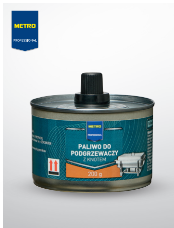
Paliwo do podgrzewaczy z knotem

opak. 200 g czas palenia: ok. 3 h bezdymna, bezwonna nr art. 852162