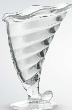
Pucharek do lodów Fortuna

poj. 300 ml pak. po 2 szt. nr art. 109416