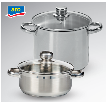
Garnek z pokrywką