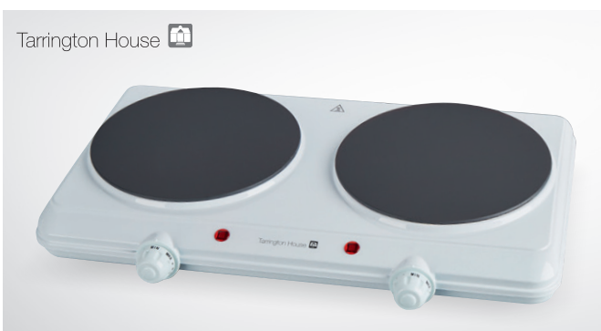
Kuchenka halogenowa DIF2518

100 programów do zapamiętania maksymalna średnica talerza 30,5 cm przyciski pokryte membraną do łatwego czyszczenia nr art. 186364