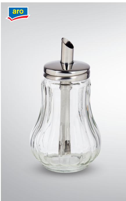
Dozownik do cukru