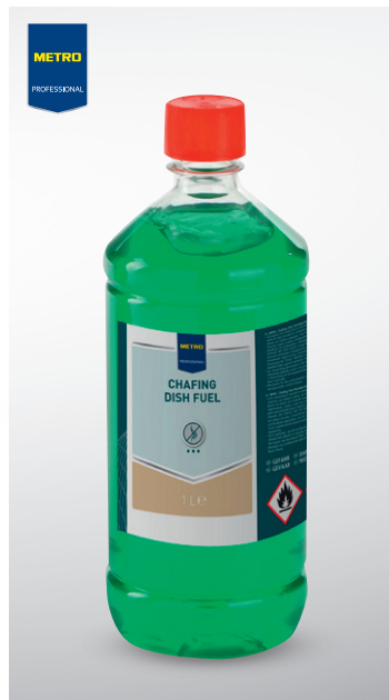
Pasta do podgrzewaczy

opak. 200 g knot zapewnia odpowiednią temperaturę i płomień nr art. 852164