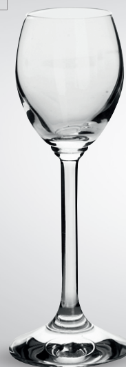
Kieliszek do wódki Venezia

poj. 50 ml pak. po 6 szt. nr art. 229892