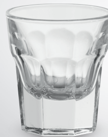
Kieliszek do wódki Marocco

poj. 30 ml pak. po 12 szt. nr art. 355887