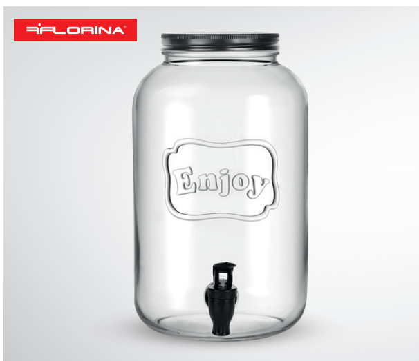
Stój z kranem Enjoy