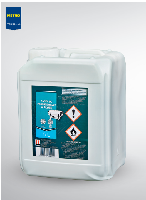
Pasta do podgrzewaczy

opak. 5 l bezdymna, bezwonna nr art. 218496