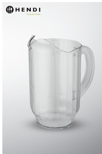
Dzbanek z poliwęglanu

poj. 500 ml nr art. 133672 poj. 1 l nr art. 134053 poj. 1,6 l nr art. 134054