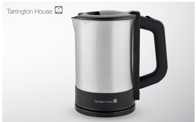
Czajnik elektryczny WK20185

moc 2200 W pojemność 1,7 l nr art. 456572