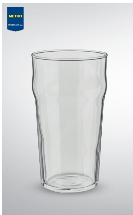
Pokal do piwa

poj. 500 ml pak. po 6 szt. nr art. 571923