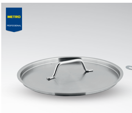
Pokrywka z odpowietrznikiem