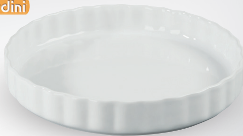
Ceramiczna forma okrągła

temp. od -18°C do 250°C śr. 29 cm nr art. 496328