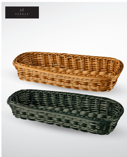
Koszyczki na sztućce

materiał: polipropylen przeznaczone do mycia w zmywarkach wym. 27 x 10 cm ciemny nr art. 178298 jasny nr art. 199268