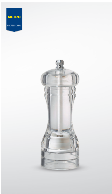
Młynek do soli/pieprzu akrylowy

wys. 13,8 cm nr art. 134051 wys. 22 cm nr art. 134050