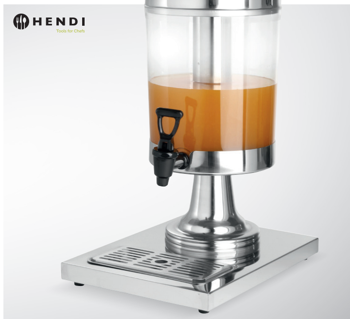
Dyspenser do soku

materiał: obudowa – stal nierdzewna, zbiornik – poliwęglan poj. 8 l nr art. 336715