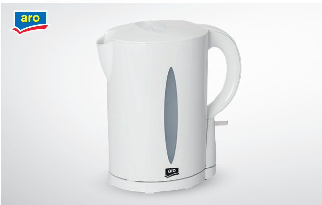
Czajnik elektryczny WK1715

moc 2200 W pojemność 1,7 l nr art. 456572