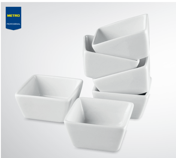
Tapas miseczka kwadratowa