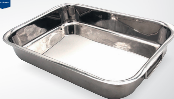
Brytfanna z uchwytemi