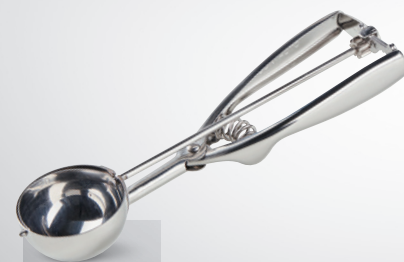
Gałkownica do lodów