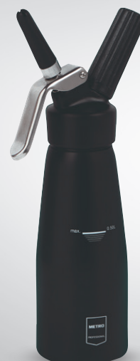
Syfon do bitej śmietany

materiał: korpus - aluminium, kończówki - polipropylen poj. 500 ml nr art. 134044 poj. 1 l nr art. 134046