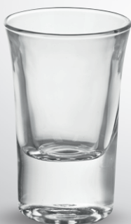
Kieliszek do wódki

poj. 34 ml pak. po 6 szt. nr art. 428767