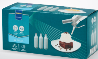
Naboje do syfonu do bitej śmietany

opak. 24 szt. nr art. 349244 opak. 50 szt. nr art. 243345