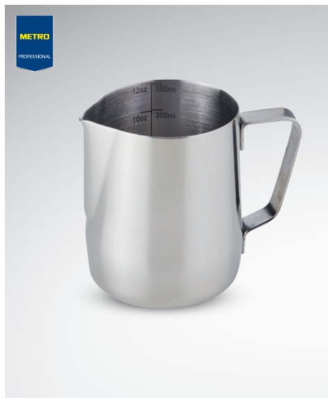
Dzbanek na mleko z podziałką

poj. 350 ml nr art. 134033 poj. 600 ml nr art. 134031