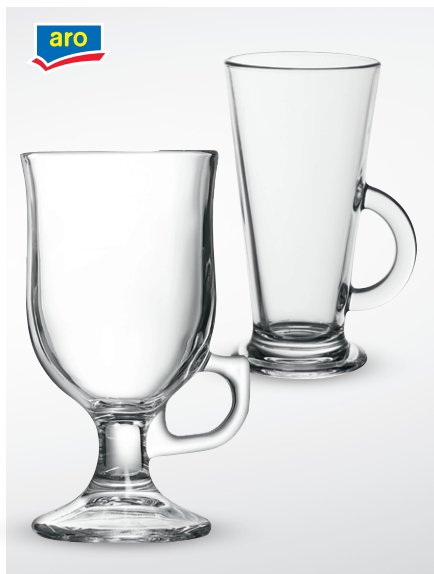
Szkłanka do latte

poj. 250 ml opak. 1 szt. nr art. 175921 poj. 290 ml opak. 1 szt. nr art. 229170