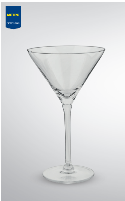
Kieliszek do martini

poj. 250 ml pak. po 6 szt. nr art. 131884