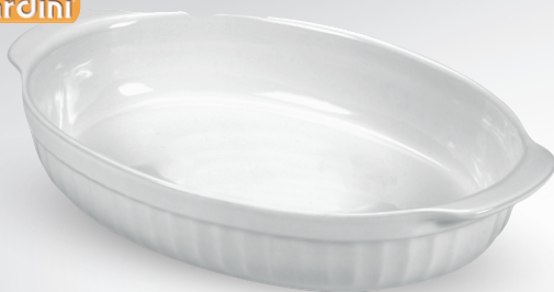
Ceramiczna forma owalna

temp. od -18°C do 250°C wym. 30 x 18 cm nr art. 496287 wym. 22 x 14 cm nr art. 496289