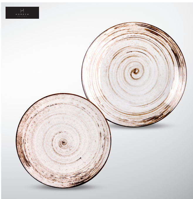
Linia Nosta biała