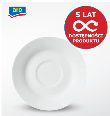
Spodek do filiżanki Aro

do sztaplowania poj. 200 ml pak. po 6 szt. nr art. 196679