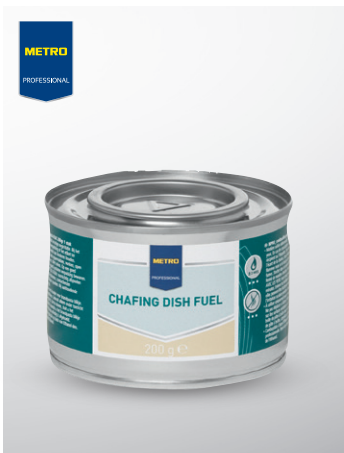
Pasta do podgrzewaczy

opak. 200 g czas palenia: ok. 3 h bezdymna, bezwonna nr art. 852162