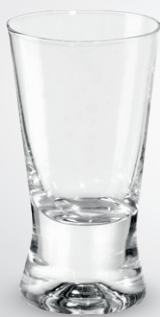
Kieliszek do wódki

poj. 25 ml pak. po 6 szt. nr art. 571926