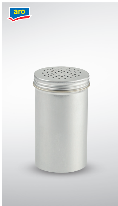
Dyspenser do przypraw

do cukru pudru, cynamonu, kakao wys. 11 x 7 cm nr art. 735097