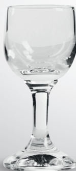
Kieliszek do wódki Pure