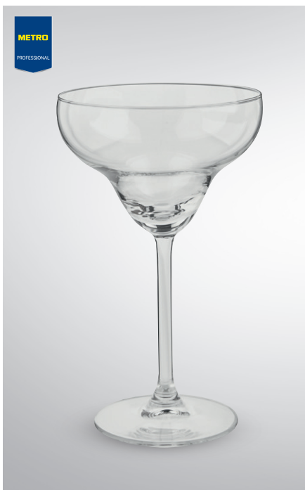
Kieliszek do margarity

poj. 250 ml pak. po 6 szt. nr art. 131884