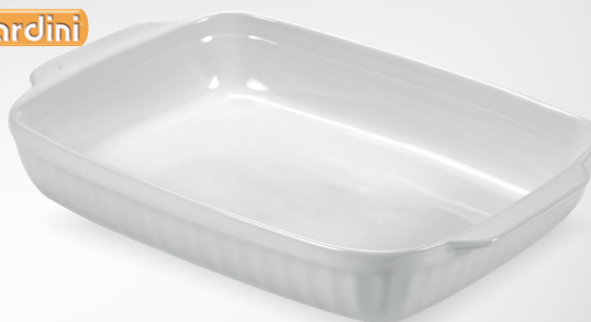
Ceramiczna forma prostokątna

temp. od -18°C do 250°C wym. 18 x 16 cm nr art. 496326 wym. 22 x 14 cm nr art. 496313 wym. 30 x 18 cm nr art. 496302 wym. 36 x 24 cm nr art. 496300