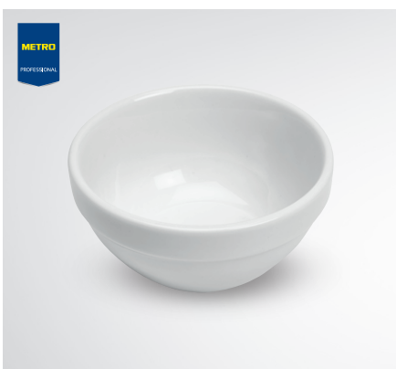
Tapas miseczka okrągła

materiał: porcelana opak. 6 szt. śr. 7,4 cm nr art. 186371