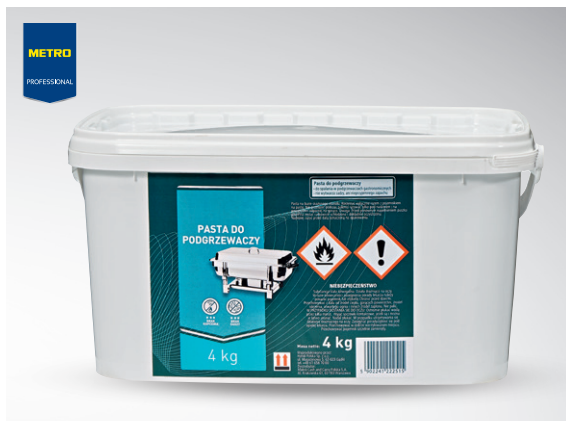
Pasta do podgrzewaczy

opak. 5 l bezdymna, bezwonna nr art. 218496