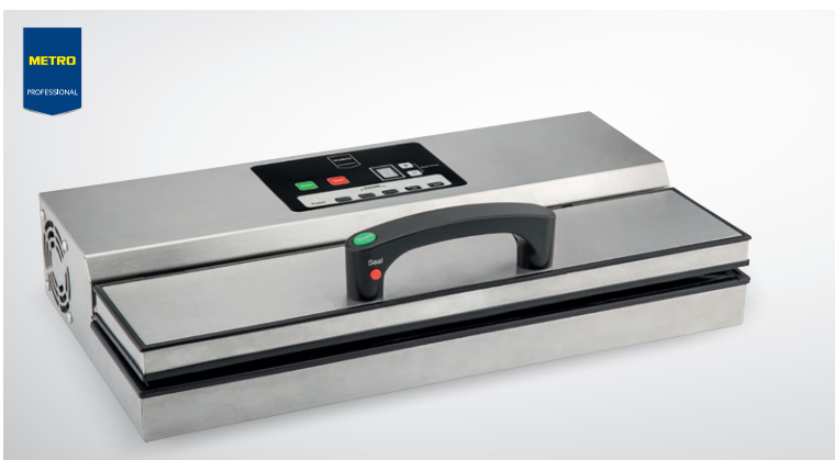
Pakowarka próżniowa GVS1040

moc 580 W maks. szer. zgrzewanej folii 40,6 cm podwójna pompa szer. zgrzewu 5 mm wym. komory pakowania 49 x 26 x 14,5 cm nr art. 250537