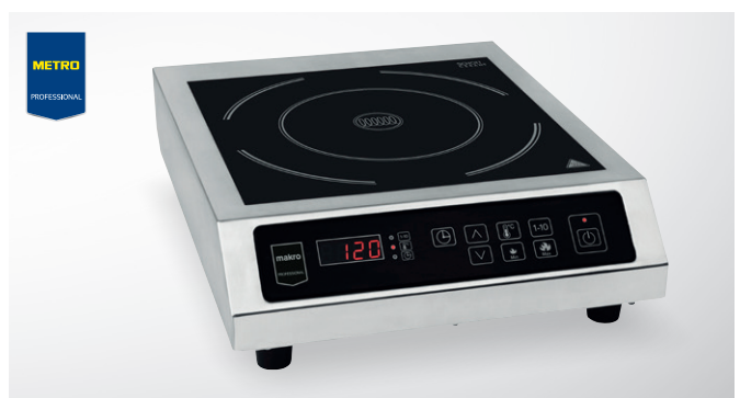
Kuchenka indukcyjna GIC3035

moc 2500 W średnica płyt grzewczych 18,8 cm nr art. 221214