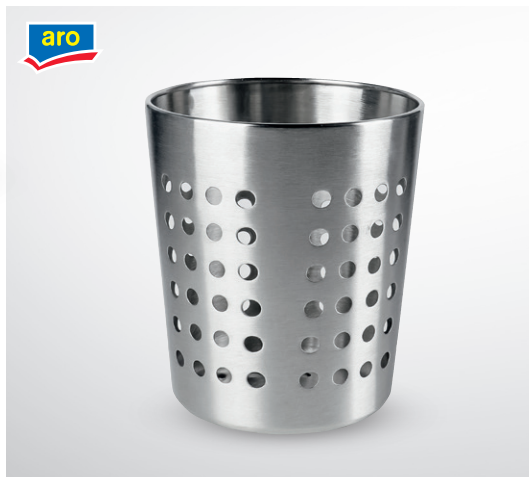
Stojak na sztućce

materiał: stal nierdzewna wym. 11,5 x 13 cm nr art. 134068