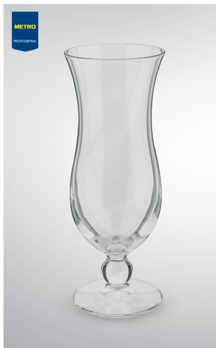
Kieliszek do koktajli

poj. 300 ml pak. po 6 szt. nr art. 131888