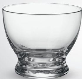
Pucharek do deserów Pure

poj. 260 ml pak. po 6 szt. nr art. 104785