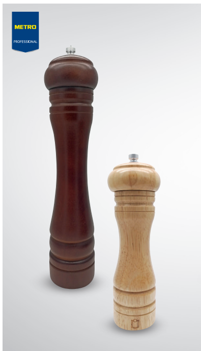
Młynek do soli/pieprzu drewniany