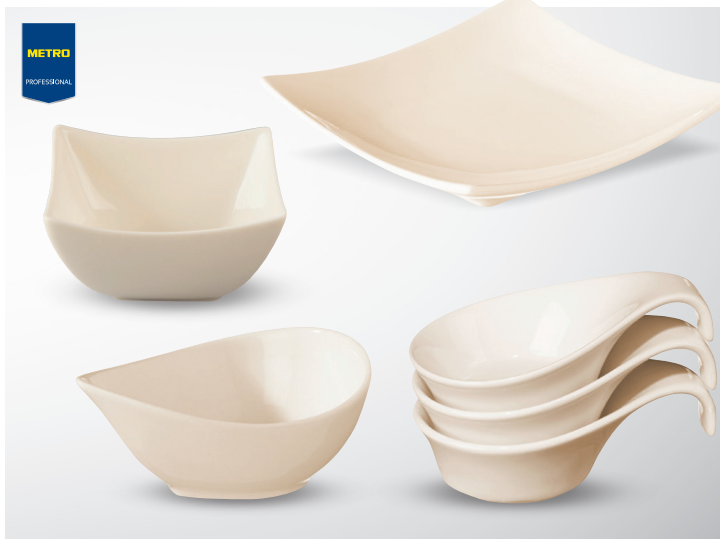
Appetizery do przystawek