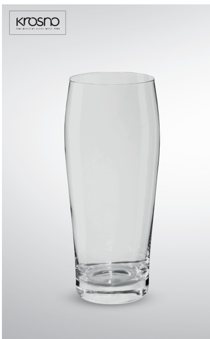
Szklanka do piwa Chill

poj. 385 ml pak. po 6 szt. nr art. 355863