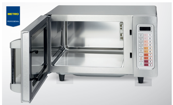
Kuchenka mikrofalowa GWM1025

MW7720G moc grilla 800 W 1-stopień grilla nr art. 224105