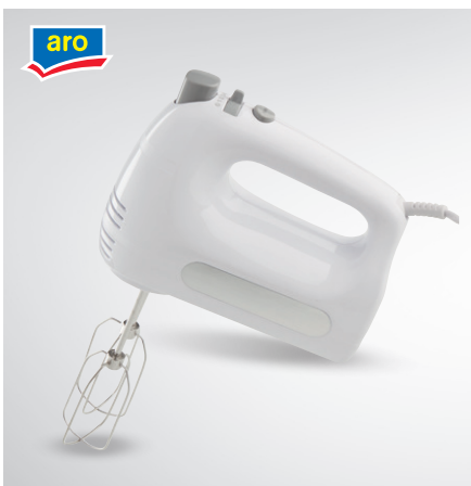
Mikser ręczny HM3019N

moc 300 W 6-stopniowa regulacja obrotów, tryb turbo 2 ubijaki ze stali nierdzewnej i hak i do wyrabiania ciasta nr art. 449060