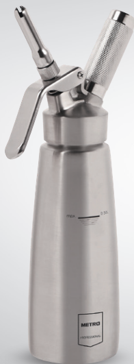
Syfon do bitej śmietany

materiał: korpus i końcówki - stal nierdzewna poj. 500 ml nr art. 134041 poj. 1 l nr art. 134043