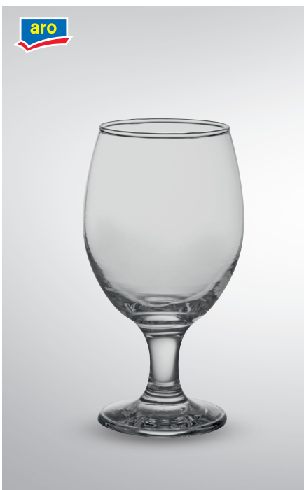
Pokal do piwa Kouros

poj. 385 ml pak. po 6 szt. nr art. 355863