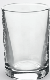
Kieliszek do wódki

poj. 30 ml pak. po 6 szt. nr art. 571910