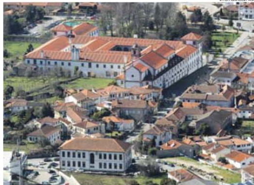
Arouca é vila milenar com charme da natureza e gastronomia irresistível