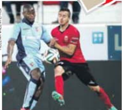
Maldição de Penafiel terminou em 6-1

Mas há mais. Há as vitórias na Amoreira e em Vila do Conde, onde o SC Braga não vencia