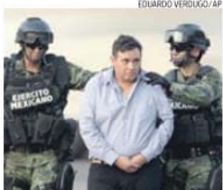
Omar Treviño Morales nas mãos da polícia

O PP está a ser questionado por suspeita de ter beneficiado de fundos de origem ilícita, relacionadas com irregularidades financeiras cometidas por um presidente da câmara de Pozuelo, Josús Sepúlveda, pelo que, deverá, em princípio, ter de devolver o dinheiro apropriado de forma indevida. O juiz exige-lhe uma caução de € 245,00. Este inquérito judicial implicou a demissão da ministra da Saúde, Ana Mato, no final de 2014, suspeita de ter beneficiado do dinheiro obtido ilegalmente pelo seu ex-marido, o autarca de Pozuelo.