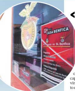
Bilhetes voam num ápice na Casa do Benfica de Arouca