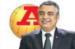
por JOSÉ COUCEIRO