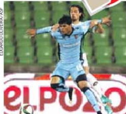
Rio Ave travado (0-2) em Vila do Conde

Desde então, os guerreiros somaram quatro derrotas consecutivas diante dos seus adeptos frente aos dragões. Um novo borrego que Sérgio Conceição terá de matar para não descolar do Sporting na classificação. É que, em caso de vitória, os bracarenenses sobem provisoriamente ao terceiro lugar que dá acesso ao play-off da Liga dos Campeões, ficando depois a verem aquilo que os leões vão fazer frente ao Penafiel, na próxima segunda-feira.