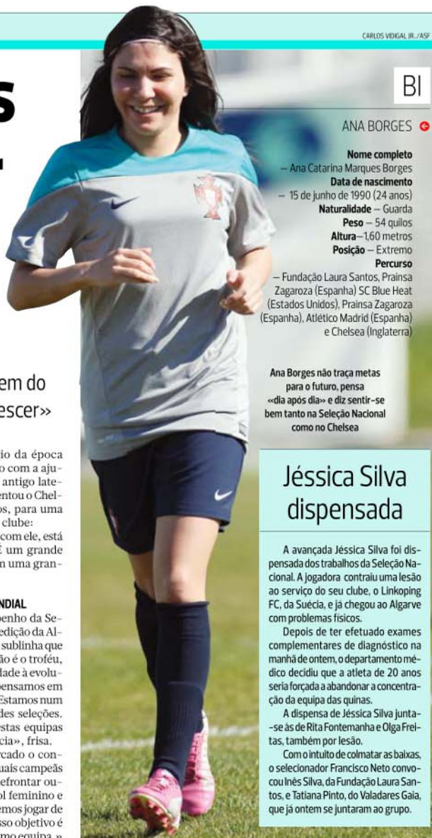
CARLOS VEIGAL, JR./ASF

Para hoje está marcado o confronto com o Japão, atuais campeãs do Mundo: «Vamos defrontar outra potência do futebol feminino e sabemos que não podemos jogar de igual para igual. O nosso objetivo é continuar a crescer como equipa.»