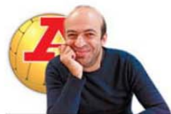
por JOÃO BONZINHO

Aconteça o que acontecer, esta noite, no Braga-FC Porto, dificilmente o título deste ano não será discutido até ao fim