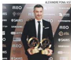
Vítor Baía, símbolo de imbatibilidade

Fabiano ainda está muito longe dessa marca e também algo distante do melhor registo desta tem-