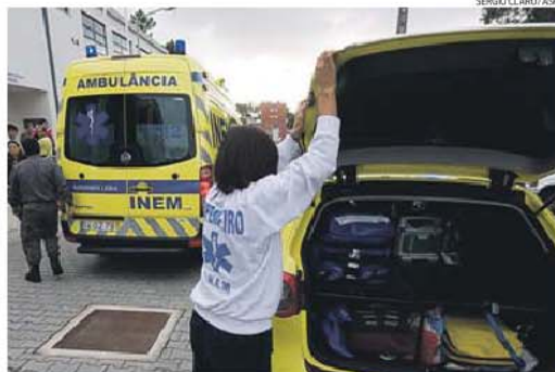
Ambulância dirigida-se para o Hospital St.º António mas terá sido desviada para Gaia

Segundo o Sindicato dos Técnicos de Ambulância de Emergência (STAE), uma ambulância terá sido desviada, na segunda-feira, para