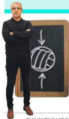
por DIAMANTINO MIRANDA