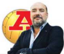
POR PEDRO MARQUES LOPES

O medo está instalado para as bandas da Luz. E percebe-se porquê. Este Benfica não tem qualidade de jogo nem estofo de campeão