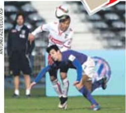
Belenses caiu (0-1) no Restelo