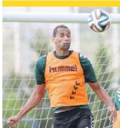
Ericson falha o próximo jogo