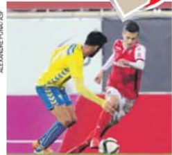
Estoril derrotado na Amoreira por 0-2

Sérgio Conceição tem vindo a fazer história no clube, no entanto, o treinador sabe que só