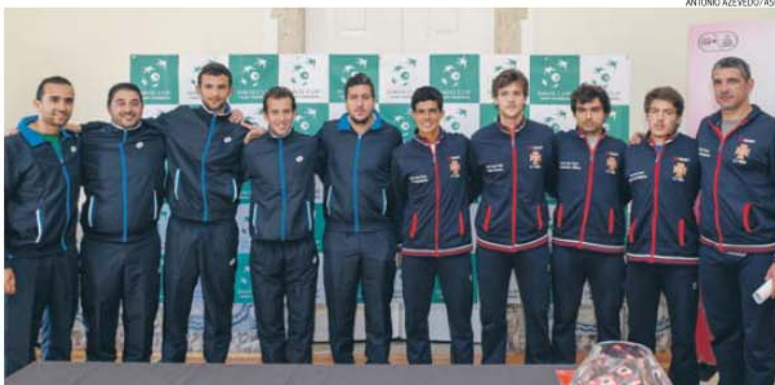
A tradicional 'foto de família' das duas seleções - Marrocos e Portugal - antecedeu o sorteio, no Palácio Marquês de Pombal, em Oeiras