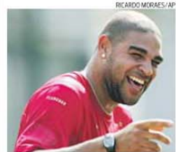
Adriano, 'imperador' só fora dos relvados

→ Segundo jornal brasileiro, avançado gastou 18 mil euros numa festa de arromba