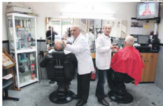
Na barbearia dos irmãos Santos o futebol é rei e senhor

O horário do jogo (16 horas) favorece o clima de festa, podendo a mesma ser potenciada pelo bom tempo em perspectiva. Arouca já viveu inúmeras jornadas de júbilo, está habituada a muito bem acolher quem vem de fora, presenteando o turista e o esporádico visitante com um banquete gastronómico de pura eleição, acenando ao freguês com especialidades capazes de extasiar o paladar. Da vitela assada no forno à posta arou-