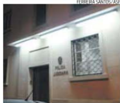
Assalto passou para a alçada da PJ

Por sua vez, o presidente do INEM lamentou, ontem, o envolvimento neste caso do nome dele e da família, adiantando que vai avançar com processos-crime contra todos aqueles que o acusaram de atrasar uma operação de socorro. «Houve dois médicos envolvidos na troca de equipa e que garantem não ter havido qualquer atraso», afirmou.