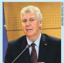
Marques Guedes, ministro da Presidência

operacional. Por isso, esta solução é para permitir que não esperemos pelo programa e a Segurança Social se substitua na despesa», explicou o governante. Desta forma, a autorização deverá «garantir a manutenção do apoio alimentar» atribuído pelo FEAD e impedir «perturbações no fornecimento de ajuda». O FEAD vai estar em vigor até 2020.