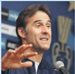
Basco contente com evolução da equipa

Aliás, o treinador do FC Porto fez a dicotomia entre plantel e equipa para expor uma ideia que é comum a muitos projetos que implicaram mudanças radicais