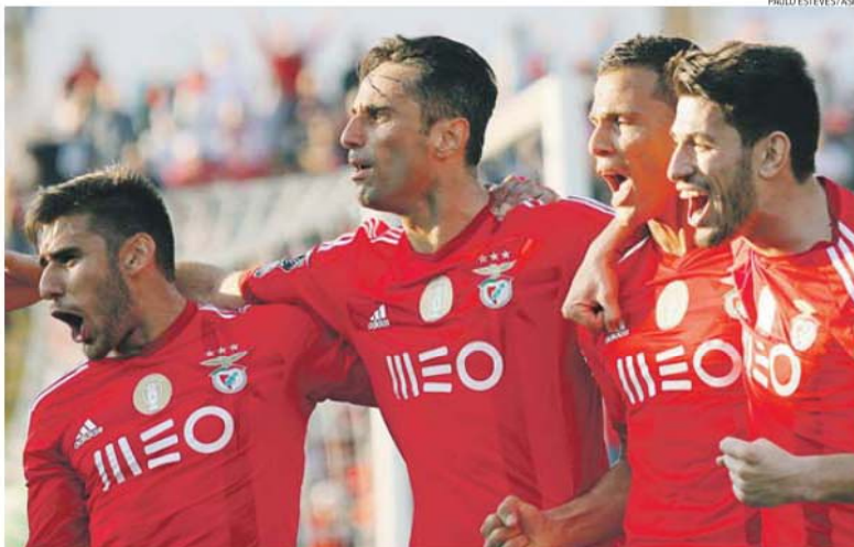
Em Arouca, vimos por toda a primeira parte um líder a poupar-se ao choque, a cartões amarelos... Depois, lá acordou e resolveu a contenda

Isto é um problema de Pinto da Costa que umas vezes diz uma coisa e outras vezes diz uma outra coisa completamente diferente. O que se compreende porque a ameaça é grande e o supermercado de que Sir Ferguson falava já não é o que era, queremos crer.