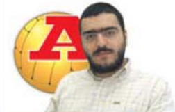
por HUGO VASCONCELOS

Mourinho é especial para vocês, mas não para mim.