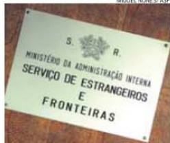
Suspeitos não escaparam ao crivo do SEF