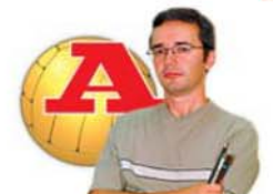
por RICARDO GALVÃO