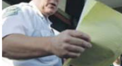
Jackson não resistiu a protestos e críticas

→ Decisão é vista como reação às críticas sobre direitos humanos e ao sistema político saudita