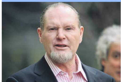
Paul Gascoigne, 47 anos, ontem, à entrada para o Supremo Tribunal de Londres

Admitindo que trocava de número de telemóvel «cinco a seis vezes» por... mês, o antigo jogador de Newcastle, Tottenham, Lazio ou Everton descreveu a experiência como «horível». «Ainda tenho medo de falar ao telemóvel. Preferia trocar o telemóvel por um... caixão. Não tenho vida. Fiqui obcecado e com medo de estar permanentemente a ser vigiado», sentenciou.