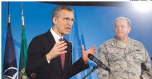
Jens Stoltenberg explica a estratégia da NATO, tendo a seu lado o general Philippe Breedlove

Esta ideia ressalta da intervenção feita, ontem, no quartel-general da NATO, em Mons (Bélgica), pelo secretário-geral da Aliança, Jens Stoltenberg, perante as mais altas patentes militares da organização, incluindo o Chefe do Estado Maior para a Europa, general de quatro estrelas, Philip M. Breedlove, aos quais deu conhecimento de que para este ano está previsto o maior número de manobras desde o final da Guerra Fria.