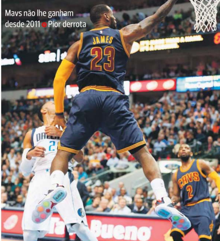
LeBron James apenas falhou quatro dos 14 lançamentos de campo que efetuou, dois para lá da linha de três pontos, onde converteu quatro

Mavs não lhe ganham desde 2011 • Pior derrota