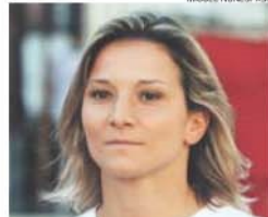
Judoca irá parar entre duas a três semanas