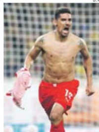
A celebração de Jara, ex-Benfica

Ponto assente: o futebol grego vai voltar a ser falado pelas piores razões.