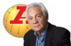
por SANTOS NEVES

e aos seus euros à escala de milhões. Tem de haver mesmo bilateral tudo por tudo na tarde deste sábado. Muito quente.