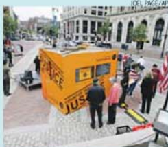
Replica duma cela da prisão de Guantánamo