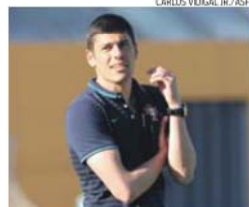
Francisco Neto, selecionador nacional

O selecionador nacional de futebol feminino, Francisco Neto, ficou satisfeito com a participação na Algarve Cup, onde Portugal evitou o último lugar após