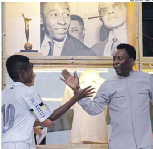
Pelé com jovens adeptos do Santos, o clube eterno do 'rei' e último campeão no mata-mata

Os presidentes de Vasco da Gama, Grémio e Santos lideram o