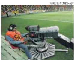
Direitos das transmissões de TV em foco

Significa também isto que a ideia de os jogos dos leões serem transmitidos pela Sporting TV está estão totalmente colocada de parte pelos responsáveis do clube de Alvalade.