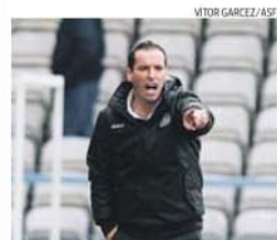
Petit alerta para a qualidade do Paços

▶ A equipa está lançada para garantir a permanência mas o técnico quer evitar relaxamento