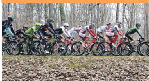
Tiago Machado (2.º à direita) e Rui Costa separados por um segundo na geral do Paris-Nice