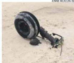
Uma das rodas do aparelho sinistrado

O Parlamento Europeu (PE) decidiu na terça-feira reclamar a constituição duma «investigação internacional independente» para a investigação do assassinio do político russo Boris Nemtsov.