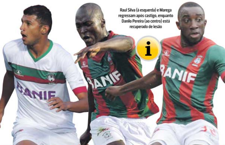
Raul Silva (à esquerda) e Marega regressam após castigo, enquanto Danilo Pereira (ao centro) está recuperado de lesão

No meio-campo há o tão desejado regresso de Danilo Pereira — falhou as duas últimas jornadas devido a lesão. Eber Bessa, titular frente ao Paços de Ferreira, será, por isso, suplente esta tarde. Ainda na zona intermediária, a dúvida é saber quem vai fazer companhia a Danilo Pereira e Alex Ferreira.