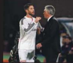
Sergio Ramos é 'reforço' para Ancelotti

Afastado há mais de um mês devido a uma lesão muscular contraída no jogo contra o Sevilla no Bernabéu, Sergio Ramos regressou aos convocados de Carlo Ancelotti para a recepção de hoje ao Levante. O central, que tem sido rendido por Varane no eixo da defesa desde o contratempo de 4 de fevereiro, traz assim mais opções ao conjunto de Carlo Ancelotti, satisfeito por ver voltar um dos mais influentes jogadores do plantel: «Sergio está muito bem, vai ajudar-nos muito, como Modric. Tem personalidade, caráter. Toda a gente está satisfeita com o seu regresso.»