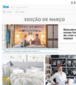
Revista do IKEA é publicada em 24 países

A referida lei, aprovada em 2013 por Vladimir Putin, proíbe a exposição de menores de idade a conteúdos sobre a homossexualidade e prevê elevadas multas e, inclusive, penas de prisão para quem o fizer.