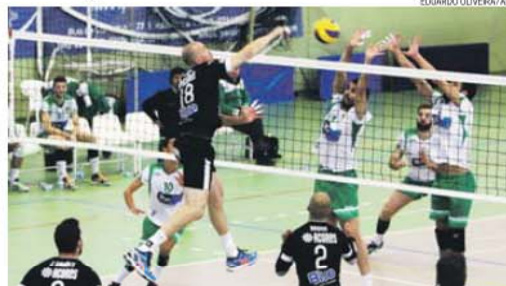
Insulares terminaram invictos a primeira fase do campeonato e querem continuar na frente

seguintes, até porque o técnico dos insulares começou a poupar os seus jogadores para o 2.º jogo