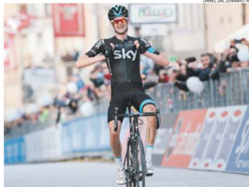
Holandês Wouter Poels (Sky) é o novo líder no Tirreno-Adriático