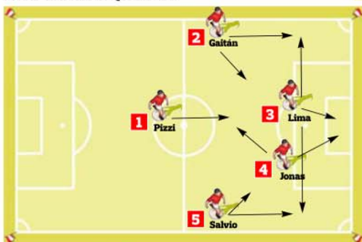
1 → Pizzi, importante no miolo 2 → Diagonais de Gaitán confundiram 3 → Lima caiu sempre nas linhas 4 → Jonas baixou no apoio a Pizzi 5 → Salvio imitou bem Gaitán

O segundo golo apareceu com naturalidade e o Benfica acabou a gerir o jogo e os jogadores