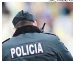
Operação decorreu no Porto e na Maia