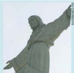
Cristo-Rei terá uma cor... diferente!