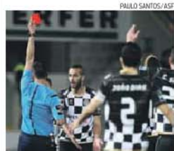
Tengarrinha falha jogo com o Belenenses

➔ Petit volta a ter de mexer na intermédia para a receção ao Belenenses