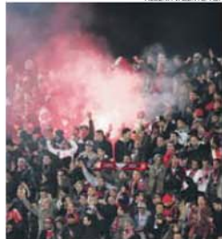
Benfiquistas esgotam Estádio do Rio Ave

A onda vermelha atinge dimensão inaudita e passará por Vila do Conde na jornada que se segue para o Campeonato. Os efeitos da liderança benfiquista serão financeiramente bem recompensadores para os cofres do Rio Ave. É que, apesar de o duelo entre vila-condenses e águias só se realizar no próximo sábado, já se encontra antecipadamente garantida lotação esgotada e uma receita de bilheteira superior a 100 mil euros.