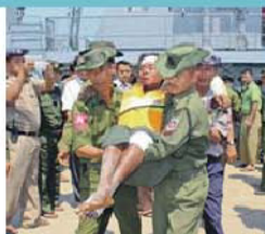
Mais de cem pessoas já foram resgatadas

Pelo menos 33 pessoas morreram e doze continuam desaparecidas devido ao naufrágio de um ferry ao largo da costa oeste de Myanmar, segundo dados da polícia do país. Já a Comunicação Social local fala em, pelo menos, 60 mortos. Ao todo, 169 passageiros já foram resgatados com vida do ferry Aung Tapon