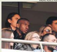
Talisca, ontem, no Estádio da Luz

O Dia Internacional da Mulher celebrou-se a 8 de março mas ontem, na Luz, a data não passou em branco. Luís Filipe Vieira convidou as mulheres dos presidentes das Casas do Benfica para assistirem ao jogo. Nem faltou o «grupo de mulheres benfiquistas de Cebolas de Cima», lia-se em t-shirts .