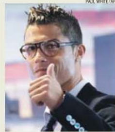
Ronaldo é o mais 'gostado' do Facebook

processa-se pois a ritmo superior ao da cantora, já que desde então CR7 aumentou em 7 milhões o número de seguidores, enquanto a cantora viu a lista de fãs crescer apenas em dois milhões. O terceiro classificado da lista de celebridades na Internet é o rapper Eminem, que ontem à hora de fecho desta edição estava acima dos 98 milhões de seguidores na sua página de Facebook.