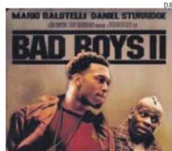
O cartaz alterado por Balotelli

O médio do Chelsea Nemanja Matic comentou ontem o lance em que Ashley Barnes, do Burnley, o atingiu nas pernas - e que motivou a expulsão do serviço por reagir com agressão: «A minha reação não foi a melhor, mas na altura pensei que tivesse partido a perna. Agora estou feliz porque consigo andar.»