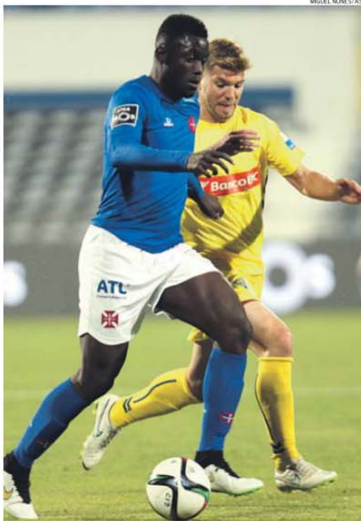
Pele com controlo total da bola e Diogo Amado a tentar travar o jogador do Belenenses

Incapazes de jogar bem, Belenenses e Estoril marcaram quatro golos, todos de bola parada