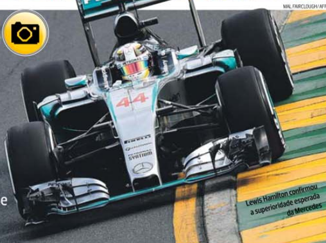
Lewis Hamilton confirmou a superioridade esperada da Mercedes