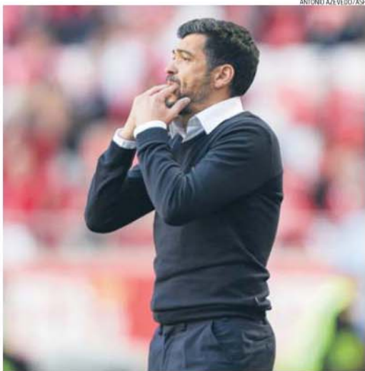
Sérgio Conceição quer ficar nos quatro primeiros lugares e ir à final da Taça de Portugal

Preferiu concentrar-se, obviamente, no SC Braga. «Já ganhámos duas vezes ao Benfica, o que é sinónimo do grande trabalho que temos feito. Este jogo teve esta atmosfera porque o SC Braga é equipa considerada forte. Não fomos como gostaríamos de ser mas vamos continuar a lutar. Estiveram neste estádio 60 mil espectadores, o que me deixa feliz como treinador. É sempre motivo de satisfação jogar e orientar um jogo assim. Para o Benfica este apoio é determinante», disse Sérgio Conceição, elogiando o Benfica «muito bem orientado» que o derrotou.