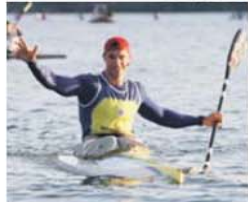
Fernando Pimenta não escondeu a alegria

Fernando Pimenta sagrou-se, ontem, nas águas do rio Douro, em Melres (Gondomar), campeão nacional de fundo pela 7.ª vez consecutiva. O canoista do Clube Náutico de Ponte de Lima mostrou-se muito satisfeito pelo 7.º título conquistado após vencer os 5000 m, à frente de Emanuel Silva, com quem ganhou a prata nos Jogos Olímpicos de 2012, e de José Ramalho. «Não foi nada fácil. Os adversários que enfrentei são todos fortes. Este título é um grande estímulo para enfrentar esta temporada, que promete ser muito dura, uma vez que antecede os Jogos Olímpicos do Rio», considerou.