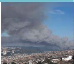
Fogo já consumiu 500 hectares de terras

Ainda assim, segundo o gabinete de imprensa da empresa na Rússia, citado pela AFP , a IKEA não recebeu qualquer aviso das autoridades russas sobre conteúdo que pudesse soar a «propaganda gay». O governo russo ainda não comentou o caso.