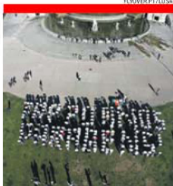
Protesto contra a privatização da TAP