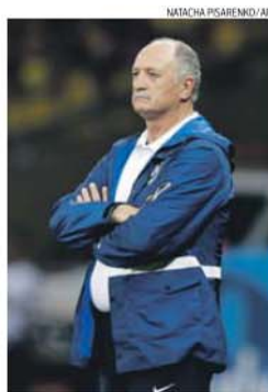
Luiz Felipe Scolari, 66 anos, Grêmio