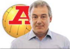
POR JOSÉ MANUEL DELGADO