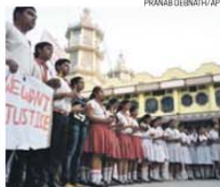
Alunos da escola católica pedem justiça