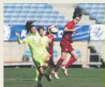
20.29 – Especial: Campactos Algarve Cup