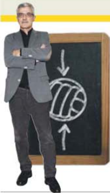
por HENRIQUE CALISTO