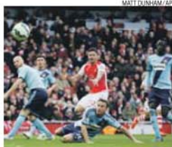
Giroud abriu o ativo e fez uma assistência

Giroud inaugurou o placard ainda antes do intervalo (45), a passe de Ramsey. No segundo tempo, os papéis inverteram-se e foi o médio galês a marcar, com assistência do francês (81). Avançado sou-mou sexto golo e a terceira assistência nos últimos oito com-