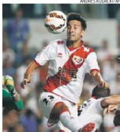
Bueno está em destaque em Espanha

Em final de contrato com o emblema dos arredores de Madrid, Bueno assume neste momento inesperado protagonismo no país vizinho, cotando-se como o melhor marcador espanhol no campeonato, com 15 golos, sendo ape-