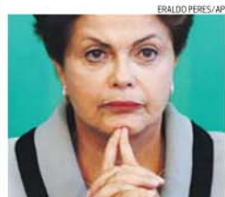
Dilma Rousseff, presidente do Brasil

O porta-voz do Ministério da Defesa, Zahir Azimi, fez saber, no domingo, que o suposto líder do Estado Islâmico (EI) no país, Hafiz Wahidi, foi morto durante uma operação militar na provincia de Helmand, no sul do Afeganistão, juntamente com mais nove elementos do EI.