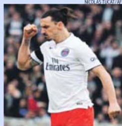
Ibrahimovic, 33 anos, avançado do PSG