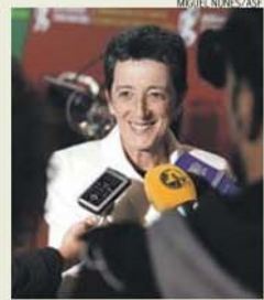
Rosa Mota muito sorridente

pelos ex-presidentes Jorge Sampaio, Mário Soares (Príncipe das Astúrias de Cooperação Internacional 1995) e Ramalho Eanes, além de António Damásio (Príncipe das Astúrias de Investigação Científica 2005), Pinto Balsemão, Leonor Beleza, o timorense José Ramos Horta, Nobel da Paz de 1996, ou o antigo atleta queniano Paul Tergat, entre outros. O prazo de entrega das candidaturas terminou no passado dia 12.