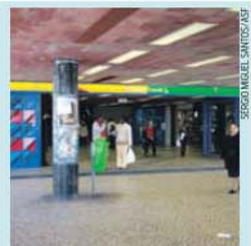
As portas abriram apenas às 10 horas

diálogo, quer por parte da empresa quer do Governo, para resolver os problemas concretos de trabalho da maior parte das categorias profissionais, a redução cada vez mais acentuada do número de trabalhadores» são outros motivos da paralização. Hoje, os trabalhadores da Transportes Sul do Tejo vão fazer uma greve de 24 horas, em protesto contra os «baixos salários» na empresa.