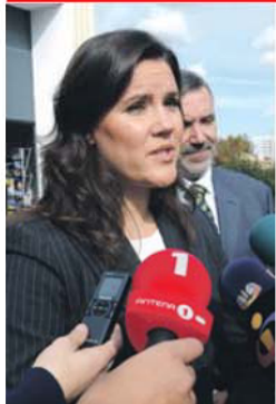
Assunção Cristas, ministra da Agricultura