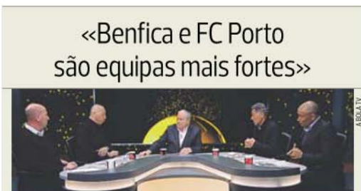
Com Sporting seguro no terceiro lugar, luta pelo título nacional é a dois. E falta clássico

A luta pelo título está ao rubro e vai haver campeonato até final. Esta, de uma maneira geral, foi a opinião dos comentadores de A BOLA TV no Último Passe , programa moderado por Gabriel Alves. Os jogos Benfica-SC Braga e o FC Porto-Arouca dominaram a análise. «Estou muito satisfeito com o que a equipa do Benfica vem demonstrando. O Benfica e Jorge Jesus vão no bom caminho», disse Mozer.