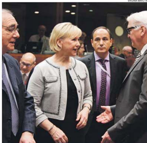
Chefes da diplomacia da UE conversa com homologos de Portugal e da Alemanha

Também por isso, a UE «apoiou os esforços da coligação internacional que combate o EI, inclusivamente através de ações militares, em conformidade com o Direito Internacional», segundo documento divulgado no final da reunião dos chefes da diplomacia dos 28, no qual salienta que, ainda que seja necessária a intervenção militar, «não é suficiente para derrotá-lo». De aí que também defenda, «em paralelo, a procura de soluções políticas», admitindo uma «solução transitória na Síria e uma governação inclusiva no Iraque» como «cruciais para uma paz duradoura e estável na região».