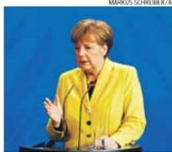
Angela Merkel, chanceler alemã

O encontro, o primeiro entre os dois, vai realizar-se em um período de tensão crescente entre Berlim e Atenas e terá em agenda o futuro programa de assistência financeira à Grécia. Até hoje, An-