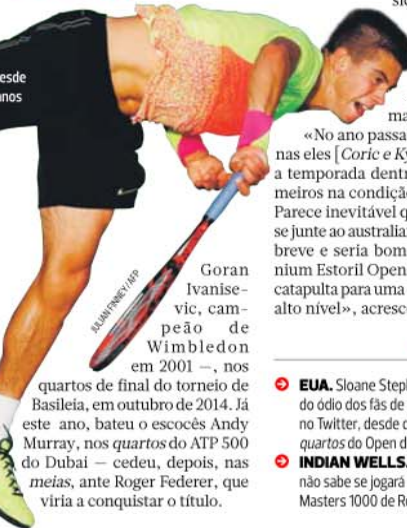
Joga desde os 5 anos

Coric, campeão júnior no Open dos EUA de 2013 e que foi n.º 1 do ranking mundial de sub-18 aos 16 anos, surpreendeu um dos seus ídolos de infância, o espanhol Rafael Nadal - o outro era o compatriota