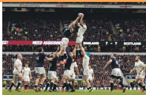
Ingleses partem em vantagem e jogam em casa na última ronda do torneio das Seis Nações

Num torneio em que a qualidade de técnica e espetacularidade dos jogos tem ficado aquém das ilusões dos milhões de adeptos, atraídos pela envolvente histórica e rivalidade das equipas, em ano de Mundial os melhores da Europa não prometem boas campanhas a partir de 18 de setembro, quando comparados com as seleções do hemisfério sul. O ritmo e velocidade de