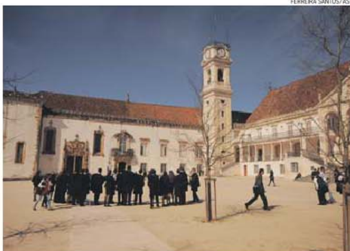
Também na Universidade de Coimbra se vibra com os feitos da Académica e de Viterbo

Novo treinador renovou a esperança da família acadêmica • A BOLA foi ao encontro de quem o conhece bem para perceber as razões do sucesso • Mística e alma são as palavras de ordem