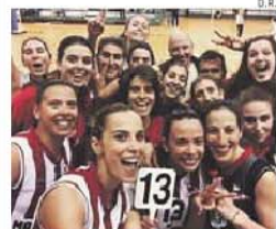
Leixões já conquistou 15 títulos

→ As duas equipas vão discutir o título nacional num 'play-off' a melhor de cinco