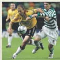
» 01.05 – Lendas da Premier League: Alan Shearer