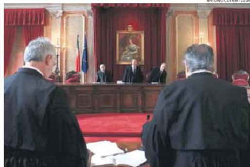
Pretenções dos advogados de José Sócrates (de costas) não foram atendidas pelo STJ

José Sócrates encontra-se detido desde 24 de novembro último por suspeita dos crimes de fraude fiscal, branqueamento de capitais e corrupção e foi-lhe imposta a medida de coação mais gravosa, por, alegadamente, não entender do juiz de instrução criminal Carlos Alexandre, existir perigo de perturbação da investigação em curso.