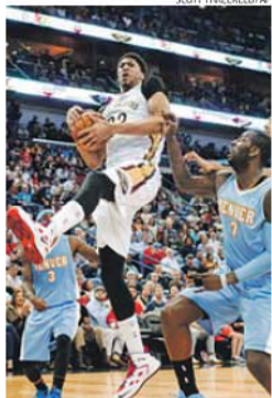
Anthony Davis brilhou na jornada

Serge Ibaka deverá ser submetido a cirurgia a um joelho, na tentativa de debelar uma dor persistente que tem afetado o extremo dos Oklahoma City Thunder e impediu que atuasse nos dois últimos jogos. A equipa não confirmou a notícia avançada pela ESPN, anunciando, através de comunicado, que Ibaka foi encaminhado para um especialista. Não se sabe quanto tempo estará afastado. Em contrapartida, os Houston Rockets já contaram com Dwight Howard no treino de ontem – o primeiro desde que se lesionou no joelho