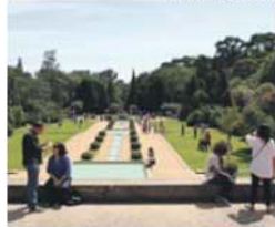
Jardim de Serralves, no Porto