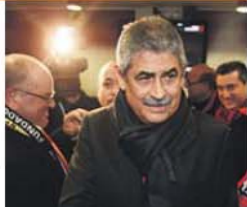
Presidente elogia as mulheres no desporto

O presidente do Benfica, Luís Filipe Vieira, felicitou, ontem, a equipa sénior feminina pela conquista do título europeu de clubes, em Espanha. Numa mensagem disponibilizada no site do clube, o dirigente exultou o papel das mulheres não só no hóquei em patins, a propósito da conquista da Taça Europeia Feminina, anteontem, como também noutras modalidades, como o atletismo, cuja