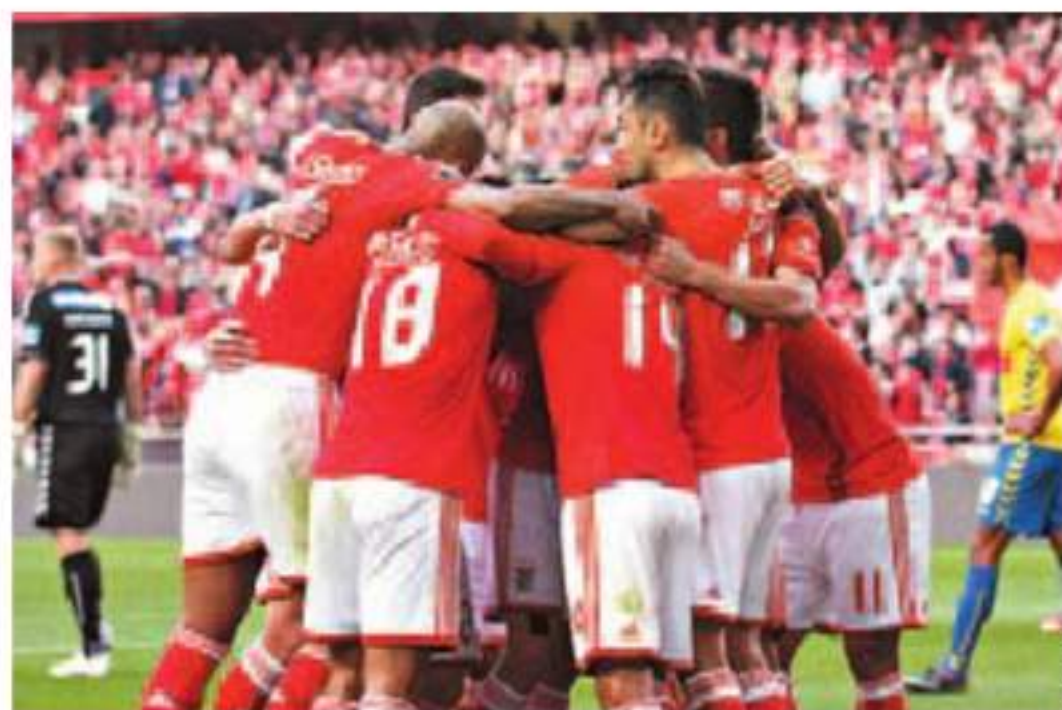
NA LUZ! Águias festejam sempre diante dos adeptos encarnados

Resumindo, o Benfica, ganhando os jogos na capital revalidará o título. E até pode perder com o Gil Vicente e V. Guimarães, no Norte – e já sofreu três derrotas acima do Douro. Neste cenário, os 83 pontos chegarão para o título, uma vez que terá vantagem no confronto direto.