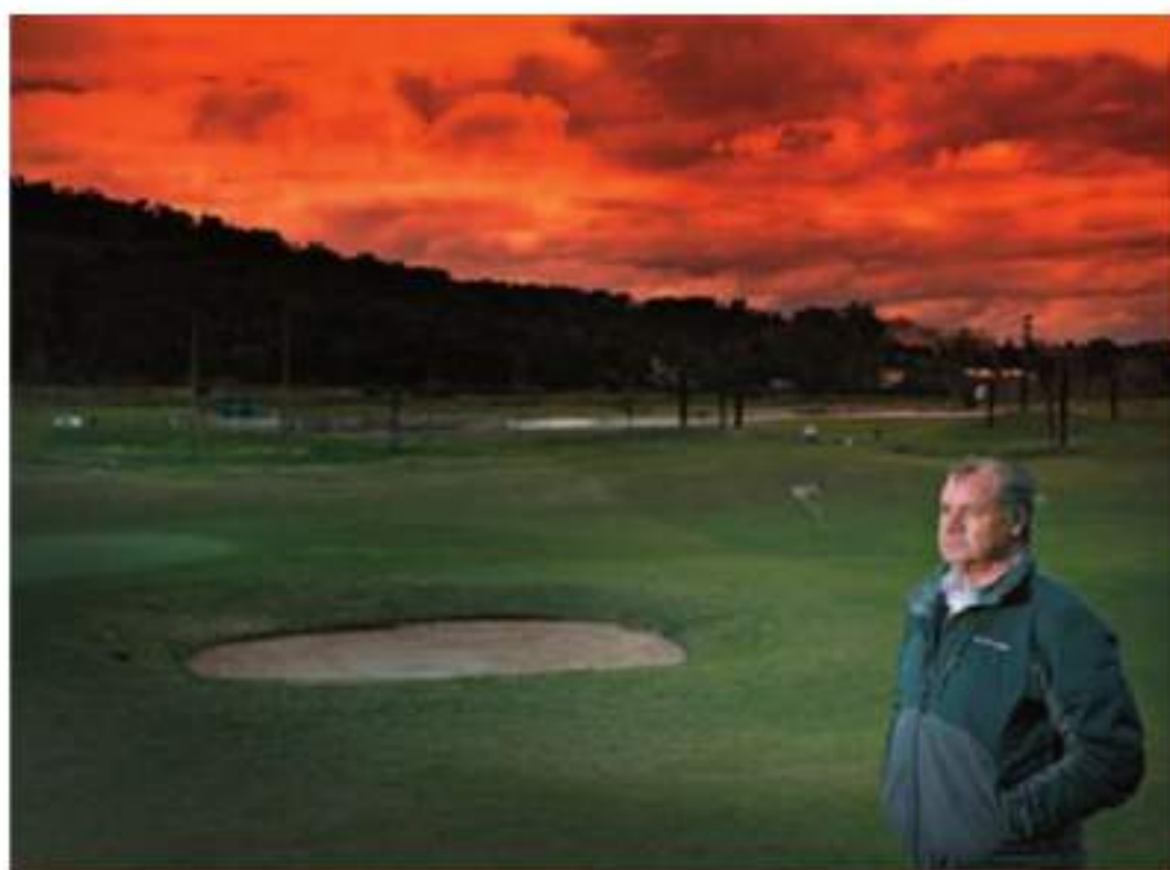
MEMÓRIA. Em 1985 Carlos Lopes corta a meta como vencedor; em 2015 visita o mesmo local, onde agora se encontra campo de golfe

ATLETISMO → HÁ 30 ANOS FOI CAMPEÃO DO MUNDO PELA TERCEIRA VEZ, NO ESTÁDIO NACIONAL