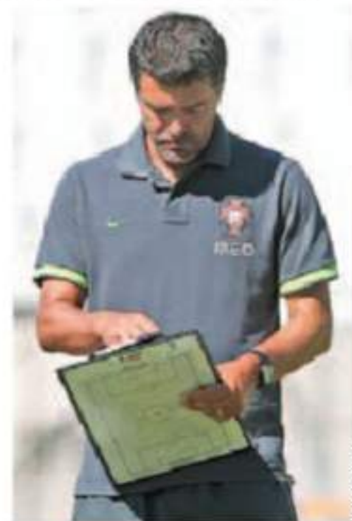
Técnico ciente das dificuldades