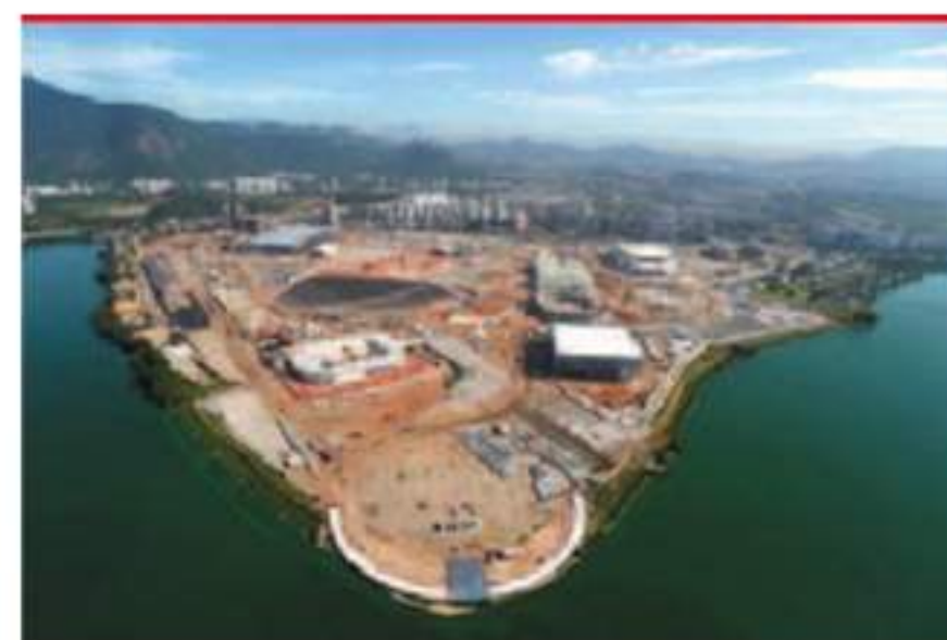
PARQUE. No mês passado, era esta a vista aérea da construção do Parque Olímpico da Barra, que vai ser o epicentro dos Jogos do próximo ano

3 Pelo que já viu “in loco” e pelas informações que vai recebendo, a cidade brasileira está preparada para receber o grande evento? Quando me desloquei ao Rio de Janeiro, em outubro do ano passado, senti o atraso nas obras, mas também um empenho enorme dos brasileiros em resolver os assuntos e problemas.