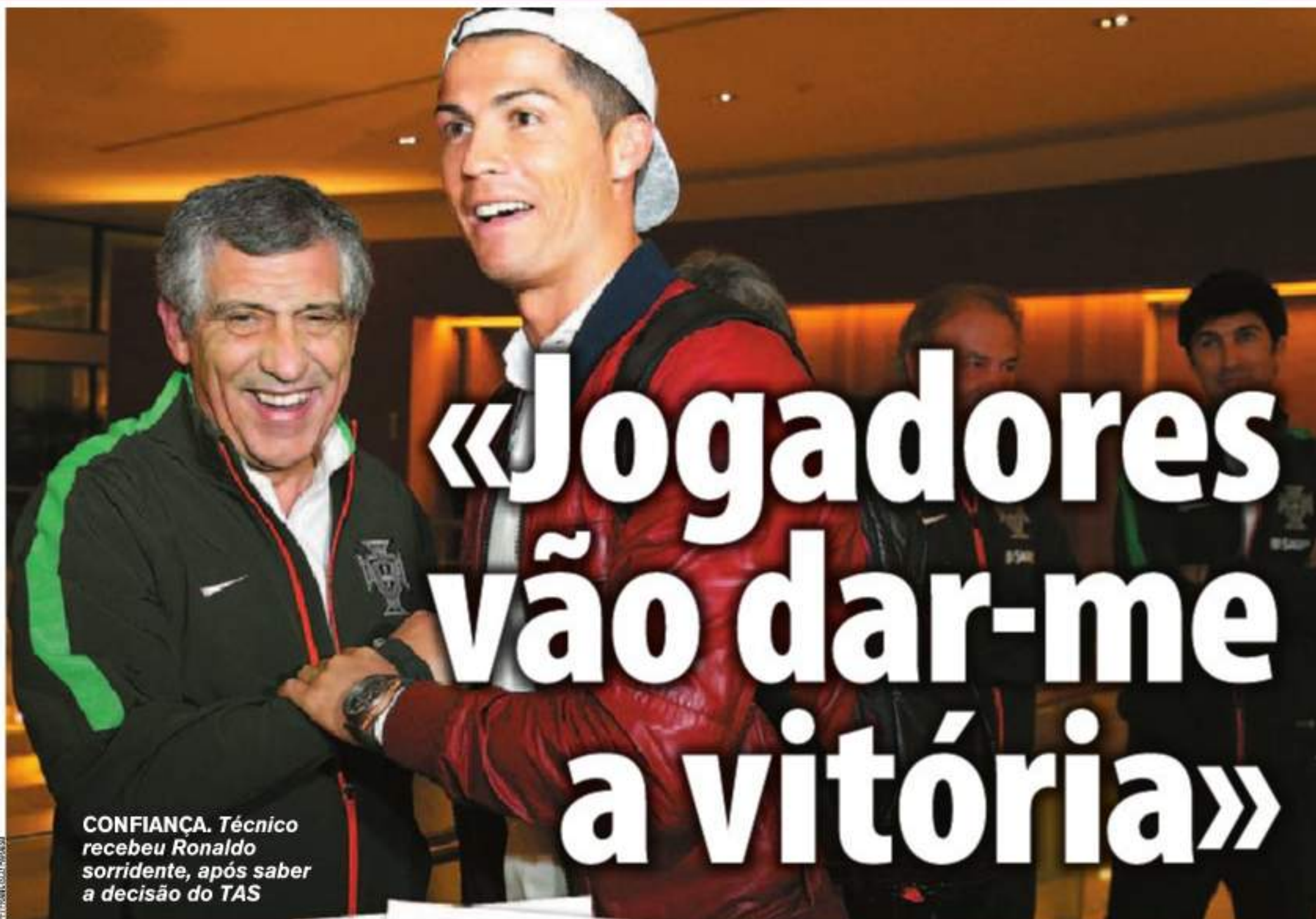
CONFIANÇA. Técnico recebeu Ronaldo sorridente, após saber a decisão do TAS