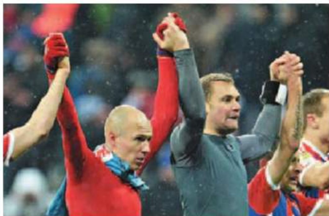
FOCO. Robben e Neuer concentram as atenções em Munique

■ Os golos de Aboubakar e Casemiro frente ao Basileia vão a votos. Os dois portistas são candidatos a autor do melhor golo da 2.ª mão dos oitavos-de-final da Liga dos Campeões, numa votação que está a ser realizada pelo sítio oficial da UEFA. Os dois remates de fora da área fazem parte de uma lista de cinco golos na qual estão incluídos também os momentos de festa de Leroy Sané, do Schalke 04, frente ao Real Madrid; de Thiago Silva, do PSG, ao Chelsea; e de Carlitos Tévez, da Juventus, ao Borussia Dortmund. Esta não é a primeira vez que os dragões se evidenciam neste tipo de iniciativas da UEFA. Brahim e Herrera já integraram votações semelhantes por golos apontados ao BATE Borisov, na fase de grupos e, mais recentemente, o argelino juntou-se a Casemiro na equipa ideal dos jogos da 2.ª mão dos oitavos-de-final. Os dragões estão a dar nas vistas na Europa.