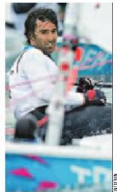
Lima apurou o laser