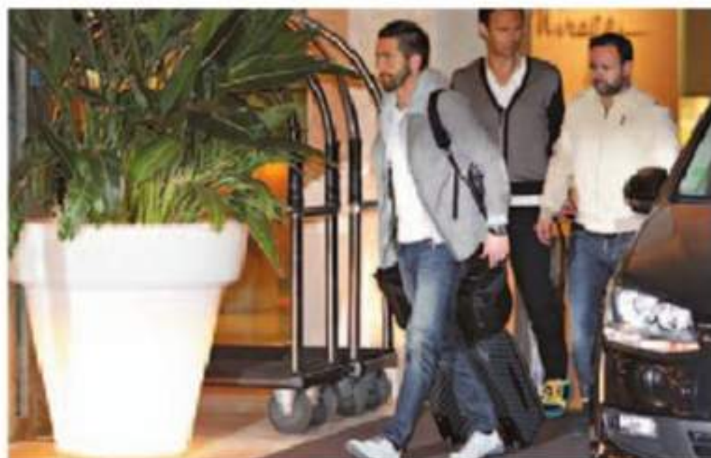
"MONEGASCOS". João Moutinho e Ricardo Carvalho à chegada

TIAGO, DANNY E VIEIRINHA FORAM OS ÚLTIMOS A CHEGAR