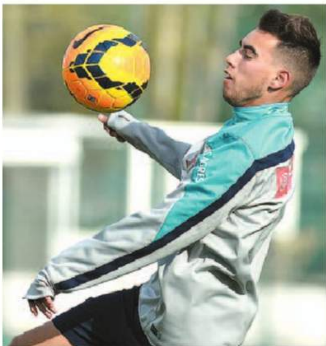
CONFIANTE. Avançado do Málaga elogia qualidade do coletivo

Focado no trabalho. No plano pessoal, o jogador quer deixar uma boa