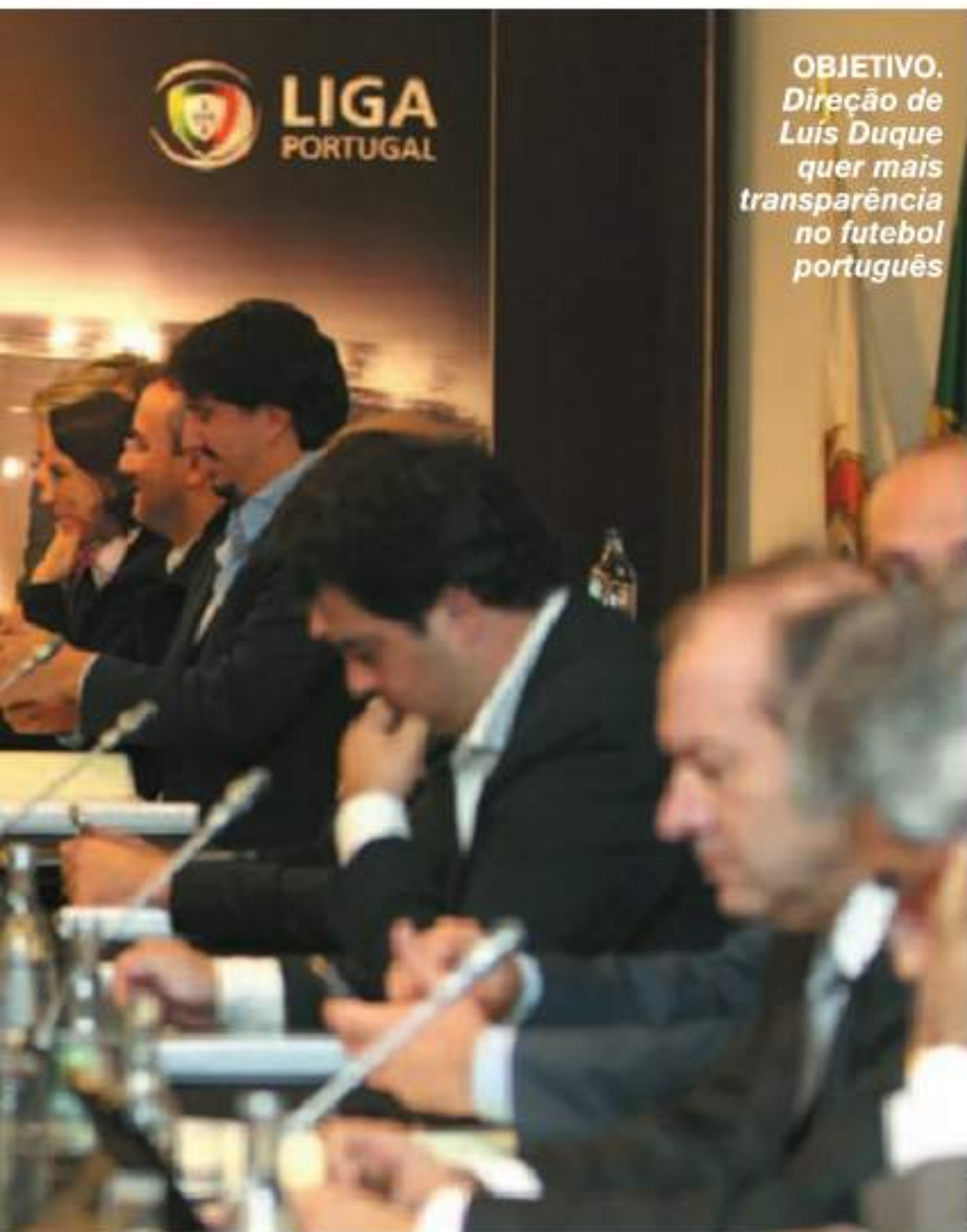
OBJETIVO. Direção de Luís Duque quer mais transparência no futebol português