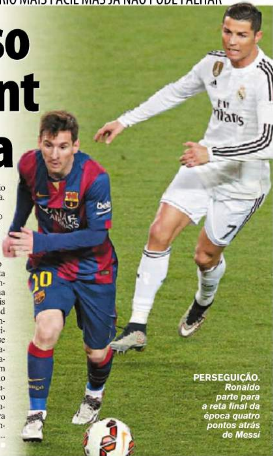
PERSEGUIÇÃO. Ronaldo parte para a reta final da época quatro pontos atrás de Messi

Saldo alimenta sonho. Com o Barcelona a voar ao ritmo de 18 vitórias nos últimos 19 jogos em todas as provas, a tarefa do Real adivinha-se espinhosa. Mas não só o calendário é mais simpático como a resposta dada na 1.ª volta dá esperança aos merengues. Contra estes adversários, o Barcelona somou 22 em 30 pontos possíveis (perdeu com Celta e Real Sociedad e empatou com o Getafe), enquanto o Real somente sofreu um desaire ante o Valencia. Contas feitas, se os resultados se repetissem exatamente da mesma forma, o Real Madrid era campeão com mais um ponto do que os blaugranas. Certo é que Cristiano Ronaldo e companhia já não têm margem de erro para conseguirem ultrapassar a cavalgada dos culés. Na entrada para a reta final da maratona que o campeonato espanhol é, o Barça tem... alguns metros de vantagem.