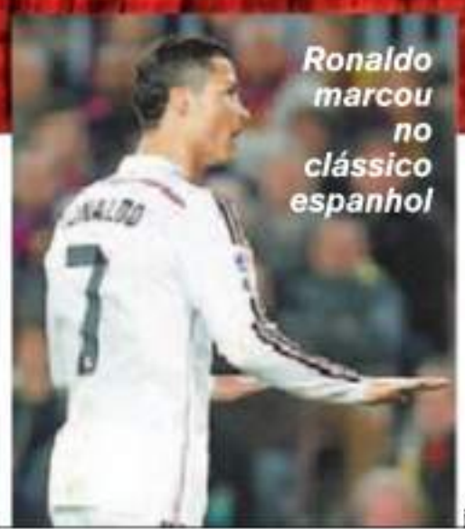
Ronaldo marcou no clássico espanhol