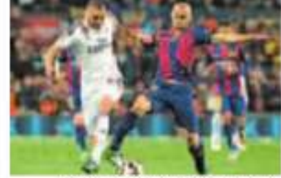
Volte a assistir ao clássico entre o Barcelona e o Real Madrid. A formação onde atua Messi venceu a partida