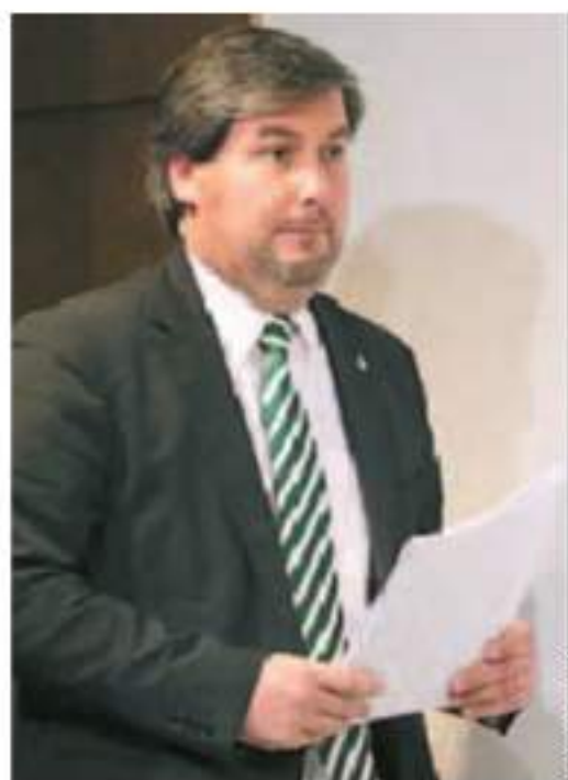
Presidente eleito há dois anos

E que futuro é esse? “Um clube de rigor, competência, transparência, exigência e sobretudo um clube dos sócios e para os sócios”, esclarece, sem disfarçar o orgulho que sente por os sócios lhe permitirem “servir um dos grandes amores” da sua vida.