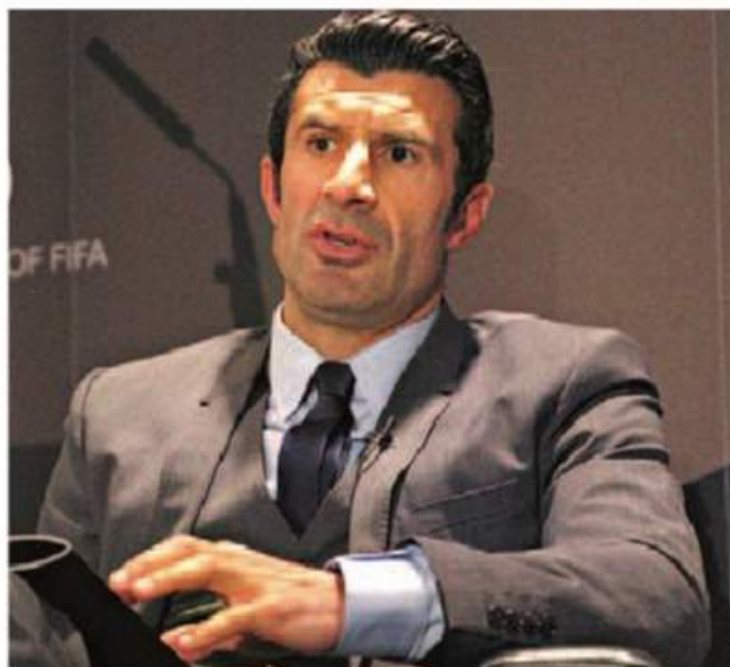
DETERMINADO. Luís Figo procura implementar mudanças na FIFA

■ Para Luís Figo, a necessidade de a liderança da FIFA sair das mãos de Joseph Blatter é evidente. O português, candidato à presidência do órgão máximo do futebol mundial, afirmou que está na hora de algo mudar e garante que tem recebido respostas positivas. "Se nada mudar, serão mais quatro anos perdidos em matéria de transparência e modernização. A maior parte das pessoas diz que é preciso mudança, mas no dia 29 de maio vamos ver se o querem real-