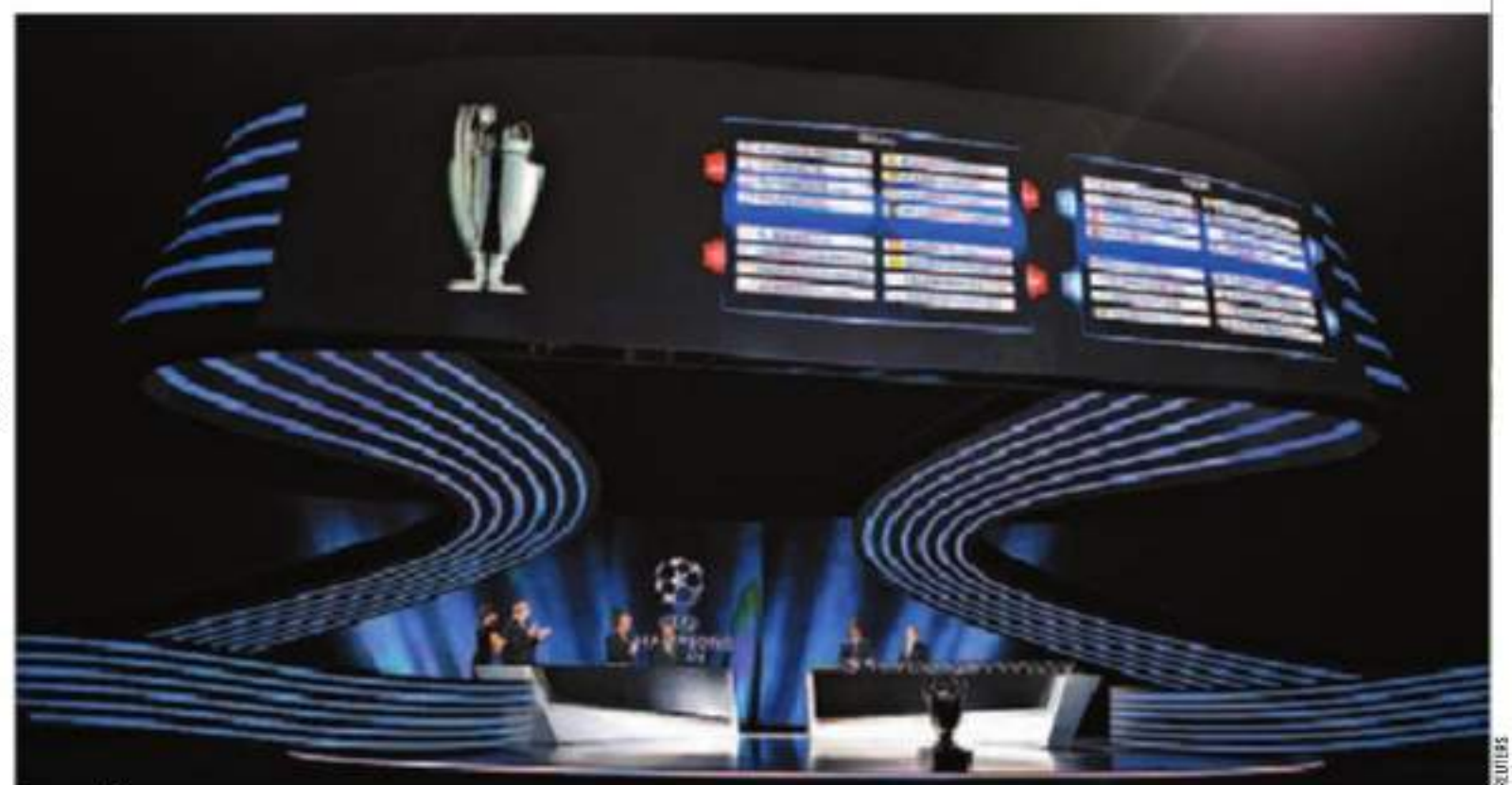
MILHÕES. A próxima edição da Liga dos Campeões terá incentivos financeiros ainda mais aliciantes

SAD INVESTE 25 MILHÕES ESTA ÉPOCA E LUCRA 11,1 COM ENTRADA NA PROVA MILIONÁRIA