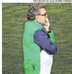
Treinador vai, para já, ficar na Costa Rica

«No nosso país, apesar de ter salvo o Casa Pia, Praisene e Horta das despromoções, não tenho hipótese de trabalhar. É verdade, quero que eu continue a supervisionar a formação jovem do Carmelita, que funciona à margem da equipa principal, que acompanhe mesmo os miúdos