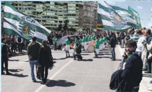
Os tambores dos Toca a Rufar na festa de lançamento da primeira pedra