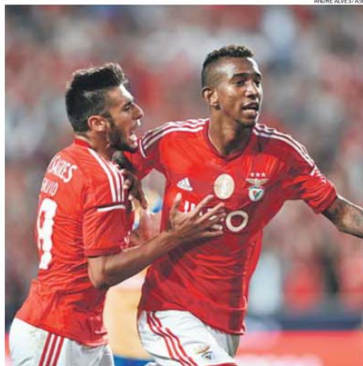
Salvio tem cláusula de rescisão de €60 milhões e Talisca de €30 milhões