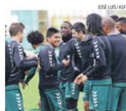
Boa disposição reinou entre o plantel

A boa disposição reinou entre os atletas que, embora tenham terminado a sessão estafados, gozarão agora três dias de folga, tendo em conta que o próximo jogo está agendado apenas para 6 de abril.