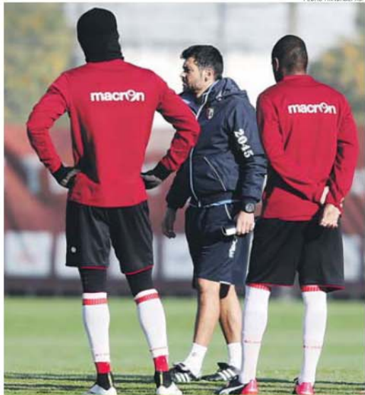
Sérgio Conceição quer os jogadores apenas concentrados nos jogos que se avizinham

O castigo de 20 dias aplicado a Sérgio Conceição servirá (ou é pelo menos essa a ideia do treinador) para juntar o grupo. O treinador