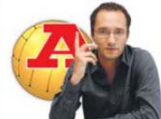
por MIGUEL CARDOSO PEREIRA