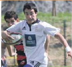
Seleção joga terça com a Escócia

Face a esta derrota, a Seleção vai disputar um lugar entre o 5.º e o 8.º e último lugar quando defrontar a Escócia, na próxima terça-feira. Outros resultados da 1.ª jornada: França-Escócia, 22-10; Irlanda-Geórgia, 8-8 e País de Gales-Itália, 13-14. Inglaterra-França e Geórgia-Itália protagonizam as meias-finais. A. A.