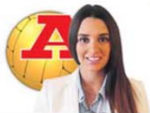
por TÂNIA FERREIRA VÍTOR

O espaço onde o futebolista deixa o relvado e mostra o que poucos conhecem