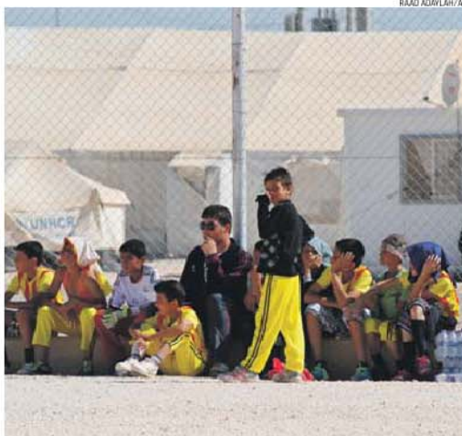
Crianças sírias reunidas no campo de refugiados de Zaatar, em Mafrak

A União Europeia aprovou, esta semana, o programa português de acolhimento de imigrantes e de melhoria dos procedimentos de asilo, orçado em cerca de 34 milhões de euros. João Almeida salientou a importância das verbas e deixou a garantia de que serão direcionadas para as ONG portu-