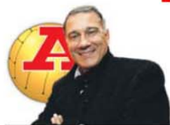
por JOSÉ EDUARDO