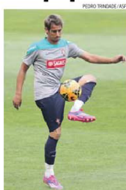
Fábio Coentrão está de volta à Seleção

«Nunca escondi o prazer que tenho em jogar no Estádio da Luz. Claro que fico contente por poder desfrutar de mais um jogo na Luz, representando o nosso País. Neste momento, é o estádio ideal para conseguirmos um bom resultado no domingo», exultou o lateral-esquerdo, em declarações à FFP.