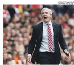
Mark Hughes, treinador de 51 anos

Treinador galês, de 51 anos, tinha contrato até junho do próximo ano