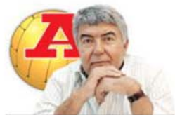
por VÍTOR SERPA

Pinto da Costa anuncia um canal para defender o Norte mas isso, do ponto de vista desportivo, iria contra o interesse de crescimento do FC Porto