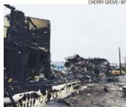
Explosão originou incêndio noutros edifícios