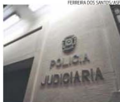
PJ logrou deter alegado gangue

Um indivíduo que era perseguido pela Justiça há cerca de 20 anos foi capturado pela Polícia Judiciária (PJ) de Leiria e vai ser presente a tribunal para interrogatório. O homem, de 47 anos, é suspeito de ter cometido um crime em Cabeço de Vide e de se ter refugiado longo tempo em Espanha, assumindo outra identidade.