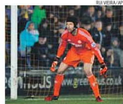
Petr Cech está no Chelsea desde 2004

Guarda-redes do Chelsea está na 'sombra' de Courtois e quer participar no Euro-2016