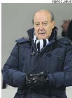
Pinto da Costa anunciou investimento

Não é expectável que o Porto Canal se torne, do ponto de vista do conceito editorial, um canal televisivo que procurará zelar pelo supremo interesse e pelo crescimento dos clubes do Norte, porque tal significaria condicionar o próprio crescimento do FC Porto, ou seja, o crescimento daquele que será o dono do canal.