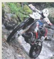
» 20.34 – Nacional de Enduro: Castelo Branco