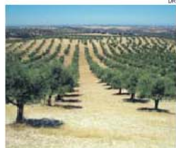
A oliveira é uma das riquezas do País

→ Já atingiu o sul da Itália. Portugal, França e Espanha temem, mas os 28 não se entendem