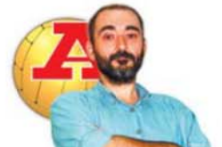
por LUÍS AFONSO

HÁ CONSENSO PARA A ENTRADA DA SÉRVIA NA UNIÃO EUROPEIA.