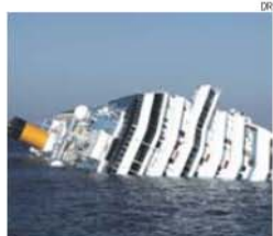
‘Costa Concordia’ naufragou em 2012

→ Investigadores descobriram carregamento de drogas pertencente à máfia italiana