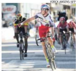
Kristoff é uma das figuras da Katusha

Com seis triunfos na presente temporada, o norueguês Alexander Kristoff, da Katusha, continua a ser uma das principais referências na equipa russa liderada pelo português José Azevedo. Na 1.ª etapa dos Três Dias de La Panne, cumprida entre La Panne e Zittgem (189,1 km), e que apresentava 13 subidas, Kristoff integrou o grupo de seis fugitivos que se formou a 45 km da meta, para no sprint final se im-