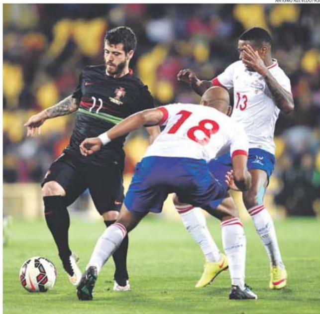
Vieirinha foi um dos melhores jogadores de Portugal na noite de ontem