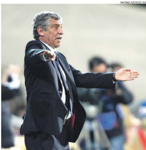
Fernando Santos criticou a falta de velocidade da equipa na primeira parte

Para Fernando Santos «faltou velocidade, faltou dinâmica de jogo, principalmente agressividade, e depois houve período de desconcentração total, 10 minutos na primeira parte em que parecia que o jogo estava entredito e em alta competição isso paga-se caro». O selecionador revelou ter feito ver aos jogadores «que o jogo para Cabo Verde era muito importante», avisos que, contudo, não surtiram efeito. De resto, e já na sala de imprensa, fez questão de realçar que «em termos de qualidade in-