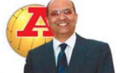
por CARLOS CARDOSO