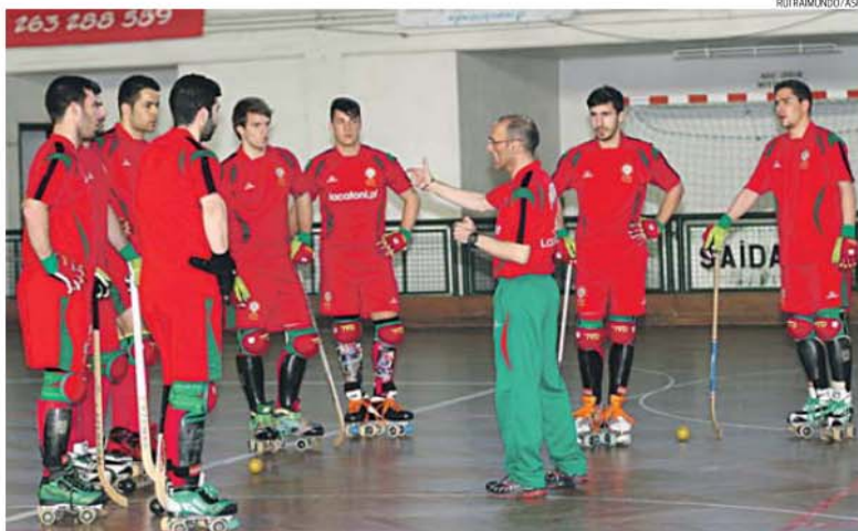
Luis Sénica dá indicações aos jogadores de campo da Seleção Nacional durante o estágio em Vila Franca de Xira

bracadeira, como aconteceu noutras escalões. Grande parte destes jogadores cruzou-se ainda em clubes, de norte a sul, sem esquecer o Valongo, pelo qual cinco se sagraram campeões de Portugal em 2013/14.