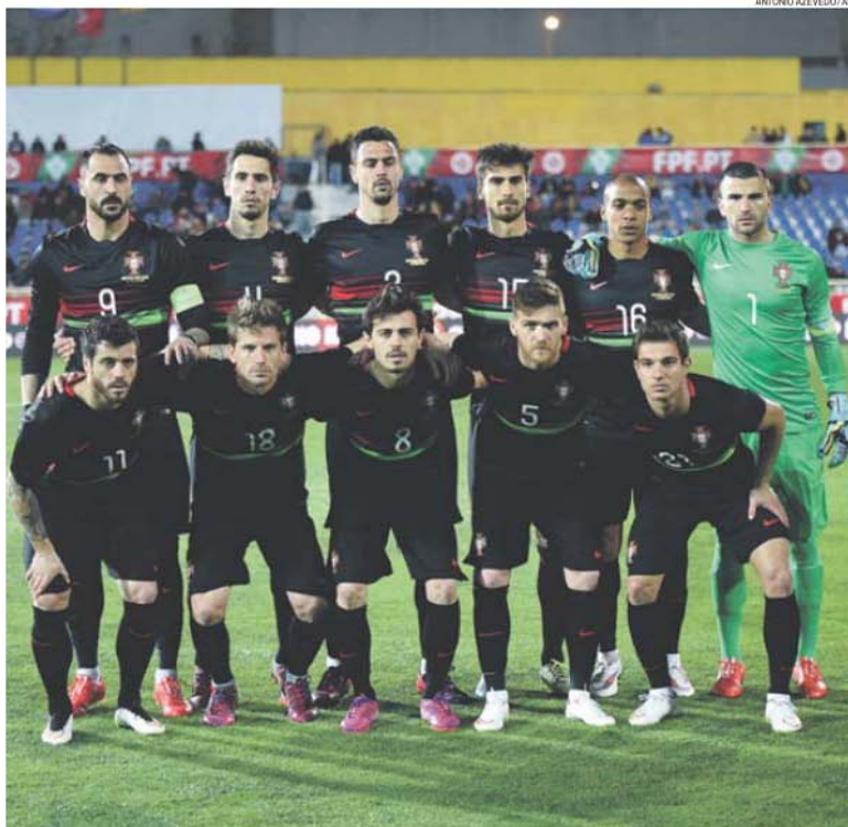
Hugo Almeida, Paulo Oliveira, André Pinto, André Gomes, João Mário, Patrício, Vieirinha, Adrien, Bernardo Silva, Antunes e Cédric

É verdade que não era a melhor equipa da Seleção. Nem a segunda melhor equipa da Seleção. Nem era bem uma equipa, na verdade