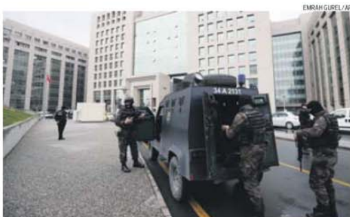
Sequestradores e polícia tentaram negociar durante seis longas horas, junto ao tribunal

Durante o dia de ontem surgiram imagens nas redes sociais onde o procurador aparecia com uma arma apontada por um homem de cara tapada e nessas imagens era visível a bandeira da Frente Revolucionária