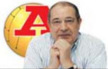
POR EDUARDO BARROSO

Selecionar é escolher. E escolher a curto prazo é... fácil. Porque difícil era não ser apurado para o Euro. É o tempo ideal para renovar! Desde já!