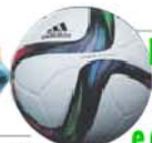
POR RUI BAIONETA

Diego Rubio, 21 anos, passou a usufruir de um rendimento de cerca de €800 mil por ano