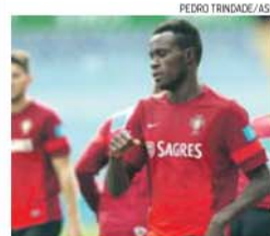
Bruma será reavaliado nos próximos dias

→ Extremo do Galatasaray substituído na primeira parte; Iuri Medeiros aproveitou oportunidade