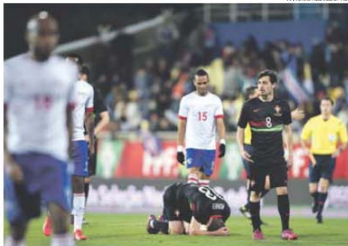
Portugal desorientado e sem atitude explica porque Cabo Verde saiu vencedor

para o futuro. É verdade que raramente estes jogadores jogaram juntos, mas nalgumas zonas a dessincronização foi total, prin-