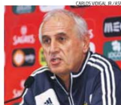
Challandes já não defronta Portugal

A federação tunisina pediu desculpa à CAF (Confederação Africana de Futebol), que acusara de favorecer a anfitriã do CAN-2015 (a Guiné Equatorial), o que pode abrir portas à seleção na próxima edição da prova.