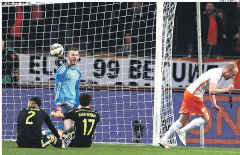
De Gea irritado pouco depois de sofrer o segundo golo, obra de Klaassen, que festeja

sa noite, com coro de assobios. Contudo, ainda mais frescos na memória estão os 5-1 do último Campeonato do Mundo, favoráveis à seleção laranja.