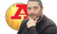
POR NUNO PERESTRELO