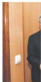
Presidente nas instalações

de Língua Oficial Portuguesa e que esta é relação tão forte que não terá fim. Numa breve cerimónia onde