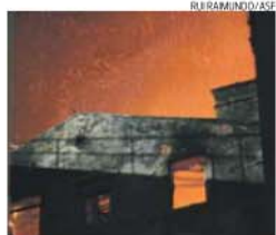
Fogo deflagrou na zona industrial

O pedido de renúncia será feito às 10.30 horas, na reunião de câmara que António Costa ainda deverá conduzir. A comunicação será feita no final e produzirá efeitos imediatos. No entanto, António Costa só perderá todos seus poderes quando apresentar a renúncia por escrito. Caberá então à presidente da Assembleia, Helena Roseta, convocar o sucessor. Segundo a lei terá de ser o número dois da lista às eleições — que é Fernando Medina.