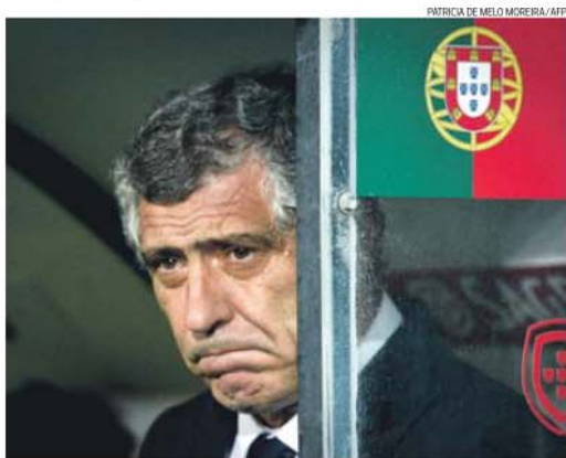
«Nada tenho contra Fernando Santos. Mas, se eu mandasse, alguns teriam outro papel...»

PS: Não tenho nada contra Bosingwa, Ricardo Carvalho, Danny ou mesmo Tiago. E muito menos contra Fernando Santos. Mas na minha seleção, se eu mandasse, eles teriam de ter outro papel, outras regras e outro comportamento. Mas ainda vamos a tempo.