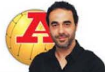
POR NÉLSON FEITEIRONA