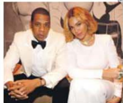
Jay-Z e Beyoncé unidos contra Spotify