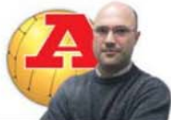
POR ANDRÉ PIPA