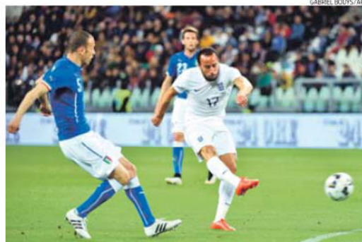
Townsend dispara e marca grande golo para a seleção inglesa em Turim

Noutra nota, o médio do Palermo Franco Vázquez, argentino naturalizado italiano, fez a sua estreia na turma de Antonio Conte, substituindo o... brasileiro Eder.