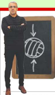
por DIAMANTINO MIRANDA

A Federação Portuguesa de Futebol celebrou ontem o 101.º aniversário, comemorações nas quais se integrou o jogo de ontem com Cabo Verde. A Federação conta presentemente com 17 seleções e organização, por época, 25 competições.