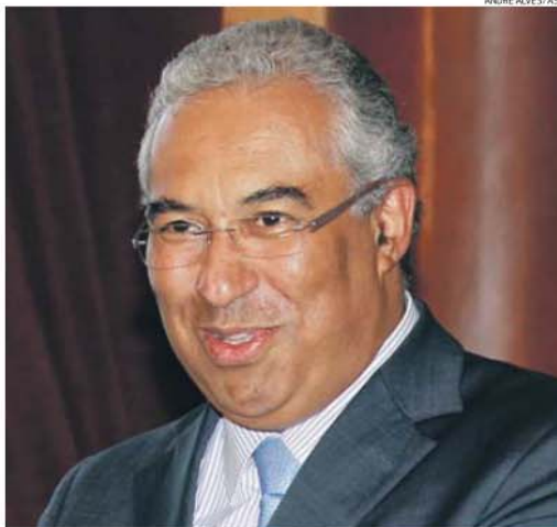
António Costa apresenta esta manhã a renúncia à presidência da Câmara de Lisboa

Fernando Medina, atual vice-presidente, deverá ocupar o car-