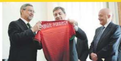
Fernando Gomes ofereceu camisola da Seleção a Jorge Carlos Fonseca