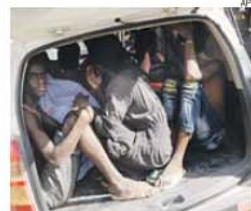
Estudantes protegendo-se numa viatura

Segundo notícia da Lusa, um grupo opositor cubano denunciou, ontem, que foram registadas 610 detenções arbitrárias por motivos políticos em Cuba durante o mês de março, o número mais elevado dos últimos sete meses.