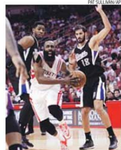
Harden soma nove jogos com mais de 40 pt