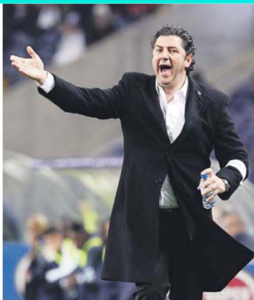
Rui Vitória, treinador do V. Guimarães, revela confiança num bom resultado esta tarde

Confrontado com a necessidade de ganhar nesta ronda ao Arouca e sobre a pressão que possa existir nos jogadores, Rui Vitória atirou-a rapidamente para canto: «Quem quer ser profissional de alto nível e subir na carreira tem de lidar com momentos de derrota. Muitas vezes esses são momentos de aprendizagem e mais tarde vamos recordar para o nosso crescimento. Olho para isso de forma natural. O passado já foi e ainda há oito jogos pela frente.»