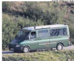
Buscas da GNR surtiram efeito