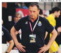
Técnico vai estar hoje na bancada

«Esperamos jogos muito equilibrados, que serão resolvidos nos pormenores, como foi na Taça. Mas estamos cientes do nosso objetivo, pelo que vamos fazer tudo para voltar às vitórias e, jogando em casa, esperamos casa cheia», dis-