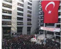
Milhares de pessoas no funeral de Kirazce

A justiça turca abriu, ontem, inquérito a quatro jornais acusados de promoverem «propaganda terrorista», depois de terem publicado a imagem de um procurador feito refém por militantes armados durante um ação em que eles foram abatidos.