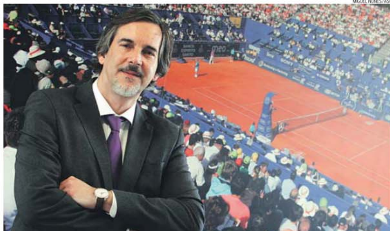
Secretário de Estado do Desporto e Juventude, Emídio Guerreiro, salientou a importância do instrumento de apoio governativo

estará reunida na plataforma digital e multilingue em setembro, numa iniciativa do Governo relativa à Carta Desportiva Nacional. A compilação dos dados sobre os equipamentos desportivos, com informações cadastrais e técnicas das infraestruturas e o nível de ocupação, eventos e horários a cada período de 30 dias, é ambição antiga do Governo e motivou candidatura do Instituto Português do Desporto e Juventude (IPDJ) ao Sistema de Apoio à Modernização Administrativa, no quadro do COMPE-TE, segundo dado de 2013. A implementação do projeto estava prevista para o final deste ano, mas o secretário de Estado do Desporto e Juventude, Emídio Guerreiro, está confiante na antecipação do prazo. «Apontamos o lançamento desta plataforma para setembro. O IPDJ celebrou um protocolo e um contrato de 60 mil euros com o Instituto do Território com vista ao apoio técnico, implementação e gestão do sistema. Cabe ainda ao