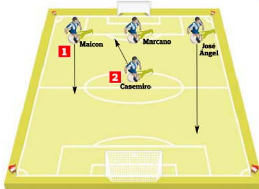
1 → Maicon não deu profundidade na direita 2 → Casemiro baixava no processo defensivo