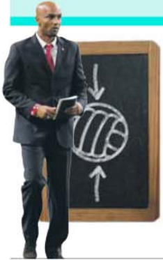
por DAÚTO FAQUIRÁ