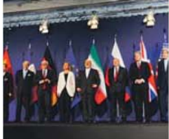
Foto de família no final do encontro

O presidente dos EUA, Barack Obama, saudou, ontem, como «histórico» o acordo sobre o programa nuclear do Irão que será, segundo disse, objeto de «inspeções sem precedentes». «Hoje, os Estados Unidos, com os seus aliados e parceiros, concluíram um acordo histórico com o Irão que, se for plenamente aplicado, impedirá a obtenção da arma nuclear», disse. O entendimento foi alcançado ao final de uma semana de intensas negociações e dois dias depois do prazo inicialmente previsto entre o grupo 5+1 (EUA, China, Rússia, Reino Unido e França) e a Alemanha e o Irão.