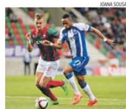
Bauer e Hermâni na derrota do FC Porto

A final será em Coimbra, talvez a 25 de abril. A data não está ainda definida, pois no dia seguinte realizam-se o Benfica-FC Porto para a Liga e o Estoril-Marítimo. Terá de haver reajustamentos, sendo que a Liga prefere manter a data da final da Taça da Liga e adiar os dois jogos do campeonato, enquanto o Benfica prefere adiar o jogo com o Marítimo para finais de maio. Não se sabe, ainda, qual a posição dos maritimistas relativamente a este caso, sendo que FC Porto (ainda com jogos da Liga dos Campeões) e o Estoril terão também uma palavra a dar.