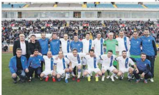
Foto de família da seleção helénica de novo sob os ordens Rehhagel (em cima, 2.º da esq.)