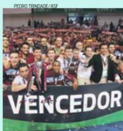
Fundão é o detentor do troféu masculino

Recorde-se que, em masculinos, estão apurados Fundão, atual detentor do troféu, Modicus, Benfica e Sporting, enquanto em femininos as equipas presentes serão a Quinta dos Lombos, Leões Porto Salvo, Novasement e Sporting. Os jogos terão lugar de 1 a 3 de maio. Os leões, de resto, são o único clube, esta época, representado com as duas equipas seniores.