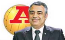
por JOSÉ COUCEIRO