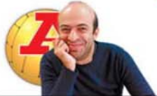
por JOÃO BONZINHO

Que preço pagará Lopetegui pelos equívocos se vier a falhar rotundamente esta época?