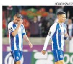
Dragões de rostos fechados no final do jogo

→ Jogadores em silêncio, mas Pinto da Costa ainda tirou algumas fotografias