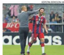
Josep Guardiola e Xabi Alonso

→ Médio do Bayern, que elogia Guardiola, pretende a conquista da Champions por três clubes