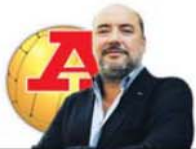
POR PEDRO MARQUES LOPES

Claro que para os génios da nossa praça mudar um plantel quase todo e construir uma equipa são coisas para se fazer durante um cafezinho