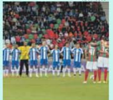
Minuto de silêncio nos Barreiros

FC Porto dominou mas não teve soluções para ultrapassar a defesa do Marítimo. Faltou Jackson