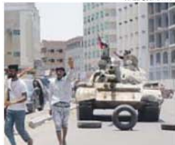
Tanque das tropas do governo, em Aden

Os rebeldes xiitas e aliados tomaram, ontem, o palácio presidencial de Aden, no sul do país, onde o Chefe do Estado se tinha refugiado antes de fugir para a Arábia Saudita, disse fonte dos serviços de segurança. «Dezenas de milicianos hutis e aliados, chegados em blindados e veículos de transporte de tropas, acabam de entrar no palácio presidencial Al-Maachiq», disse à AFP o oficial que testemunhou a chegada dos rebeldes, citada pela Lusa. Este avanço ocorreu ao oitavo dia da campanha aérea que vem sendo levada a cabo por uma coligação liderada pela Arábia Saudita.