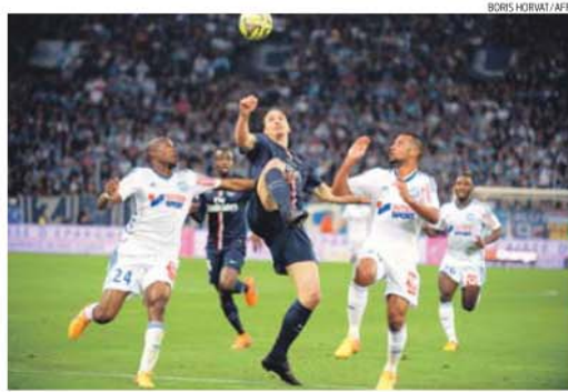
Ibrahimovic (ao centro) tenta, com agilidade, sair da marcação dos homens do Marselha

GOLAS 1-0, por Gignac (30); 1-1 por Matuidi (35); 2-1 por Gignac (43); 2-2, por Marquinhos (49); 2-3, por Morel (51 p.b.) DISCIPLINA Cartão amarelo a Romão (9), Fanni (23) e Ayew (54); Pastore (45) e Verratti (65): cartão vermelho a Ayew, por acumulação (apos o final do jogo)