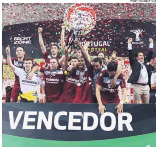
Fundão é o atual detentor da Taça de Portugal masculina, conquistada em Oliveira de Azeméis

«O futsal é uma das modalidades com mais adeptos no nosso País e esta é uma das suas competições mais importantes. Pela dinâmica associada à presença das equipas, pelo número de visitantes que vai atrair e pela cobertura mediática que vai merecer, estamos certos que trará benefícios muito relevantes para