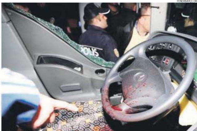
O sangue do motorista no volante e o estado em que ficou o autocarro que transportava a comitiva do Fenerbahçe de Rize a Trabzon perante a estupefação de quem seguia no veículo