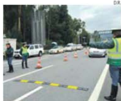
Operação Páscoa visa controlar as estradas

Seis pessoas morreram nos primeiros três dias da Operação Páscoa da Guarda Nacional Republicana, que registou 566 acidentes nas estradas portuguesas, segundo o balanço provisório feito pela GNR.