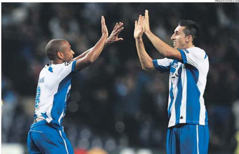
Brahimi e Herrera voltam ao onze a seguir à derrota na Madeira