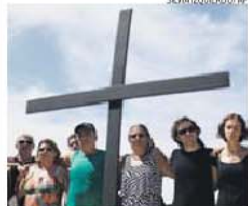
Brasileiros uniram-se pela criança morta