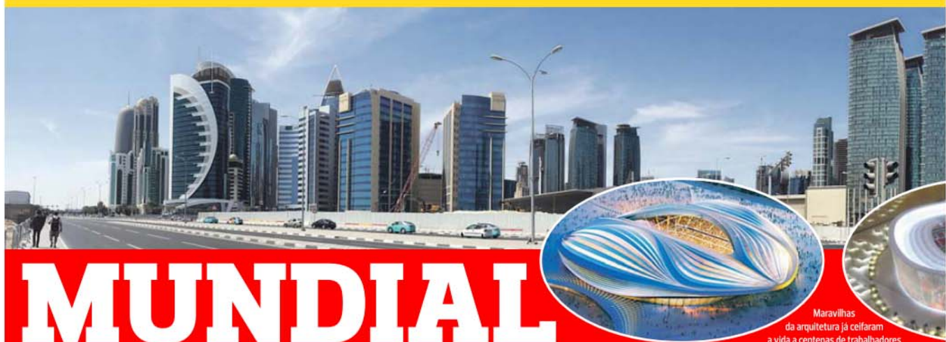
Maravilhas da arquitetura já ceifaram a vida a centenas de trabalhadores

A imponência e modernismo do Catar, pequeno emirado pouco maior que dois Algarves, contrastam com as condições de trabalho retrógradas e com as faltas de direitos dos imigrantes, denunciadas por várias organizações internacionais