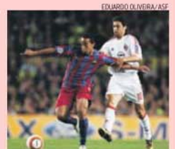
Ronaldinho Gaúcho e Rui Costa: génios

➔ Na realidade, o nome completo é vaca de costas . Edmundo, antigo goleador do Brasil, fazia muito bem: de costas para a baliza, tocava de primeira na bola, dando-lhe efeito, fazendo com que contornasse o defesa. Depois, golo. Bergkamp, outro dos que a usavam.