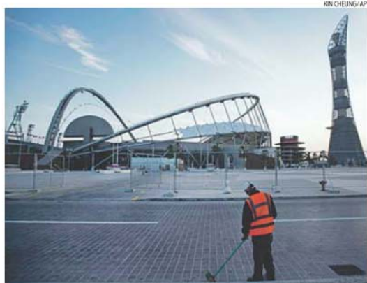
O Catar-2022 terá 12 estádios, todos construídos de raiz