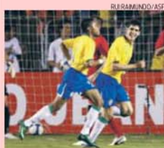
Robinho festeja golo do Brasil, com Kaká