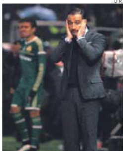
Quarta derrota de Vitor Pereira na Grécia

Quarta derrota do Olympiakos na Superliga grega. A equipa de Vitor Pereira afogou-se no relvado alagado de Giannina (choveu copiosamente), por 1-3, mas continua confortavelmente instalada no primeiro lugar, com nove pontos de avanço sobre o Panathinaikos. «Na primeira parte criámos várias oportunidades de golo, mas não as aproveitámos. O adversário marcou nas duas que teve. Conseguimos reduzir e quando estáva-