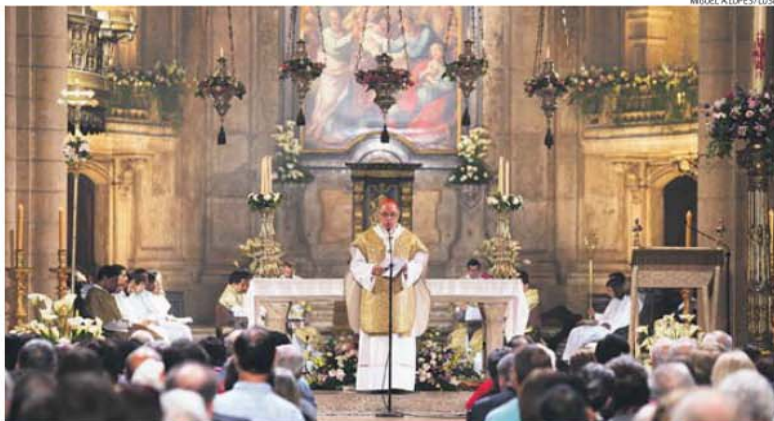
MIGUEL A. LOPES/LUSA

Apesar de ter ficado sem a habitual visita pascal, a população assegurou que pretende continuar o braço de ferro com a Diocese do Porto.