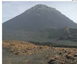
Vulcão do Fogo causou muitos transtornos

O navio Rio M bridge chegou ontem à tarde ao porto de Vale dos Cavaleiros, próximo de São Vicente, em Cabo Verde, com a segunda remessa de ajuda humanitária disponibilizada pelo governo de Angola. Segundo a Infopress , as cerca de 500 toneladas de materiais destinam-se sobretudo às operações de reconstrução das zonas afetadas pela erupção vulcânica que assolou a ilha do Fogo, entre 23 de novembro de 2014 e 8 de fevereiro deste ano. Em declarações à agência cabo-verdiana, o agente do navio, Henrique Pires, explicou que os materiais foram divididos em 25 contentores.