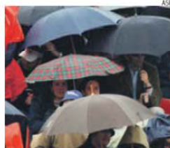
Os guarda-chuvas vão voltar a ser precisos

tudo indica, as temperaturas máximas vão descer gradualmente durante a semana, mas as tempe-