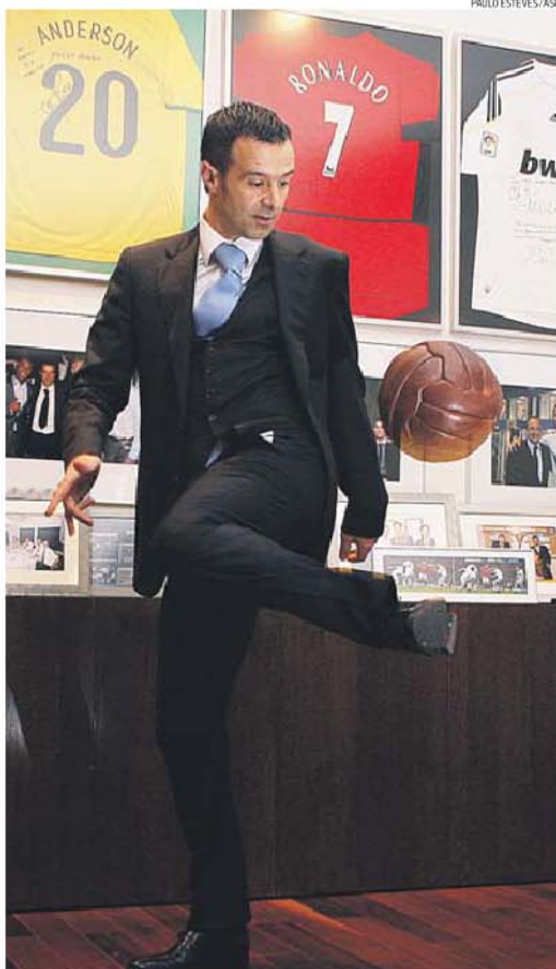
Jorge Mendes, como ex-agente FIFA, só terá de registar-se na FPF dentro de três anos

Deve sublinhar-se que a FIFA não se demitiu de regular os intermediários no mundo do futebol, até porque criou novos Regulamentos sobre o Trabalho com Intermediários. Porém, agora, aconselha as federações a criarem leis próprias de modo