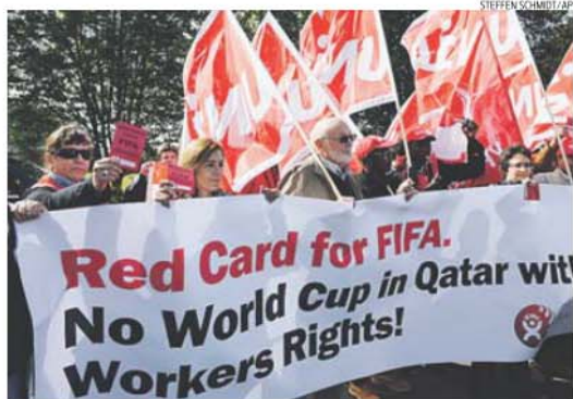
A FIFA tem estado na mira de manifestantes um pouco por todo o mundo

As autoridades do Catar negam estas queixas e denúncias ou alegam que elas não têm razão de ser, mas ao mesmo tempo vão dizendo que estão a rever e a melhorar as leis do trabalho, tendo em vista precisamente melhorar as condições de vida e de trabalho dos trabalhadores estrangeiros.