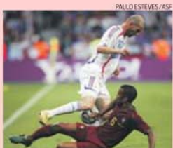
Zidane em duelo de gigantes com Costinha

➔ A maior parte dos nomes para fintas vem da América do Sul, de países como Argentina e Brasil. E foi Robinho, génio brasileiro do presente, a ficar com a patente da pedalada . Passar sucessivamente as pernas sobre a bola. Cristiano Ronaldo também o faz: bicicletas .