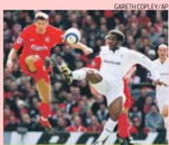
Gerrard e Okocha, encontro de craques

➔ Zinedine Zidane tinha aquela forma magistral de conduzir a bola e não apenas em corrida ou de frente para a baliza. Um dos lances que fazem lembrar o médio francês é a famosa roleta . Rodava sobre si próprio, com tudo sob controlo: a bola passava de um pé para o outro.