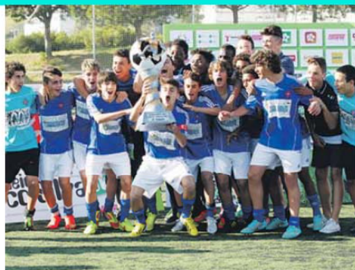
Jovens belenenses eufóricos com a conquista do troféu entregue pelo treinador do Sporting