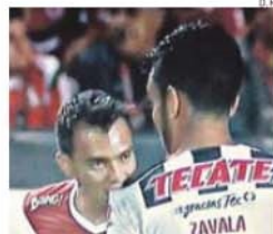
O momento da dentada