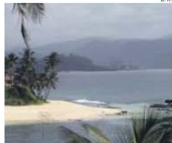
Vista sobre São Tomé e Príncipe