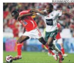
Mantorras, fenómeno angolano das águias