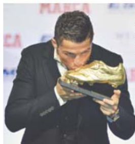
CR7 ganhou a Bota de Ouro em 2008, 2011 e 2014 (esta à 'meias' com Luis Suárez)