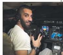
A foto de Turan que está a agitar a Turquia

O avançado do Zenit não voltou a ser chamado desde que Dunga passou a selecionador. «É difícil falar. Com os outros jogadores falo porque são amigos. Não sei o motivo para não ser convocado. Acredito que seja por opção», diz Hulk ao Globoesporte .