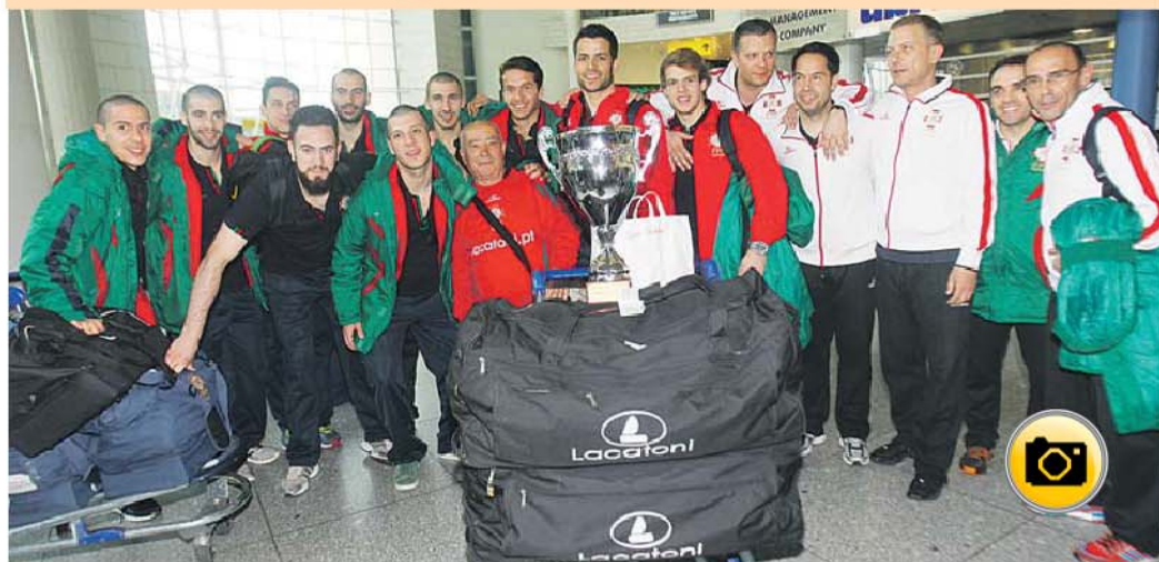
Seleção Nacional conquistou a Taça das Nações pela 18.ª vez, 4.ª seguida