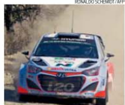
Primeiro piloto em ação foi Thierry Neuville