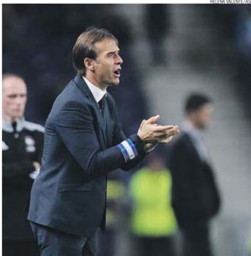
Lopetegui elogiou o ataque mas evitou antecipar o clássico com o Benfica