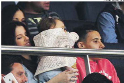
Tello assistiu ao jogo com o Estoril na tribuna com a mulher e a filha

Portanto, Bayern e Benfica são autênticas miragens.