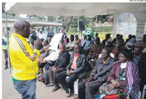
Funcionário lê os nomes de muitas vítimas mortais numa cerimónia fúnebre em Chiromo

Segundo relatos de testemunhas, o comando deixou sair da instituição todo o que eram muçulmanos e abateu sistematicamente os cristãos. A mortandade só terminou quinze horas depois, quando a polícia conseguiu pôr termo ao banho de sangue, que, contudo, não teve na imprensa internacional a repercussão nos media internacionais nem manifestações de dor e consternação imediatas, como o acidente intencional do avião da Germanwings, do dia 24 de março, ou os atentados de Paris, de janeiro último.