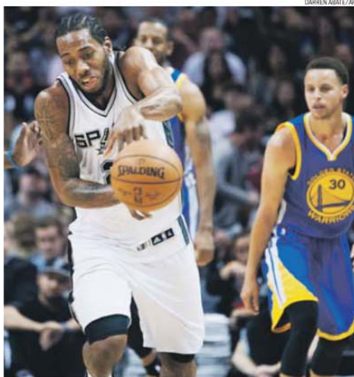
Kawhi Leonard marcou 26 pontos no êxito dos Spurs sobre os Warriors

De regresso, oito meses após dupla fratura da tibia direita, esteve Paul George, sendo muito saudado pelos adeptos. Esteve 15 minutos em campo, suficiente para obter 13 pontos, 2 ressaltos e outras tantas assistências, permitindo aos Pacers, relançar-se na corrida aos-play-off ao bater os Heat, adversário direto para a qualificação. «Voltar à competição talvez seja o maior momento da carreira. Foi como sonhei. Uma das razões pelas quais renovei o contrato e resolvi fazer parte do futuro desta equipa são os adeptos», afirmou George.