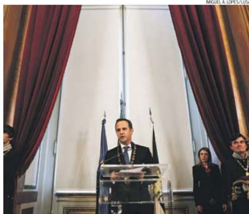
Fernando Medina, novo presidente da câmara de Lisboa, discursando na tomada de posse

F ERNANDO MEDINA já é oficialmente o novo presidente da Câmara Municipal de Lisboa. A cerimónia de tomada de posse decorreu, ontem, no Salão Nobre dos Paços do Concelho, na presença de alguns ilustres convidados, nomeadamente os antigos Chefes do Estado, Mário Soares e Jorge Sampaio, bem como o eventual candidato a Belém, Sampaio da Nóvoa. «Em Lisboa, nós não desistimos. Em Lisboa, nós não recuamos perante as dificuldades da conjuntura», disse o autarca num discurso em que assegurou assumir com «vontade e determinação»