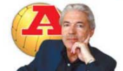
por FERNANDO GUERRA

Jesus e Lopetegui, em vez de imporem os seus méritos, e os dos seus jogadores, preferem jogar aos erros dos árbitros