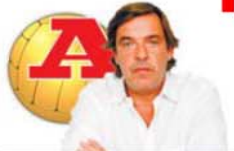
POR MIGUEL SOUSA TAVARES

Será chocante se o FC Porto, com este plantel fabuloso, chegar ao fim da época sem ter ganho nada