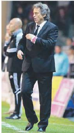
Jorge Jesus lidera o Benfica