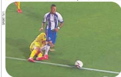
SPORT TV 1