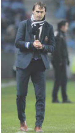
Julen Lopetegui lidera o FC Porto