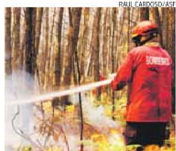
Bombeiros têm tido muito trabalho

que baixou para 25.029 em 2013, uma diferença de 3704 camas. Em sentido inverso, as camas nos privados passaram de 8429 para 10.474, no mesmo período, mais 2045. O INE dá também conta de que, em 2013, se realizaram 7,2 milhões de atendimento nos serviços de urgência, a maioria no setor público (88%). No entanto, destaca o facto de as urgências quase terem duplicado no período em análise (de 460 para 900 mil).