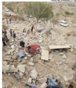
Imagem de destruição e desolação