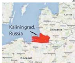
O enclave está assinalado a vermelho

→ O enclave russo está situado diante do mar Báltico entre a Polónia e a Lituânia