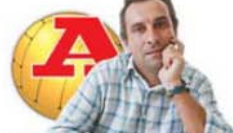
por ANTÓNIO SIMÕES