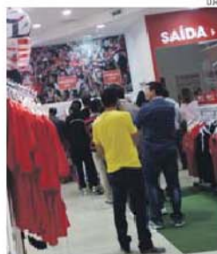
Espera pelos bilhetes, ontem na Luz

A desvantagem destes dois recursos passa, no entanto, pela pouca competição que tiveram e que se traduz em falta de ritmo.