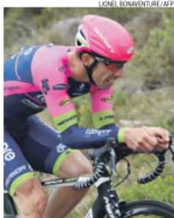
Rui Costa chegou ao mesmo tempo do 1.º

«A descida era muito rápida e queria estar com os primeiros para evitar os buracos. Não arrisquei na reta da meta porque o importante era chegar com os da frente e não correr riscos», explicou o campeão mundial de 2013.