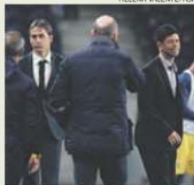
Lopetegui e um antigo 'rival'