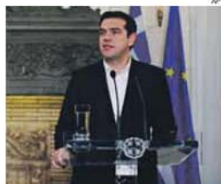
Alexis Tsipras, primeiro-ministro grego

→ Viagem é feita num período em que a Grécia negocia com credores da UE e do FMI