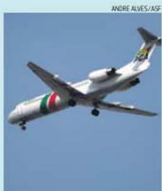
Paz social na TAP durou pouco

A FIL - Feira Internacional de Lisboa vai receber, entre os dias 10 e 12 deste mês, o Salão Motorclássico, considerado o maior evento português dedicado à história automóvel e à exposição de veículos clássicos.