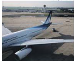
Aeroporto de Orly, em Paris, foi afetado

Mais de 60 voos de ligação entre Portugal e França, que estavam previstos para ontem, foram cancelados na sequência da greve dos controladores aéreos franceses, afetando voos das companhias Transavia France, Ryanair e TAP. Além desta paralisação, o principal sindicato dos controladores aéreos franceses anunciou, ainda, condicionamentos para hoje e para os dias 16, 17, 18 de abril, bem para o período entre 29 de abril e 2 de maio. Os trabalhadores exigem, entre outras alterações, o recuo para os 59 anos da idade do limite para a reforma.