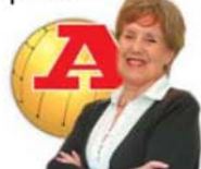
por JENNY CANDEIAS