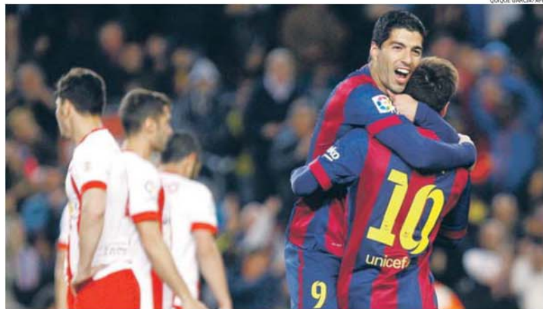
Luis Suárez e Lionel Messi marcaram três dos quatro golos do Barça ao Almería