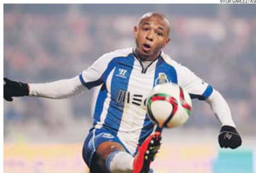
Brahimi, que leva 34 jogos e 12 golos no FC Porto, tem cláusula de rescisão de 50 milhões

De acordo com informação avançada pelo jornal Metro , os gunners estarão mesmo dispostos a bater a choruda cláusula de rescisão de 50 milhões de euros para chegarem a Brahim, contando com o total apoio de Arsène Wenger para levar a operação de compra para a frente no próximo mercado de transferências.