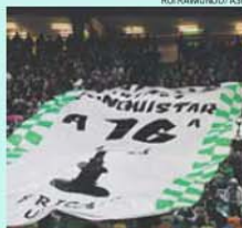
Adeptos pedem agora a 16.ª Taça

A poucos minutos início do jogo, as do Sporting exibiram tarjas com recados. «Unidos iremos conquistar a 16.ª Taça de Portugal», escreveu a Brigada Ultras. «Leão rumo ao Jamor», dizia a Torcida Verde. No topo Sul de Alvalade, a Juve Leo também expressou o desejo: «Um só querer, uma só exigência-Jamor 2015.»