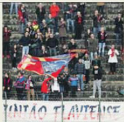
Adaptos têm sido incansáveis, elogia

— O Desportivo de Chaves é um histórico de Portugal e muitos jogadores gostariam de cá estar, pelas condições que o clube oferece aos jogadores.