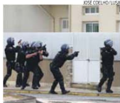
Elementos da unidade especial da PSP

Na visita à Lousã, o Presidente da República esteve acompanhado da ministra da Administração Interna, Anabela Rodrigues, e do secretário de Estado, João de Almeida. Os jornalistas que acompanharam Cavaco Silva ainda o questionaram sobre a lista VIP [ler caixa em baixo] da Autoridade Tributária, mas o Chefe de Estado escusou-se a fazer «qualquer comentário» sobre o tema.