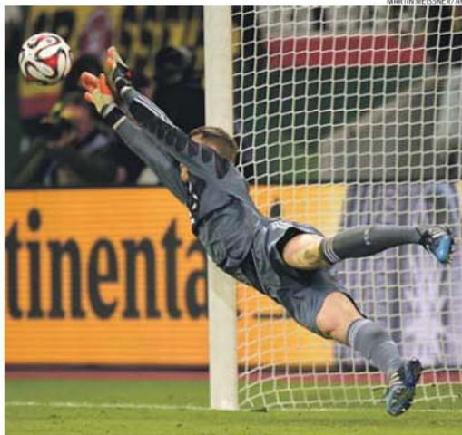
Manuel Neuer voa para defender grande penalidade apontada por Drmic no desempate final

Os atacantes da turma de Roger Schmidt obrigaram Neuer a mostrar várias vezes porque é considerado o melhor guarda-redes do