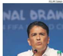
Bebeto acompanha o trajeto de Matheus

→ Antigo internacional brasileiro diz que médio sofreu falta no lance do quinto golo do FC Porto