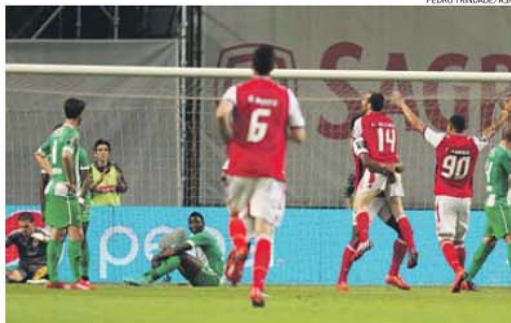
O festim bracarense frente ao Rio Ave começou com um brilhante movimento coletivo