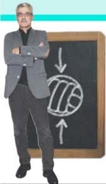
por HENRIQUE CALISTO