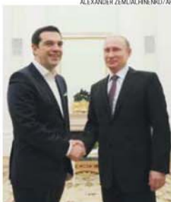
Tsipras e Putin reuniram-se no Kremlin

O primeiro-ministro grego, Alexis Tsipras, afirmou ontem, em Moscovo, que o seu governo «discorda abertamente das sanções» impostas pela União Europeia à Rússia pelo papel desta na crise ucraniana. «Não é uma solução eficiente. Para resolver esta crise profunda [na Ucrânia], é necessário abandonar o ciclo vicioso das sanções», adiantou Alexis Tsipras, em conferência de imprensa, no final de