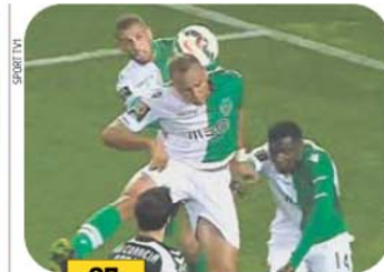
85' Ewerton é o jogador que acaba por cabecear a bola e neste momento fica a dúvida se William Carvalho tem ou não influência no lance. Aqui prevalece o critério do árbitro e aceita-se a decisão de Hugo Miguel de validar o lance.