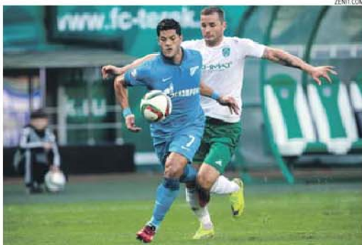
Hulk em vantagem sobre adversário do Terek Grozny

A turma de São Petersburgo reagiu de forma positiva ao gol consentido e à passagem do minuto 30 alcançou o empate. Oleg Shatov, num lance rápido, concluiu da melhor maneira um passe longo do capitão Danny. A reviravolta no marcador e tão