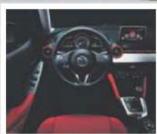
Versão 1.5 a gasolina de 90 cv é a principal aposta comercial