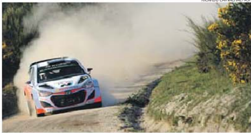
O Rali de Portugal é só em maio mas a Hyundai já prepara a prova no Minho

O rali tem «uma estrutura temporânea e compacta», com 16 classificativas, num total de 354 km,