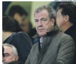
Jeremy Clarkson, ex-apresentador da BBC