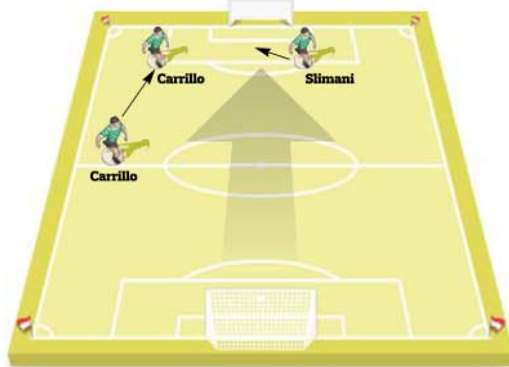
Carrillo fez muitas vezes o mesmo movimento, cruzando da zona do bico da área para Slimani, que estava na zona do segundo poste e aparecia junto à pequena área