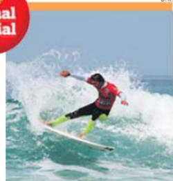
Antigo tricampeão nacional é 'wildcard'