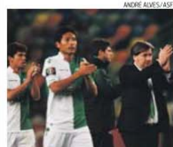
Equipa agradeceu apoio dos adeptos

→ Jogadores e treinadores agradeceram; Bruno de Carvalho foi o último a descer ao balneário