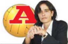
POR LEONOR PINHÃO