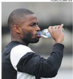
Sami procura afirmar-se no castelo

mal para um jogador que conheceu três treinadores esta temporada — começou no FC Porto e teve pas-