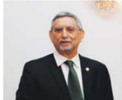
Jorge Carlos Fonseca

O novo Estatuto dos Titulares dos Cargos Políticos, aprovado a 26 de março por unanimidade no Parlamento cabo-verdiano, chegou ontem a presidência da República, tendo Jorge Carlos Fonseca 30 dias para o analisar, confirmou à Lusa fonte oficial. O presidente cabo-verdiano poderá, porém, no prazo de oito dias, remeter o diploma para o Tribunal Constitucional (TC), para uma fiscalização prévia. A atualização salarial prevista nos estatutos, que prevê um aumento salarial de 64%, gerou uma onda de contestação na população cabo-verdiana, que pede a Jorge Carlos Fonseca para vetar o diploma.