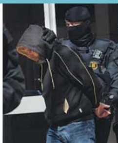
Operação decorreu na região da Catalunha

Entre os detidos — cinco cidadãos espanhóis, cinco marroquinos e um paraguaio — está um menor de 17 anos e uma mulher.