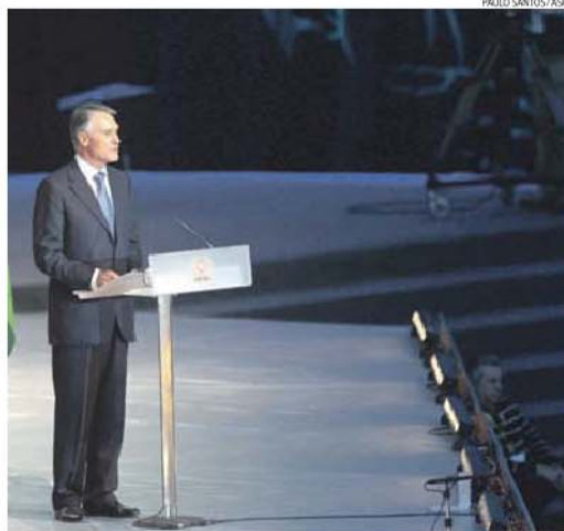
Cavaco Silva diz que antecipar eleições comprometeria quadro de normalidade democrática

De acordo com Cavaco Silva Portugal tem de se habituar à «normalidade democrática, como acontece noutros países europeus», quadro que segundo o Presidente da República ficaria comprometido se decidisse antecipar as eleições para a Assembleia da República. «Posso afirmar que seria mais negativo ter antecipado as eleições. As legislativas terão por isso lugar entre