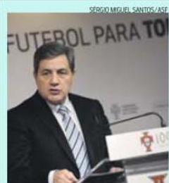
Fernando Gomes, presidente da FPF

quais resultaram três detenções e a notificação de 105 para deixarem o país no prazo de 20 dias. Sem especificar o nome dos envolvidos, Fernando Gomes revelou, em declarações à Lusa, que está a ser preparada uma regulamentação para «valorizar e proteger o atleta português», que estará concluída até 30 de junho, a fim de entrar em vigor no início da época desportiva 2015/2016.