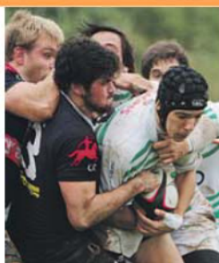
Campeão CDUL defronta Agronomia

Em Monsanto, um cenário semelhante, com o maior potencial do plantel do vice-campeão Direito mas o Técnico, com a evolução do seu coletivo — sustentada