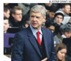
Wenger já ganhou cinco Taças de Inglaterra

→ Reading-Arsenal (hoje) e Liverpool-Aston Villa (amanhã) são os jogos das meias-finais da Taça