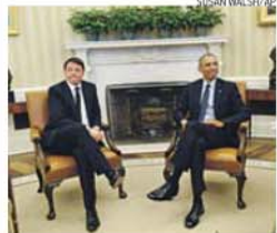
Renzi e Obama, ontem, na Casa Branca