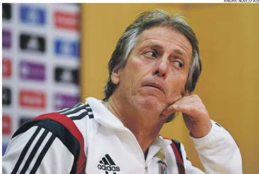
Jesus conta com o apoio dos adeptos do Benfica, hoje, no Estádio do Restelo

— Trinta e três anos... lembro-me de muita coisa, do que era o Benfica e o FC Porto, e por aí fora... mas não me peçam para fazer um resumo. A partir do jogo com o Belenenses é que quero fazer o resumo do FC Porto e depois falamos para a semana.