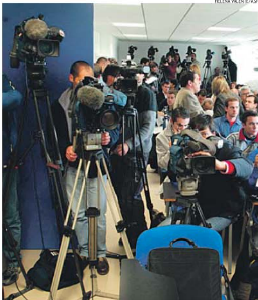
É vulgar aceitarmos as mensagens que nos impingem, de um futebolés pobre e provinciano

Estive no Casino Estoril a assistir à Noite das Mil Estrelas, última obra de La Fèria. Que é dos que faz em vez de reclamar. Que é criticado por uma (pseudo) elite, que vai da esquerda cavar aos subsidiodependentes. O que é lamentável e uma tremenda injustiça.