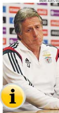
Jesus não desfez todas as dúvidas

«Durante a semana tiveram alguns problemas de fadiga muscular, não trabalharam com o grupo, mas hoje [ontem] já trabalharam metade do treino. Vão estar convocados para o