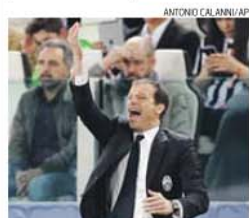
Massimiliano Allegri, técnico do Juventus

→ Vitória da 'vecchia signora' é passo de gigante; 'biancocelesti' procuram imitar feito de Eriksson