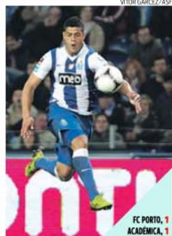
Hulk marcou de 'penalty' em 2012