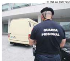
Fugiram da cadeia mas... voltaram