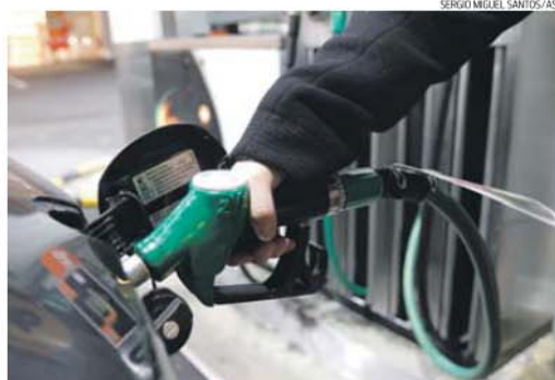
A imposição do combustível 'low cost' nas bombas de gasolina não satisfaz toda a gente

que a decisão não vai trazer os preços mais baratos que o executivo anunciou e que os consumidores poderiam esperar. O ar-