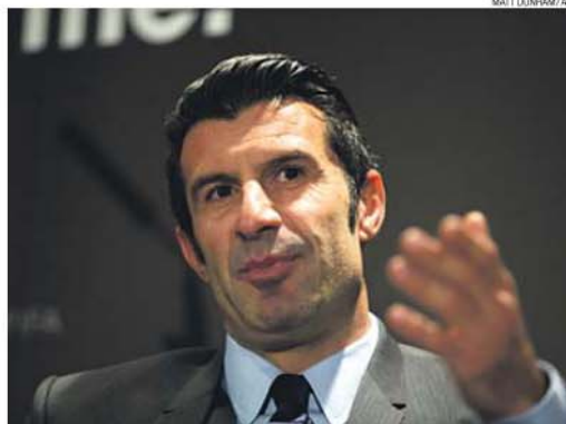
Presidente da Federação da Guiné-Bissau diz que Figo nunca se interessou por África