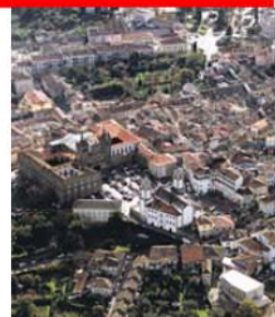
Vista aérea da zona da Sé, em Viseu

priano e Vil de Souto passou a São Cipriano e Vil de Souto, a União das Freguesias de Couto de Baixo e Couto de Cima passou a Coutos de Viseu e a União das Freguesias de Repeses e São Salvador passou a Repeses e São Salvador. Em Mondim de Basto, a Freguesia com o nome daquela vila minhota ganhou um santo padroeiro, passando a designar-se São Cristóvão de Mondim de Basto.