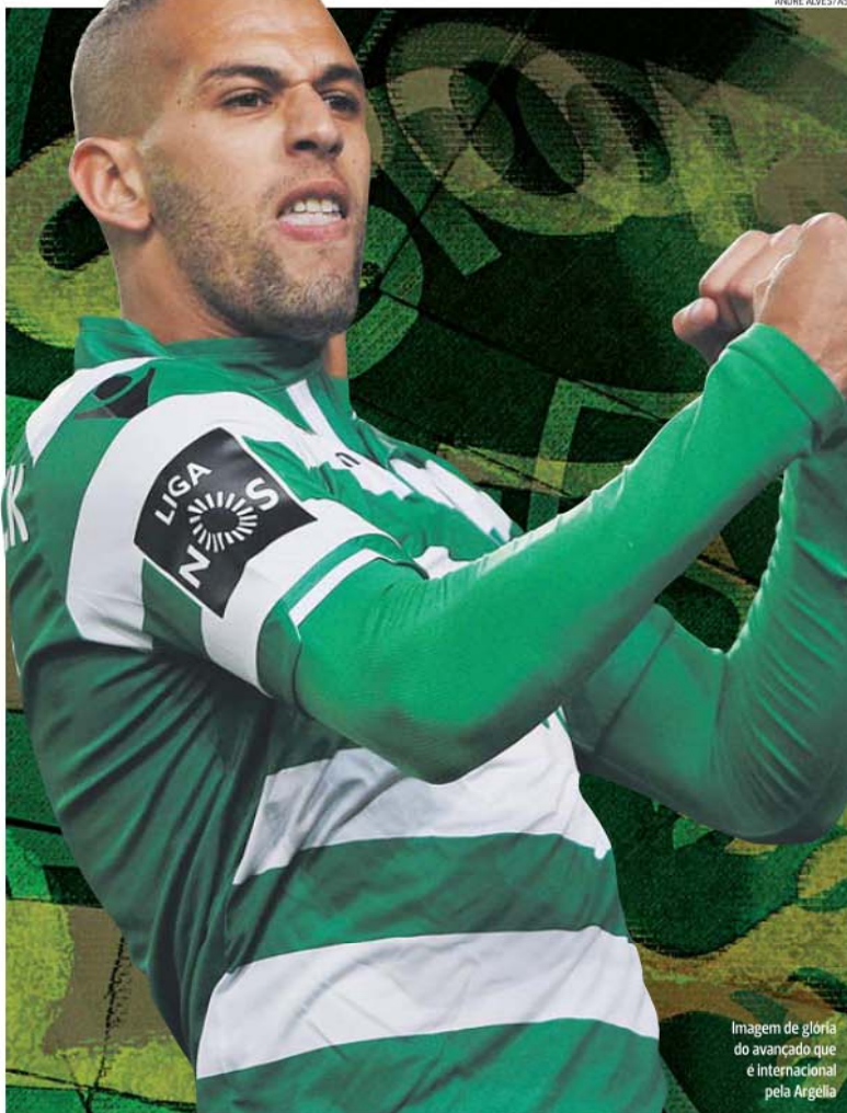
Imagem de glória do avançado que é internacional pela Argélia

O avançado argelino é o 10.º jogador mais utilizado por Marco Silva durante esta temporada. Slimani atuou em 29 jogos oficiais, durante 2003 minutos, e marcou 12 golos — é o goleador da equipa