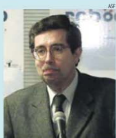
Mariano Gago, antigo governante do PS

Desde janeiro, a GNR de Montalegre deteve dois homens e identificou mais 22 por suspeitas de terem atestado fogos florestais. Durante o mesmo período, as autoridades locais registaram 194 ocorrências de incêndios florestais, a maior parte das quais no último mês.