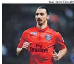
Zlatan Ibrahimovic falha Nice, Lille e Metz

→ Liga francesa aceitou parecer do Comitê Nacional Olímpico; Marselha perde em Nantes