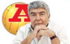
POR VÍTOR SERPA

O professor de educação física é um professor que ensina a mente a gostar do corpo, a usufruí-lo com êxtase, a discipliná-lo, a testá-lo, a usá-lo