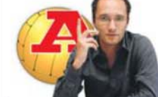
POR MIGUEL CARDOSO PEREIRA