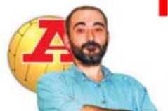
POR LUÍS AFONSO

O BAYERN PERDEU POR TRÊS COM O PORTO E O WOLFSBURGO LEVOU QUATRO DO NÁPOLES.