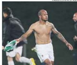
Del Valle leiloa camisola afortunada