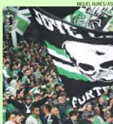
Muitos leões querem ir ao Jamor

Gamebox ; o segundo dia para os mesmos sócios mas com onze anos de Gamebox e assim sucessivamente. Nota para os interessados serem obrigados a ter quota de maio regularizada. Cada sócio poderá levar quatro cartões de Gamebox correspondente ao dia de venda e cada um permitirá comprar um bilhete. A validação do histórico Gamebox será no site do clube a partir de terça-feira.