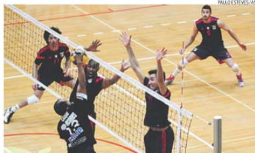
Fonte do Bastardo e Benfica reeditam o 'play-off' final masculino da época passada

Fonte do Bastardo-Benfica 19.00 h C. Desportivo Vitorino Nemesio, nos Açores