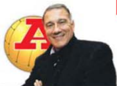
POR JOSÉ EDUARDO

Um treinador mais culto, com mais mundo, tem tendência a arriscar mais, a confiar no que antevê. Ao invés do conservador que, por norma, é inseguro perante o desconhecido