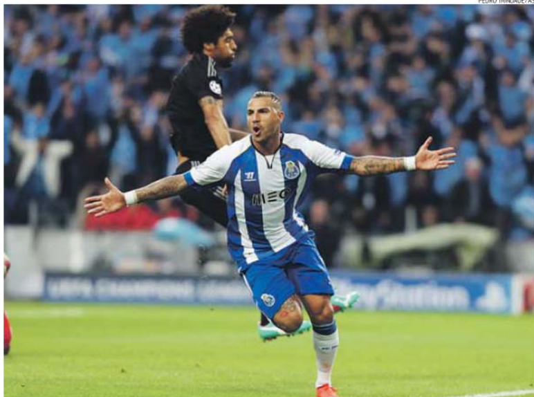
«Como se viu no Dragão, o FC Porto é equipa de Champions — e não só esta equipa em particular, mas todas ou quase todas, ano após ano»

Pois, não há outra solução para os portistas: começar a sofrer hoje à noite e só descansar domingo à noite. Depois de ganhar em ambas as frentes, é claro.