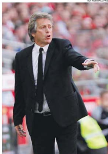
Jorge Jesus procura o terceiro título de campeão pelo Benfica

As águias têm neste momento 74 pontos, o que já é o terceiro melhor registo, chegando então aos 77 (em 90 possíveis) em caso de sucesso no clássico. Foi com esta pontuação que terminaram o Campeonato de 2012/13, em que ficaram em segundo lugar, a um ponto do FC Porto. De resto, nem em 2009/10, época de estreia de Jesus pelo Benfica e que muitos consideram ter sido a mais empolgante, se viram números assim, com os encarnados a somar 76 pontos. Em 2010/11 ficaram-se pelos 63, em 2011/12 obtiveram 69 e na época transata, em que conquistaram novamente