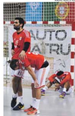
Desalento encarnado após a derrota