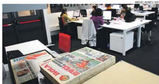
Equipa do CDI reconstrói a história, além de também produzir conteúdos atuais

«Há vários museus de clubes desportivos que já têm este departamento. Mas com condições como as do Benfica... Tentamos é manter o nosso trabalho num patamar de excelência. É um projeto muito bom a nível internacional», soltava.