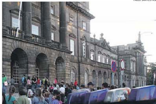
Uma enfermeira do Hospital de Santo António e outra do São João denunciaram os métodos

O presidente do Conselho de Administração do Centro Hospitalar do Porto, que integra o Hospital de Santo António, justificou a prova por terem verificado que «havia muita gente em