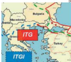
«Corrente turca» pode seguir para a Grécia

sível participação da Grécia na construção do gasoduto de gás natural russo que deve servir a re-