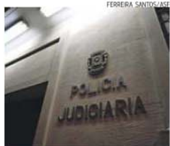
A Polícia Judiciária deteve um homem

A GNR anunciou, ontem, que detetou 5.756 condutores em excesso de velocidade, num total de 293.937 veículos controlados na semana passada. O distrito de Aveiro foi o que registou mais excessos (840), seguindo-se Leiria (739), Lisboa (568), Setúbal (533) e Coimbra (501). Vila Real teve o menor número de infrações (72). Foram realizadas 700 ações de fiscalização e estiveram nas estradas 1.300 militares dos diversos comandos territoriais.