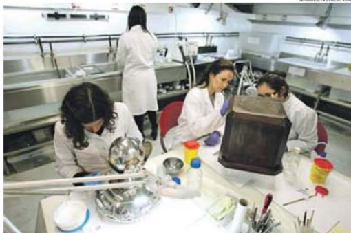
No laboratório de metais, profissionais recuperam o brilhantismo das Taças conquistadas