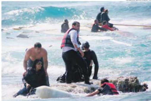
Imagem da tragédia de ontem no mar Egeu, não muito longe da costa da ilha de Rodas

intensificadas as operações Frontex no Mediterrâneo, em particular 'Triton' e 'Poseidon' , «aumentando os seus recursos financeiros e o número de operacionais» e ampliando a «área operativa», segundo explicou o comissário para a Imigração, Dimitris Avramopoulos.