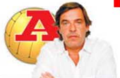
POR MIGUEL SOUSA TAVARES