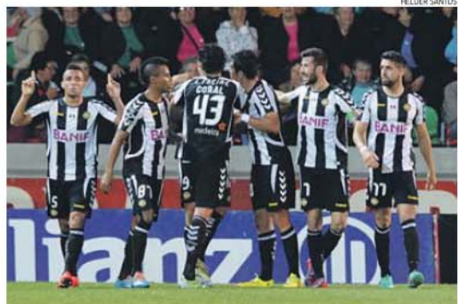
Festa dos jogadores do Nacional na altura do gol de Soares