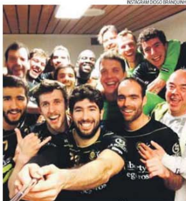
Festa minhota que conhece hoje ordem dos jogos da final

de. Da final da Taça Challenge há 10 anos lembro-me. Estava a jogar no Aguas Santas e regressava a casa de um jogo em Lisboa, quando soube o resultado», recordou.