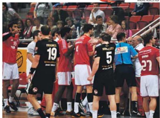
De nada valerem os protestos encarnados junto da mesa perante o erro do delegado