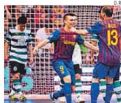
Sporting perdeu (1-5) com Barça em 2012

→ Jogadores não esquecem a pesada derrota no primeiro jogo com o Barcelona, em 2012