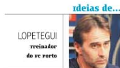
LOPETEGUI treinador do fc porto

Daniilo e Alex Sandro: «Faremos duas, três ou quatro alterações, não sei. Somos uma equipa sem grandes surpresas, somos bastante previsíveis. Quando temos a bola queremos atacar, quando não a temos procuramos recuperá-la», revelou o basco, que se recusou prometer a Pinto da Costa a final de Berlim. «Os jogos que se seguem são os mais importantes. Este, nos quartos de final, é muito exigente. As conversas com o presidente são privadas», assegurou.