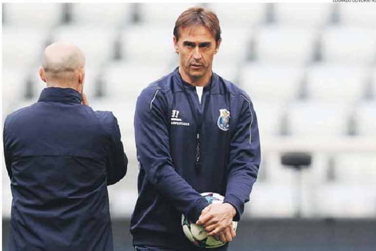
Lopetegui está ciente das adversidades que o FC Porto vai sentir hoje no Allianz Arena, mas acredita que os dragões vão seguir em frente

A curiosidade dos jornalistas não foi satisfeita em relação às mudanças a operar nas duas laterais face às ausências por castigo de