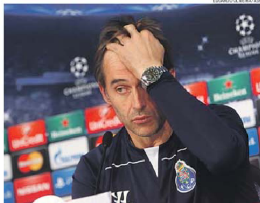
Basco ultrapassa numa época o número de jogos que Robson orientou em duas temporadas

Número interessante é também a percentagem de vitórias na maior prova europeia de clubes: Lopetegui venceu 66 por cento dos desafios que realizou, algo que nunca tinha acontecido nos dragões com qualquer treinador. O espanhol tem ainda a melhor média de golos (2,66 por jogo).