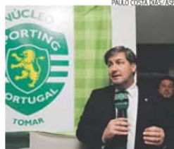
Bruno de Carvalho em mais uma visita