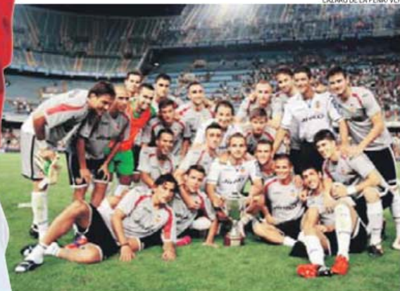
O empate final foi desfeito nas grandes penalidades. O Valência fez a festa

Jonas, de 31 anos, vai jogar pela primeira vez um clássico entre Benfica e FC Porto, mas o avançado já se cruzou com o rival do norte