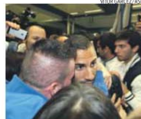
Adeptos pedem mais golos a Quaresma