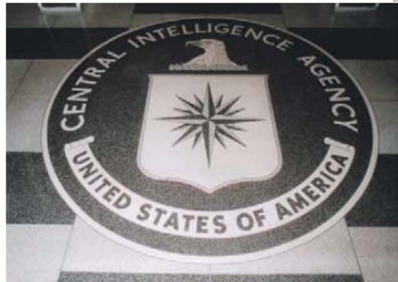
Sabe-se agora que CIA teve locais de detenção e de tortura na Roménia e na Polónia

Segundo a Der Spiegel , Iliescu falou sempre de um local e não de uma prisão, alegando que, se ela existiu, nunca teve conhecimento. «Tratou-se de um gesto de boa