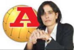
por LEONOR PINHÃO