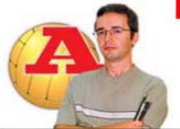
POR RICARDO GALVÃO