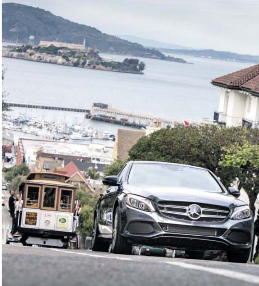
Em São Francisco (Alcatraz ao fundo, no meio da baía) conduzimos versão híbrida nova do Classe C, com tecnologia 'plug-in' de recarregamento das baterias de iões de lítio. A autonomia do modo de condução 100% elétrico é de 31 km

espaço para carga é admitido apenas no Station.