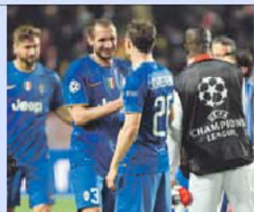
Chiellini poderá reencontrar Luis Suárez

Real Madrid, Barcelona, Bayern e Juventus, curiosamente os quatro clubes do velho continente com mais presenças na penúltima fase das competições europeias – 31 para os merengues , 30 para os blaugrana , 25 para os bávaros e apenas 22 para a vecchia signora –, conhecem amanhã o acasalamento para as meias-finais da Liga dos Campeões. Marcado para as 11 horas portuguesas, o sorteio ditará, por certo, (re)en-