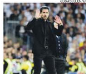
Simeone justificou substituição de Tiago

«A derrota não deixou qualquer sensação negativa. Estou orgulhoso da minha equipa por ter competido como competiu. Tenho uma equipa de homens. Há treinadores que têm inveja de eu ter estes jogadores», venceu o treinador argentino, que justificou a