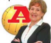
POR JENNY CANDEIAS