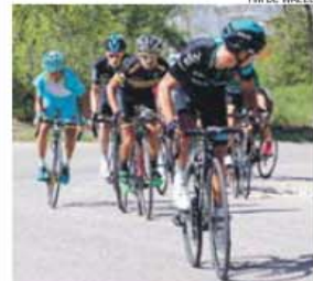
Porte esperta a concorrência na etapa