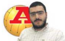
POR HUGO VASCONCELOS

“O Bayern ganhou-nos por três golos, o Barcelona ganhou por quatro golos ao PSG e o ano passado o Bayern foi eliminado pelo Real Madrid com um total de 5-0. (...) Somos a equipa mais jovem da história da Liga dos Campeões.