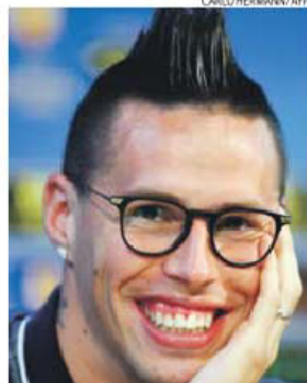
Hamsik, o exótico capitão do Nápoles

Caso se confirme esse desfecho, o sorteio de amanhã só irá servir para determinar a ordem dos jogos das meias. Contudo, Brugge (precisa de ganhar ou empatar com golos) e Fiorentina (0-0 basta) têm uma palavra a dizer e até estão bem encaminhados.