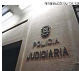
Jovem não escapou aos agentes da PJ

O Tribunal de Vila Real começa, hoje, a julgar um homem, de 43 anos, suspeito de ter matado à machadada a companheira. O crime foi cometido em julho de 2014.