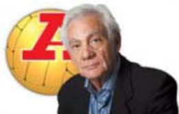
POR SANTOS NEVES