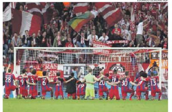
Jogadores do Bayern festejaram no relvado após a goleada ao FC Porto

Para Pep Guardiola, esta conquista, poucos dias após a goleada imposta ao FC Porto (6-1) no seu 100.º jogo ao leme da equipa e consequente passagem às meias-finais da Champions, seria a sua redenção aos olhos dos críticos, externos e internos ao clube, que colocaram em causa o futuro do catalão em Munique, caso de Steffan Effenberg, que recentemente reprovou o poder concedido ao técnico no colosso alemão. Em clima de festa, Dante, que não foi titular na terça-feira, após o fraco desempenho no jogo da 1.ª mão, fez uso da rede social Twitter para congratular os companheiros: «Estou muito feliz pela nossa qualificação para as meias-finais da Champions. Grande jogo rapaziada!».