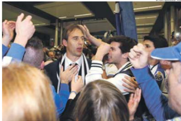
Engolido pela multidão, Lopetegui sentiu o fogo do dragão antes do jogo com o Benfica