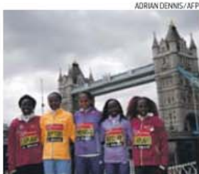
Favoritas posaram ontem já em Londres