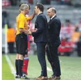
Lopetegui foi expulso na partida de Bayern

A UEFA abriu ontem um processo disciplinar a Julen Lopetegui, na sequência da sua expulsão aos 89 minutos da partida com o Bayern, por contestar decisão do árbitro Martin Atkinson. O técnico do FC Porto mostrou-se bastante nervoso face às incidências no relvado e, antes do sexto golo, apontado de livre direto por Xabi Alonso, terá questionado a falta assinalada pelo juiz que resultou na expulsão do espanhol Marcano. Como já tinha sido reincidente na partida, após um aviso do quarto árbitro, o basco foi expulso e não acabou o jogo com os bávaros no banco de suplentes do FC Porto. O Comité de Ética, Controlo e Disciplina da UEFA aprecia o caso dia 21 de maio. Nesse mesmo dia será julgado outro processo disciplinar aplicado a Pep Guardiola, que na conferência de imprensa de antevésio ao jogo ostentou uma t-shirt em que pedia justiça para o jornalista argentino que morreu no Mundial do Brasil, após o seu carro ter sido abalroado. O técnico do Bayern responde por conduta antidesportiva.