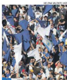
Adeptos não poupam no apoio à equipa