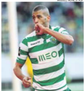
Slimani marcou ao Boavista

William Carvalho e Islam Slimani são os dois jogadores cuja condição física mais cuidadosos tem inspirado ao departamento médico e à equipa técnica, tendo em conta que os dois jogadores acusam o desgaste de uma época que já vai longa e, no caso do argelino, a lesão muscular contraída no CAN ao serviço da Argélia deixou marcas em termos de índices físicos.