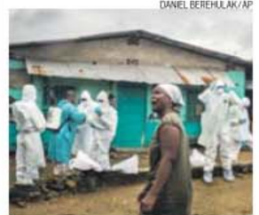
Brigada de combate ao ebola no terreno

Segundo o procurador de Paris, François Molins, o jovem detido, no domingo, por suspeita de estar atos terroristas contra igrejas, tinha em poder dele documentos em árabe relacionados com o Estado Islâmico (EI). O suspeito é franco-argelino, tem 24 anos, e foi detido, no quadro de uma ação de assistência médica, porque apresentava uma ferida de bala numa perna e estar a perder muito sangue.