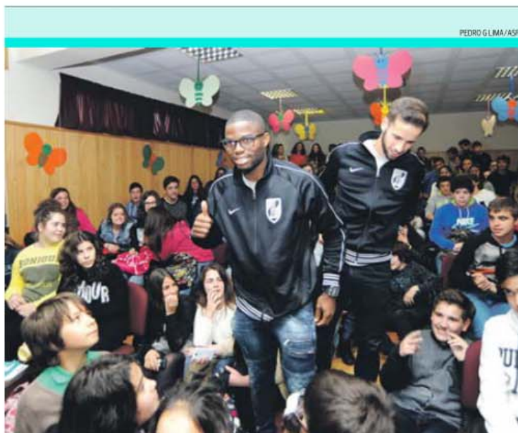
PEDRO G. LIMA/ASF