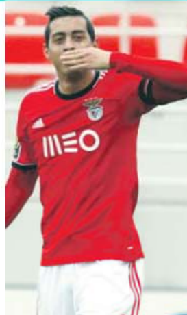
Funes Mori está emprestado pelas águias

No início desta temporada, foi informado por Jesus de que não iria ter muitas oportunidades, preferindo, por isso, mudar-se para o Eskisehirspor. «Jogo sempre e sinto-me útil. Reconhecem o que estou a fazer», afirmou numa entrevista a A BOLA, no final de 2014, depois de convidado a falar da experiência na Turquia. No Eskisehirspor, 13.º classificado, soma 27 jogos (24 a titular) e cinco golos.