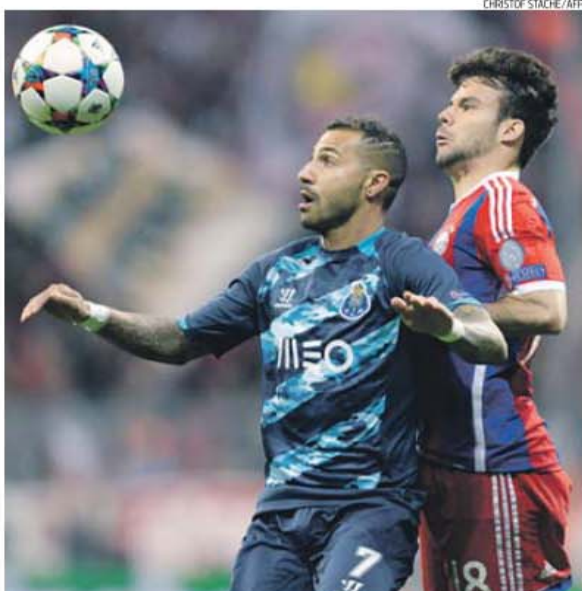
Quaresma já esqueceu a humilhação em Munique e concentra já energias no Benfica

A primeira parte arrasadora do Bayern não pode perturbar os dra-