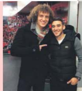
David Luiz e outro jogador. O brasileiro comemorou o aniversário de 28 anos

→ PARABÉNS, DAVID. Julio César e Salvio utilizaram o Instagram para tornar públicos os votos de felicidade a David Luiz, que ontem completou 28 anos. «Meu amigo irmão que papai do céu me deu, cabeça de couve-flor, feliz aniversário. Muita saúde, sintá-se abraçado como na foto», escreveu o guarda-redes. «Feliz aniversário. Muita felicidade. Que passes um grande dia», expressou o argentino