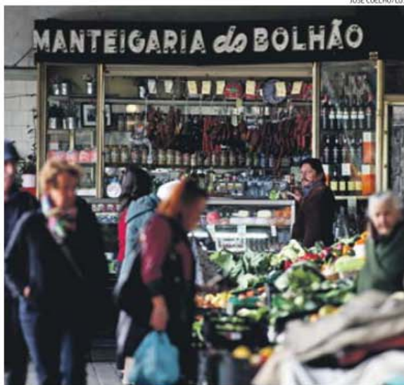
Os comerciantes do mercado do Bolhão aguardam impacientemente pela requalificação anunciada por Rui Moreira (em cima à esquerda)

«Incluindo a construção do mercado que transitoriamente acolherá os atuais comerciantes e todo o conjunto da despesa. É um investimento pesado, mas sustentável para as boas contas do Por-