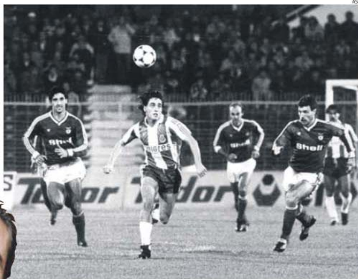
Na Supertaça de 1985/86, Paulo Futre 'ganhou' 4-2 na Luz: mesmo perseguido, dois golos e um jogo de sonho