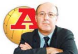
POR FERNANDO SEARÁ