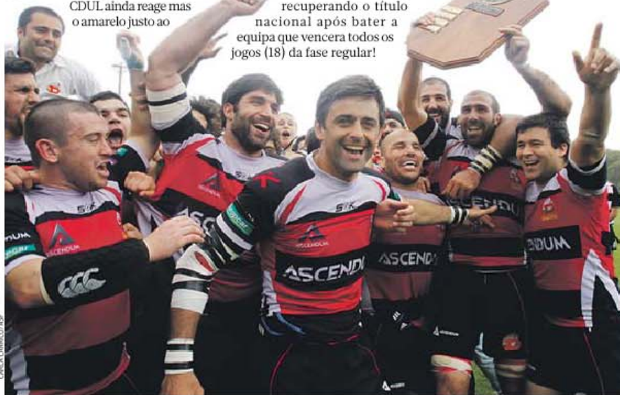
Direito recuperou o título de campeão português de rugebi, ao bater o CDUL na final disputada no CAR do Jamor