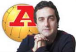
por ROGÉRIO AZEVEDO

O bailado de Iniesta foi infame. Devia ter rodado os indicadores um sobre o outro e pedido para ser substituído ao minuto 14 do Barcelona-PSG