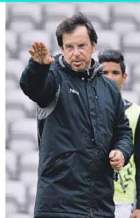
Machado vai completar 6.ª época no clube