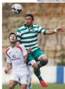
Postiga ganha a bola nas alturas