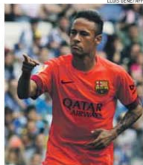
Neymar abriu o marcador a passe de Alba