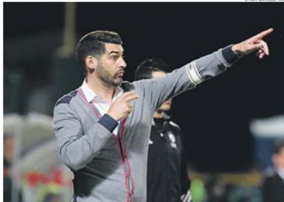
Paulo Fonseca deseja que os seus jogadores realizem uma boa exibição em Arouca

«Depois da vitória em Penafiel, o Arouca está mais sereno na classificação, mas, independentemente do seu valor, tenho a certeza de que, se repetirmos a exibição do último jogo em casa, dificilmente tiraremos alguma coisa da partida», considerou, delineando, sem pejo, a tática o treinador dos castores.