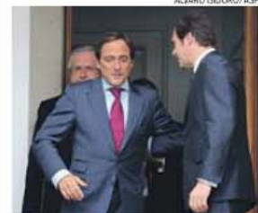
Paulo Portas com Pedro Passos Coelho

Os líderes de PSD e CDS-PP, Passos Coelho e Paulo Portas anunciaram que irão concorrer ligados às Legislativas de 2015, em setembro ou outubro. «Esta aliança está a recuperar o país. Nunca em Portugal existiu coligação que trouxesse tanta estabilidade e confiança ao País», afirmou Passos Coelho. «Defenderemos nos nossos partidos que o interesse de Portugal é realizar uma aliança», disse Paulo Portas.