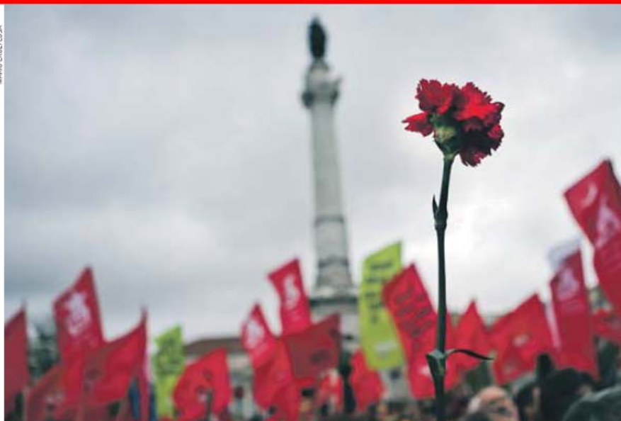
Na Avenida da Liberdade, em Lisboa, estiveram milhares de pessoas, mas a Revolução dos Cravos levou muitos mais para a rua nos quatro cantos de Portugal