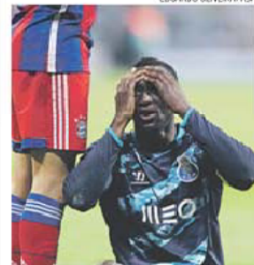
Até Jackson caiu aos pés dos alemães

→ A eliminação da Liga dos Campeões nos quartos de final, frente ao Bayern, teria sempre explicações. Mas sair de prova com um 6-1 em Munique desanima muito