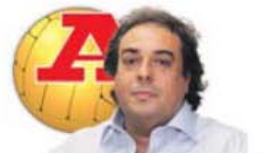
por PAULO MONTES