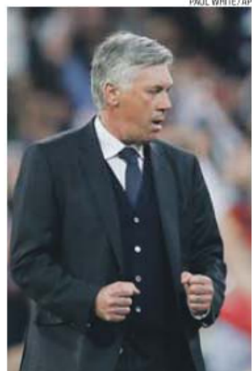
Carlo Ancelotti, 55 anos, técnico do Real

Superado o teste Zenit, segue-se a Fiorentina rumo à revalidação do título. «É um adversário difícil que irá criar dificuldades, mas na Europa existe respeito pelo Sevilla. No ano passado fomos campeões e já estamos a um passo de ir à final. O objetivo é participar na próxima Champions, que