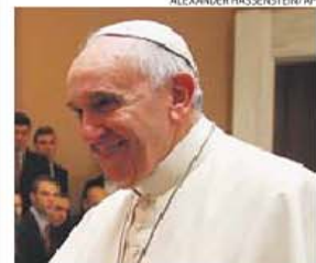
Papa Francisco confirmou visita