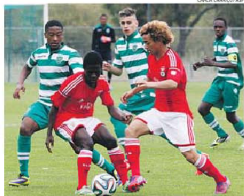
Sporting e Benfica protagonizaram um duelo intenso em Alcochete

Os leões não perderam tempo. Sem receio, de peito aberto, foram para cima