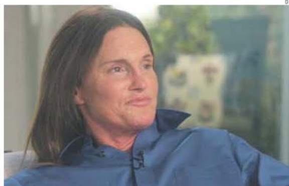
Após meses de rumores, Bruce Jenner deu entrevista de duas horas a um canal de TV

Bruce Jenner, ouro olímpico em Montreal-76, assume mudança de sexo. Família orgulhosa