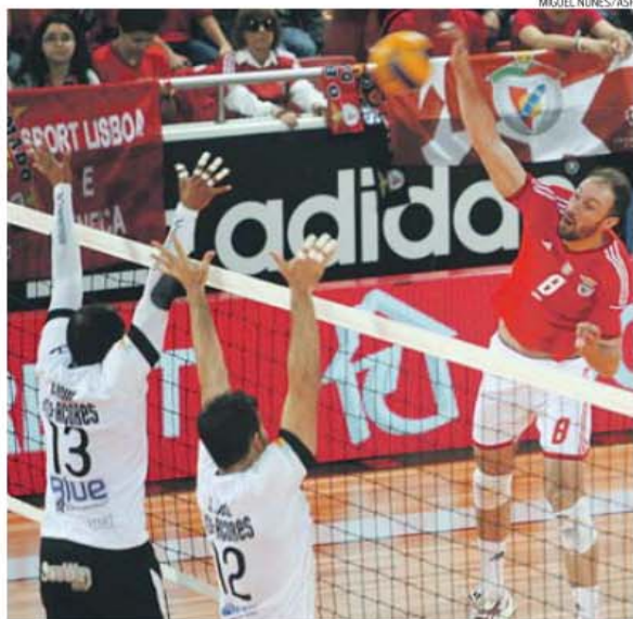
Águias reagiram bem à derrota sofrida no primeiro embate realizado na Ilha Terceira

ÁRBITROS Vitor Gonçalves e Luis Meireles