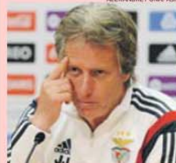
Jorge Jesus espera jogo complicado