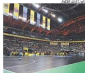
MEO Arena recebe hoje dois últimos jogos

«É isso, estar na final já diz tudo. Temos os nossos trunfos e queremos