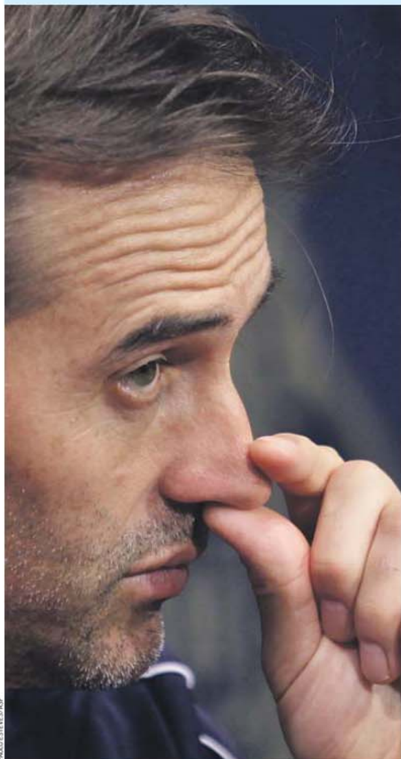
Julen Lopetegui diz que os jogadores estão focados naquilo que vão fazer em campo