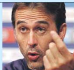
Desastre em Munique já é passado

O capítulo Champions está encerrado, mas Lopetegui fez uma pequena viagem pelos quartos de final. Não pelos jogos com o Bayern, mas pela capacidade mobilizadora dos adeptos, tanto no Allianz Arena, quer na receção calorosa à equipa a seguir ao descalabro: «Se quisermos falar da Champions é para dar uma palavra de agradecimento aos adeptos e à capacidade que a equipa teve de criar esperança a quem foi a Munique, gastou o seu dinheiro e se esforçou para nos acompanhar.» O afeto bateu fundo e o espanhol quer corresponder: «Temos coração e vamos focar-nos para retribuir o esforço dessas pessoas.»