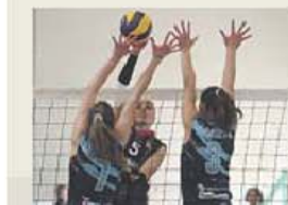
» 20.27 – Transmissão Direta, Voleibol: Leixões Sc – Porto Volei