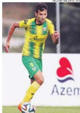
Piolo reencontra primeira equipa em Portugal

Quim Machado tem todo o plantel disponível, sem lesionados, nem castigados, mas sendo esta mais uma final rumo ao objetivo de subida, as portas do estádio serão franqueadas aos adeptos, que podem assistir à partida gratuitamente. O desafio com os algarvios surge num ciclo de cinco vitórias consecutivas do Tonde-