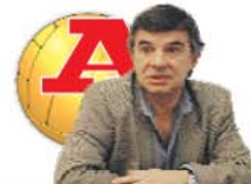
POR JOSÉ MANUEL MEIRIM