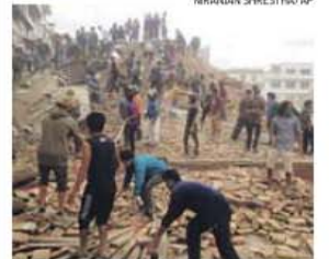
Resposta à destruição em Katmandu