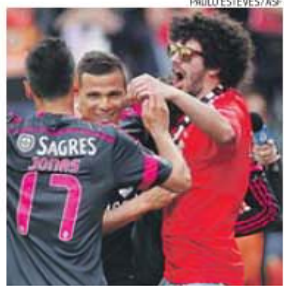
Adepto pagou 300 euros pela 'brincadeira'

O golo de Luisão, o terceiro do jogo em Barcelos, foi comemorado em campo por um adepto que conseguiu escapar aos stewards abraçando os jogadores no relvado. O adepto, natural de Peso da Régua, foi presente a tribunal na última segunda-feira tendo-lhe sido aplicada a coima de 300 euros, no âmbito dos regulamentos que prevêem multas e ações legais para qualquer adepto que invada o terreno de jogo. O adepto, já apelidado de Fellaini nas redes sociais, corria ainda o risco de ficar proi-