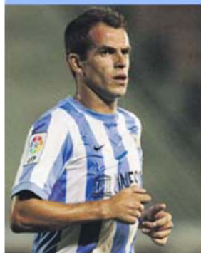
Duda completa 35 anos a 27 de junho