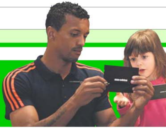
SÉRGIO MIGUEL SANTOS/ASF