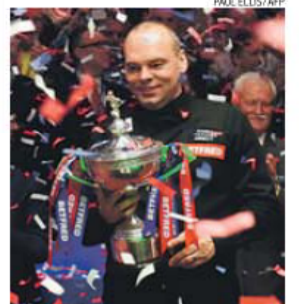
'Ball-run' com a Taça (uma de quatro) ganha