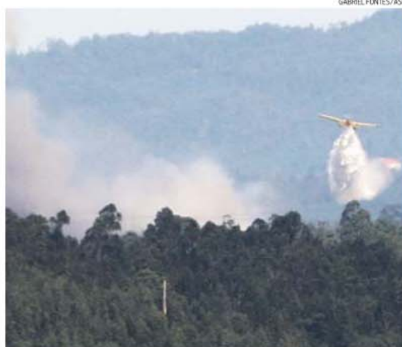
Estudo da UTAD mostra que a frequência de incêndios é mais grave que noutros países

O estudo da UTAD mostrou também que, em termos de área ardida, as chamas consumiram