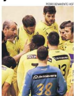
ABC persegue feito histórico

Tal como em 1994, quando jogou a final da Liga dos Campeões, o ABC começará a eliminatória decisiva em casa, o mesmo que já sucedeu ao Sporting da Horta e ao Benfica na Challenge, em 2006 e 2011, respetivamente.