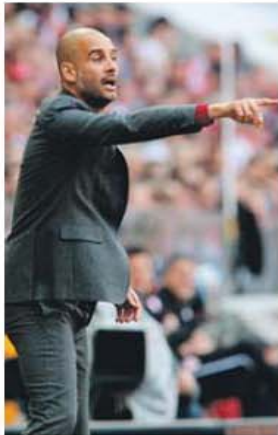
O criador, Guardiola, vai defrontar a criatura, o Barcelona, agora comandado por Luis Enrique