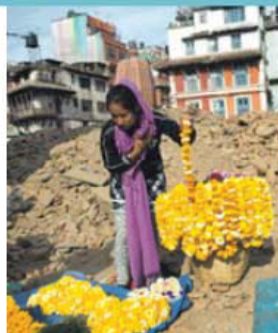
Vender flores, um modo de refazer a vida