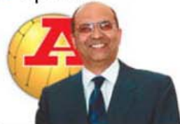
POR CARLOS CARDOSO