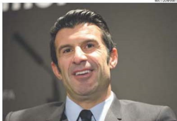
Luís Figo apela às federações para que não tenham medo da mudança

«Sinto que estou a fazer um trabalho que tinha de ser feito a bem do futebol. As minhas propostas têm sido bem acolhidas e as reuniões que tenho tido por todo o Mundo reforçam a minha convicção de que as pessoas desejam uma