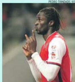
Éder pode rumar à Premier League