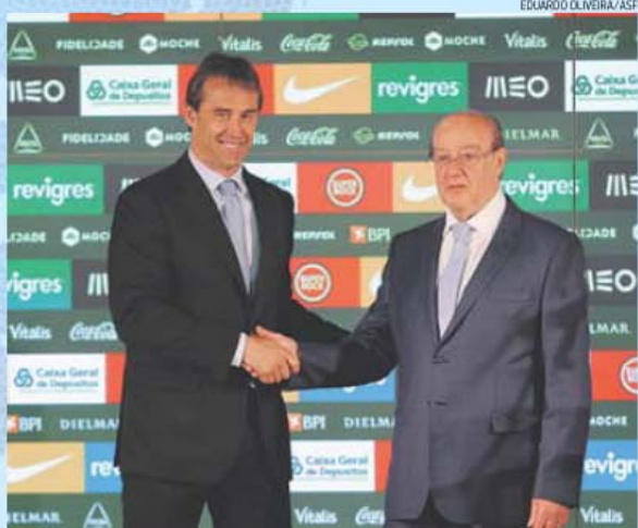
Lopetegui foi apresentado com toda a pompa e circunstância pela cúpula da SAD portista

→ Foi com natural ambição que Julen Lopetegui chegou ao Dragão. «É melhor perder de vez quando do que ganhar de vez quando. Este clube está acostumado a ganhar e vamos tratar de fazer tudo para voltar a ganhar», deu-se a conhecer o técnico basco, entusiasmado com o projeto de três anos que lhe foi apresentado por Pinto da Costa. «É um prazer, uma honra, uma grande responsabilidade e um desafio enorme ser parte da história do clube», acrescentou. A criar enorme expectativas, Julen Lopetegui celebrou uma frase que repete em algumas situações ao longo da temporada. «Queremos ser protagonistas em todas as competições. Seleção e clubes são matrizes diferentes», avaliou.