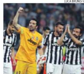
Buffon e Pirlo festejam triunfo da Juventus