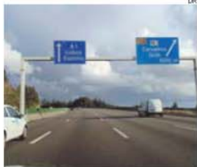
Assaltantes atuaram no nó dos Carvalhos