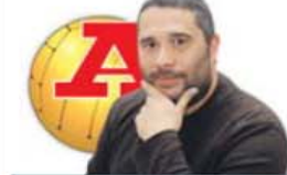
POR NUNO PERESTRELO