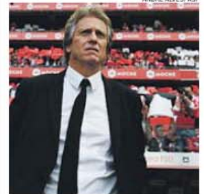
Jorge Jesus está em final de contrato

Processo negocial só deverá arrancar depois de ultrapassada esta fase decisiva da temporada