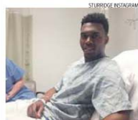
Sturridge, 25 anos, avançado do Liverpool

A final da Taça da Grécia, inicialmente marcada para o próximo dia 17, entre o Olympiakos, treinado por Vitor Pereira, e o Xanthi, vai ser adiada para dia 23, para não coincidir com a final a quatro da Euroliga de basquetebol, na qual participa o Olympiakos, de 15 a 17.