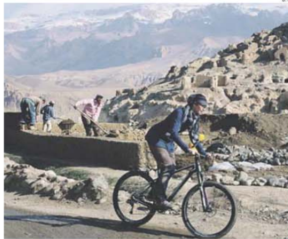
Mulher de bicicleta no Afeganistão é obscenidade. Quem faça ciclismo treina a esconder-se