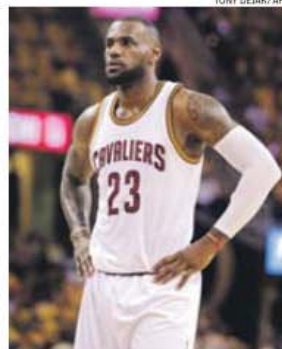
LeBron perde agora para ganhar a série?

Diz o ditado que quem ri por último, ri melhor e este é o espírito que LeBron James estará a interiorizar ante os Bulls. A tradição diz que sempre que LeBron (19 pontos, 15 ressaltos) perde a primeira partida contra a formação de Illinois (2011 e 2013), acaba a vencer a série por 4-1! Ora, a primeira premissa confirmou-se pela terceira vez e king James viu os Bulls, liderados por Derrick Rose (25pts), ganharem em Cleveland (99-92), com uma particularidade: pela primeira vez, uma equipa de LeBron nunca esteve à frente do marcador no play-off! Liderados por Rose e com as contribuições de Jimmy Butler (20pts) e Pau Gasol (21pts, 10res.), os Bulls entraram a ganhar no fim do período inicial,