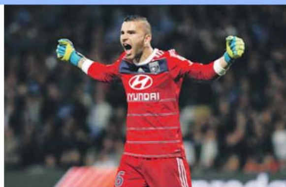
Anthony Lopes, 24 anos, guarda-redes do Lyon, já foi uma vez internacional por Portugal

Para o onze do ano, há mais opções portuguesas, além de Anthony Lopes. Assim, Bernardo Silva, João Moutinho (ambos do Mónaco) e Raphael Guerreiro (Lorient) podem ser escolhidos para o onze do ano da Liga 1.