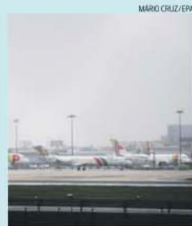
Greve tem mantido em terra muitos aviões

está garantida e circulam rumores de ele poderão decidir um novo período de paralisação, no caso de as suas reivindicações não forem atendidas. No entender de Jorge Miranda, tratando-se, como ele próprio sustenta, de uma greve «injusta», o governo deveria optar por travar os prejuízos económicos e sociais que a greve está a originar e avançar para nova requisição civil.