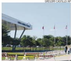
'Curtis Culwell Center', local da exposição

→ Diz que foi levado a cabo porque a exposição mostra «imagens negativas» de Maomé