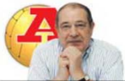
POR EDUARDO BARROSO

A tão apregoada superioridade dos plantéis de Porto e Benfica em relação ao do meu Sporting é e foi um exagero anunciado