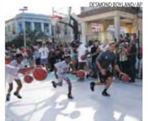
Havana vai estar ainda mais perto dos EUA

A Guarda Costeira turca resgatou nos últimos cinco dias mais de 600 refugiados que tentavam atravessar o mar Egeu em embarcações pneumáticas. Segundo informação do governador de Izmir, a maioria dos resgatados são refugiados sírios (mais de 400), entre os quais havia mulheres e crianças, mas também imigrantes ilegais do Afeganistão, da Birmânia e de países africanos.