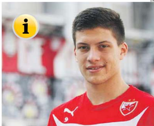
Os dragões encabeçam uma longa lista de clubes interessados no goleador Luka Jovic

Drulovic, que é o novo selecionador da Macedónia, onde terá como braço direito o português Luís Diogo, acrescenta que Luka