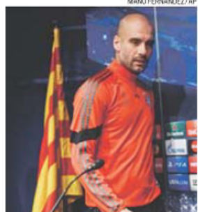
Pep Guardiola regressa a Camp Nou

«Estamos nas meias-finais com uma equipa forte como o Bayern. Não gostámos da forma como perdemos contra eles da última vez, mas as equipas estão diferentes e este jogo também vai ser diferente», concluiu.