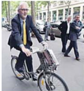
Brian Cookson fez marcha-átrás na reforma

→ Brian Cookson optou pelo adiamento, face à discórdia de equipas e organizadores de provas