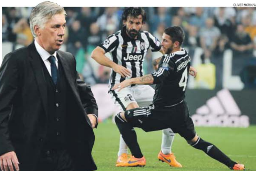
Sergio Ramos, defesa improvisado a médio por Carlo Ancelotti, em duelo com Pirlo

«Podíamos ter feito um jogo melhor. Tentámos ter o controlo, mas também tivemos azar. Falhámos o segundo golo e sofremos o 2-1. Não ficámos satisfeitos, mas com a confiança de que podemos dar a volta. Perdemos um pouco de paciência. Não começámos bem e isso custou-nos um golo», disse o italiano, salientando a falta de «precisão nos passes». «Deixámos espaços entre linhas, faltou-nos precisão nos passes mas Sergio Ramos não foi o único culpado.» Apesar da desvantagem, Carletto deu a receita para a segunda mão no Santiago Bernabéu: «A partida foi clara. Se jogarmos bem nesses momentos, se perdermos a bola sofremos contra-ataques perigosos. O resultado não é bom mas não é assim tão mau.»