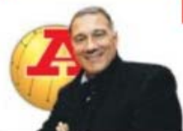
PAR JOSÉ EDUARDO

Compete aos sócios, nunca aos funcionários, por mais categorizados que sejam, dar opinião. O projeto do SCP tem de estar sempre acima