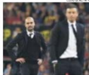
Guardiola perdeu para Luis Enrique

→ Treinador do Bayern diz que é possível inverter resultado de Barcelona; defende Gotze