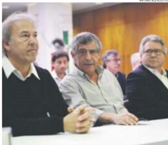
«O critério para a seleção de um jogador não pode ser a idade, sim a qualidade»

Haverá ou não, num futuro próximo, algo parecido com renovação? O selecionador nacional nada garante porque nada há ara garantir: «Por vezes falam em renovação,