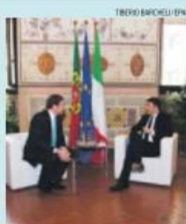
Passos Coelho ao lado de Matteo Renzi

Um homem morreu debaixo do próprio trator que manobrava num terreno agrícola em Vilar Maior, concelho de S. Pedro do Sul. A vítima, que esteve desaparecida durante algum tempo, foi encontrada já sem vida.