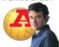
por JOÃO ALMEIDA MOREIRA