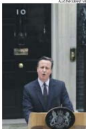
David Cameron, o vencedor das eleições

«Uma grande noite para o Partido Conservador», comentou, entusiasmado à medida que ia tomando conhecimento da contagem dos votos. E agora pro-