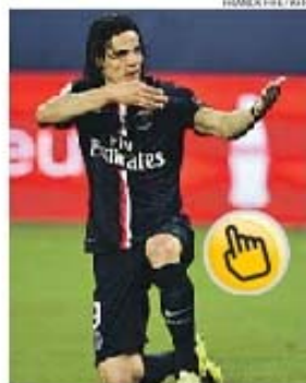
Cavani, 28 anos, celebra primeiro hat trick

O cliché produziu efeitos. Os media galeses deram muito eco às declarações do ex-leão e fizeram questão de confrontar o treinador do Marselha, Marcelo Bielsa, sobre um alegado protecionismo aos treinadores locais. «Quando os estrangeiros triunfam, são reconhecidos. Eu não merecia estar nos nomeados», disse o argentino, que recebe, amanhã, os mongescos, estando obrigado a vencer se quiser chegar ao terceiro lugar (aceso ao play-off da Champions). Um confronto de estilos, assume: «Há muitas diferenças. Leonardo Jardim fez do Mónaco uma equipa especializada em defender e conseguiu obter resultados.»