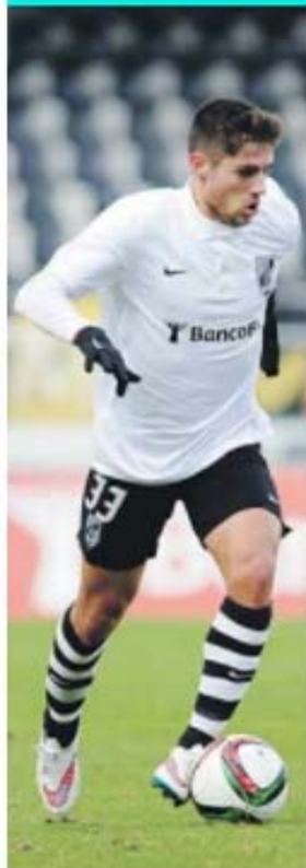
Vigário atravessa bom momento de forma