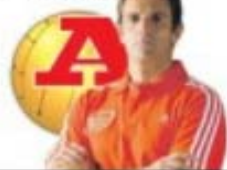
por TOMAZ MORAIS