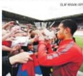
Depay é muito popular na Holanda

Van Gaal explicou, ontem, a contratação de do extremo Memphis Depay (PSV Eindhoven), de 21 anos e melhor marcador da Liga holandesa, com 21 golos. «Quando contratamos um jogador estamos a perturbar a concentração do atual grupo de trabalho, mas tivemos de fechar o negócio num dia, caso contrário, ele teria assinado pelo PSG», destacou o técnico do Manchester United, que treinou Depay na Holanda no Mundial-2014. «Não quero falar com os jogadores antes do final da época, mas, por causa da relação próxima que tenho com o PSV, consegui resolver a situação», concluiu o treinador holandês. A contratação só será oficializada após Depay ser submetido a exames médicos.