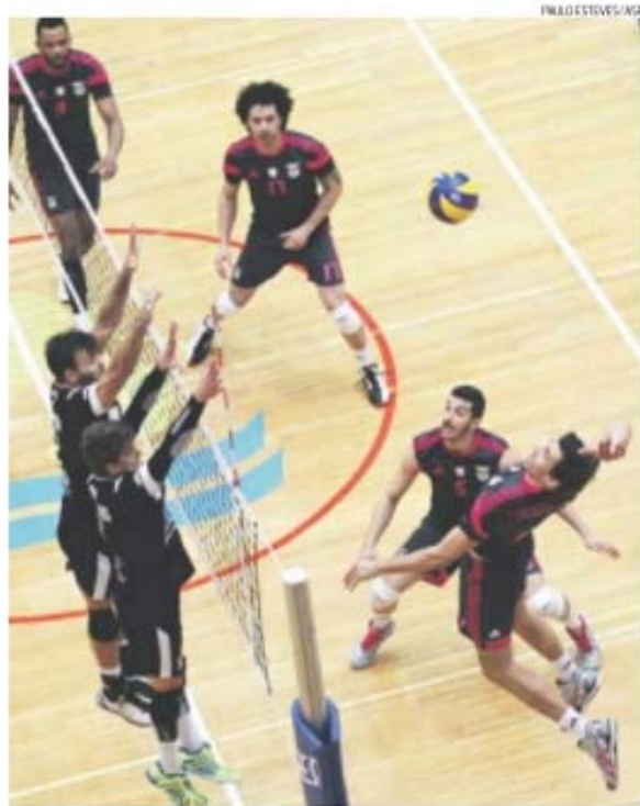
Quinto jogo da final do 'play-off' é também o 10.º duelo entre ambos da temporada

Cenário montado, jogadores e treinadores a postos e o Complexo Desportivo Vitorino Nemésio — uma fortaleza à prova de invasores a nível nacional — será pequeno para esta finalíssima. Basta constatar que, contabilizando as partidas do Campeonato Nacional e da Taça de Portugal, a Fonte do Bastardo fez o pleno em casa até agora: 16 jogos, 16 vitórias e apenas quatro sets consentidos, alin-