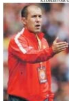
Mónaco de Jardim foi sancionado

Se o Sporting foi alvo de pena suspensa, o mesmo não podem dizer Inter, Roma e Mónaco. Os nerazzurri, por exemplo, levaram a punição mais pesada, tendo sido condenados a pagar no imediato multa de seis milhões de euros, que pode ascender aos 20 se não forem atingidos os objetivos acordados até 2017 — que passam por