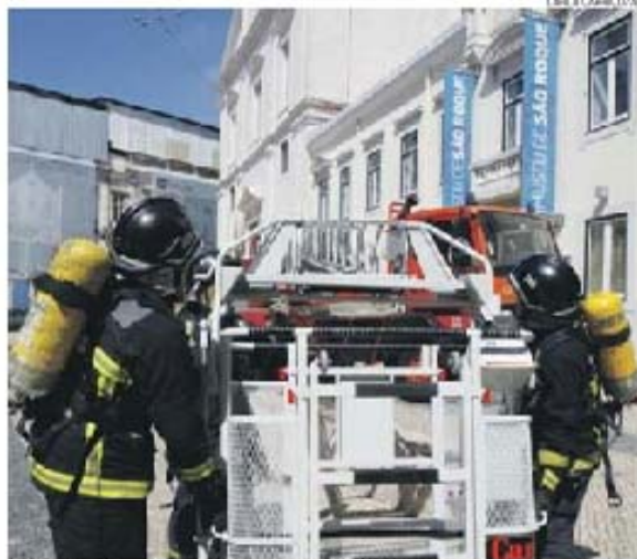
Os sapadores-bombeiros foram uma das principais forças intervenientes nos exercícios

O simulacro estava inserido no Plano de Segurança do complexo e contou com a cooperação dos seus 800 funcionários. Estiveram envolvidas, ainda, entidades como o Regimento de Sapadores de Lisboa, a Autoridade Nacional de Proteção Civil, a Polícia de Segurança Pública e a Polícia Municipal.