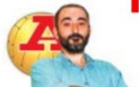
por LUÍS AFONSO

BRUNO DE CARVALHO DIZ QUE O SEGUNDO LUGAR É O PRIMEIRO DOS ÚLTIMOS.