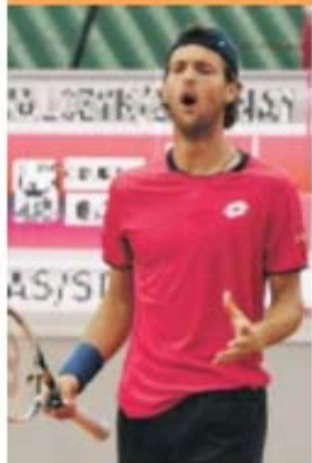
Vimaranense pode ainda defrontar Nadal