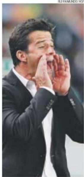
Marco Silva fica ou não no Sporting?

Jesus é um treinador de top. Tem ideias muito próprias. E, mais do que isso, as suas equipas definem um estilo de jogo, rápido, envolvente, vertical, longe do tiki e taka