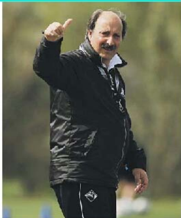
Jogadores lançaram o repto e Viterbo disse 'OK': manutenção vai custar-lhe o bigode...

Por falar em caminhadas, ainda fresca na memória a de Sérgio Conceição, que fez a pé o percurso entre Vila do Conde e Braga, recentemente, após garantir a presença na final da Taça de Portugal.