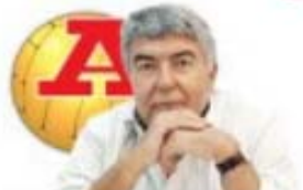
por VÍTOR SERPA

De um lado está, pois, a Federação e os futebolistas profissionais (que já anunciaram também uma greve para o fim de semana de 16 e 17 de maio) e do outro está o governo espanhol e a Liga de clubes, liderada por Javier Tebas.