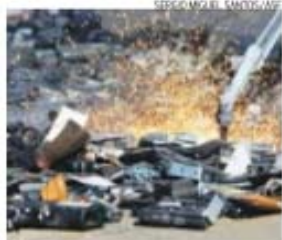
Abatidas nesta ação 4300 armas

Além disso, Hélder Santinhos destacou que os custos da paralisação — que se estende até dia 10 (domingo) — estão na ordem dos 30 milhões de euros, pelo que, no seu entender, «não pode ser desvalorizada pelo Governo».