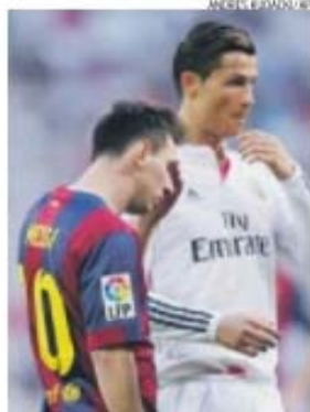
Futebol espanhol pode parar

O acesso litígio no futebol espanhol deve ser visto em Portugal numa perspectiva de particular importância. Estamos, por cá, no limiar das grandes e estruturantes transformações do futebol português. Também em Portugal, muito em breve, se discutirá a distribuição dos benefícios financeiros da nova lei que aprovou as apostas desportivas on-line. E também