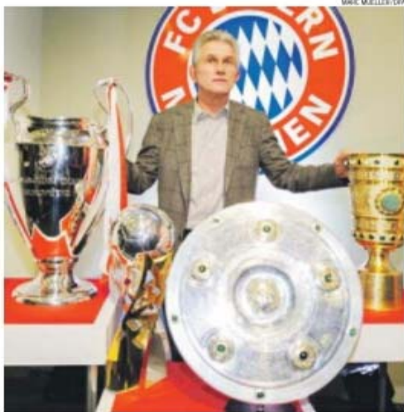
Heynckes despediu-se assim em 2013 no Bayern: Supertaça, Taça, Bundesliga e Champions

Jupp Heynckes celebra hoje aniversário especial • A história da alcunha na viagem a uma carreira brilhante como jogador e treinador