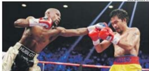
Mayweather arrecadou 180 milhões de euros em resultado do combate