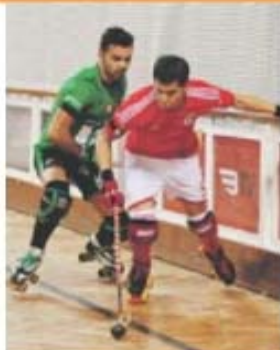
Benfica ganhou na I Volta, por 10-0