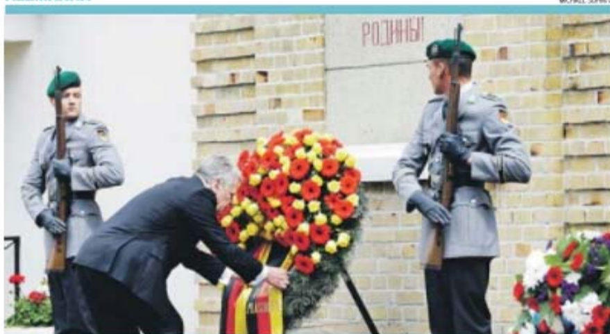
→ 'IN MEMORIAM'. Setenta anos depois da vitória sobre nazismo, o presidente alemão, Joachim Gauck, curva-se em memória das vítimas do maior conflito bélico que flagelou a humanidade durante seis anos, a II Guerra Mundial. Foi numa cerimónia oficial, no cemitério russo de Lebus, na Alemanha, perto da fronteira com a Polónia, onde o conflito começou no dia 1 de setembro de 1939