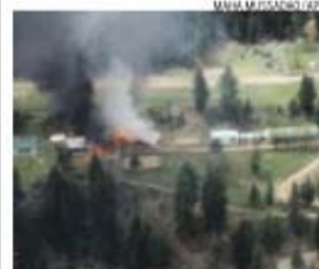
Talibãs reivindicaram abate do helicóptero

A Infanta Cristina de Espanha, implicada num caso de corrupção, solicitou a redução da fiança, situada em 2,7 milhões de euros.