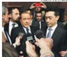
Berlusconi e o tailandês Bee Taechaubol

→ Magnatas tailandês e chinês estão na corrida pela aquisição do clube a Silvio Berlusconi