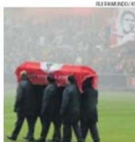
Eusébio morreu a 5 de janeiro de 2014

O Presidente da República, Aníbal Cavaco Silva, vai discursar na cerimónia de trasladação de Eusébio. Também a presidente da Assembleia da República (AR), Assunção Esteves, e o antigo jogador de Benfica e da Seleção Nacional, António Simões, vão usar da palavra no Panteão Nacional, a partir das 19 horas, no dia 3 de julho.