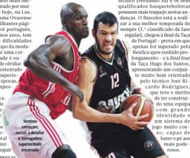
Vareiros começam, na Luz, a desafiar a esmagadora superioridade encarnada