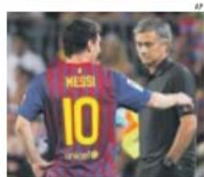
Mourinho passou horas a estudar Messi

➔ «É o adversário mais perigoso que defrontei»; terra tremeu nos golos do argentino ao Bayern