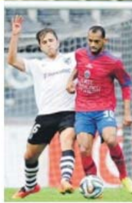
Tarcísio cumpre um jogo de castigo