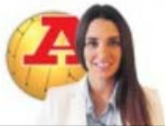
por TÂNIA FERREIRA VITOR

O espaço onde o futebolista deixa o relvado e mostra o que poucos conhecem