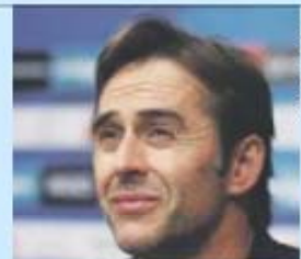
Técnico não fala sobre o seu futuro

Sobre se está satisfeito com a época da sua equipa, Lopetegui defende-