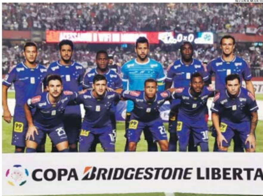
Jogadores do Cruzeiro antes dum jogo da Copa dos Libertadores: atual plantel está diferente daquele que se sagrou bicampeão em 2014

Cruzeiro busca o inédito tri • Candidatos não faltam • Prova sem pausa na Copa América e com o mercado quase sempre aberto