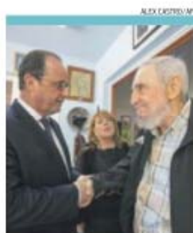
François Hollande e Fidel Castro

Hollande terá mesmo pedido o fim do embargo económico dos EUA a Cuba em vigor desde 1962, com o argumento de que, para poder haver uma certa «abertura», é também preciso eliminar as «medidas que prejudicam o desenvolvimento» do país.