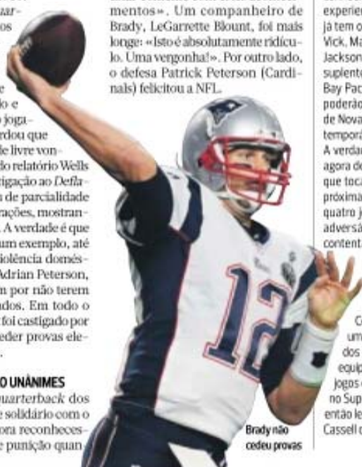
Brady não cedeu provas

do «alguém não cumpre as regras». E acrescentou: «Não gosto de ver ninguém suspenso. Nunca poder estar contente com estes acontecimentos». Um companheiro de Brady, LeGarrette Blount, foi mais longe: «Isto é absolutamente ridículo. Uma vergonha!». Por outro lado, o defesa Patrick Peterson (Cardinals) felicitou a NFL.