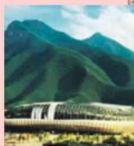
Novo estádio em construção