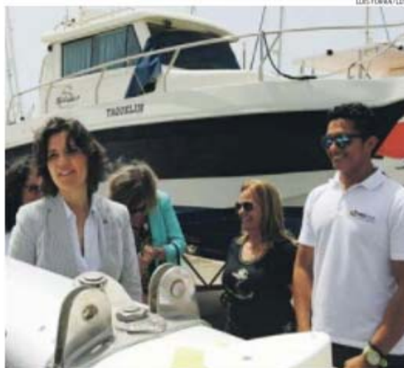
Assunção Cristas esteve, ontem, de visita às novas instalações da Sopomar, em Lagos

De acordo com a ministra, além da construção e reparação navais, o país tem «áreas excecionais para