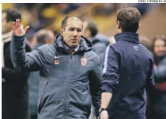
Leonardo Jardim e André Villas Boas cumprimentam-se depois de um jogo da Champions

Durante muitos anos habituámo-nos a aplaudir e elogiar — muitas vezes com uma pontinha de exagero... — os feitos dos nossos treinadores em clubes mais ou menos desconhecidos de países mais ou menos longínquos — de Marrocos e do Egito, de Angola e de Moçambique, da Costa Rica e do Paraguai, do golfo Pérsico e do Extremo Oriente. Hoje, temos treinadores com sucesso nas principais ligas europeias (só falta a Alemanha) e na exigentíssima Liga dos Campeões. É um enorme salto qualitativo. Se me faço entender.