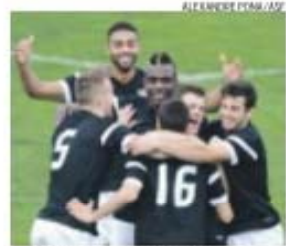
A esperança pela Liga 2 continua