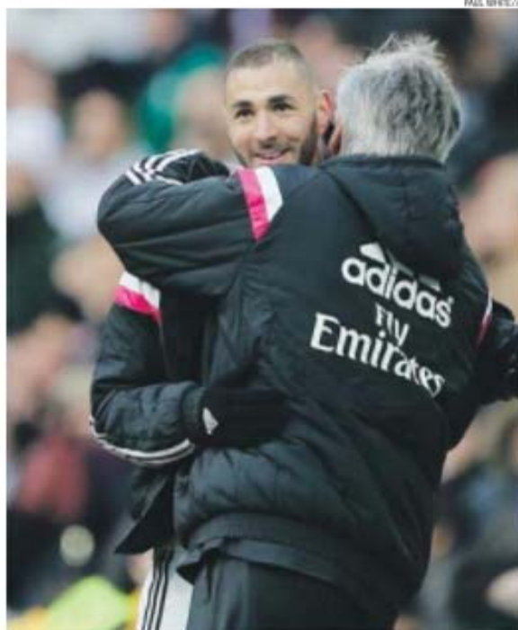
Ancelotti, treinador do Real Madrid, tem mais uma opção para o jogo de hoje: Benzema

Guarda-redes de 37 anos da Juventus, Gianluigi Buffon também saiu em defesa de Casillas: «É incrível que o critiquem. Há jogadores que não merecem ser assobiados e Casillas é um deles.»