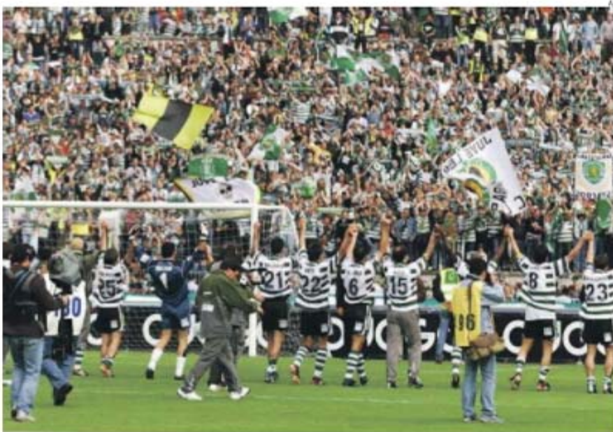
«O jogo mais importante até final da época será a 31 de maio no Jamor: com filhos e netos, acho que viverei momentos de grande alegria»

Para o meu Sporting e para o Braga ainda haverá um jogo fundamental e igualmente decisivo. A final do Jamor, com equilíbrio das claques, já que ambos os clubes, e muito bem, receberão o mesmo número de ingressos. O verde e o encarnado serão as cores dessa final que, para o meu Sporting, em-