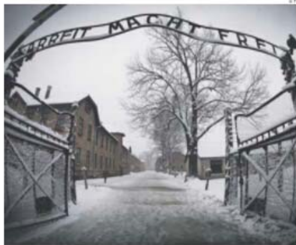
Em Perguntem a Sarah Gross , Auschwitz também é Oshpitzin

Sim, já se percebeu, é um romance em vários tempos e espaços, que se passa por Auschwitz em março de 1943 mas começa em Cottage