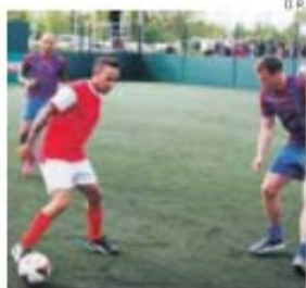
Hamilton com os jogadores do Arsenal

→ Lewis Hamilton promete novidades sobre renovação para corrida do principado