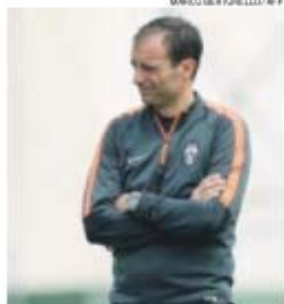
Massimiliano Allegri, treinador da Juventus

MADRID — «É o jogo mais importante da minha carreira. Mas acredito que hoje [ontem] vou dormir bem e amanhã [hoje] também.»