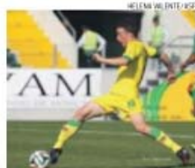
Diogo Jota ainda inspira alguns cuidados