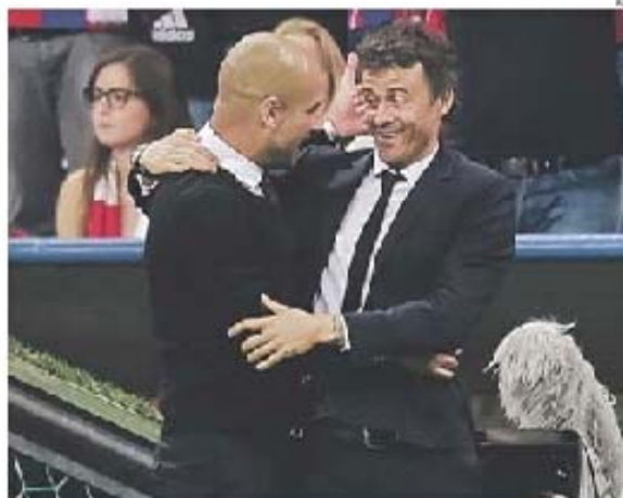
O cumprimento entre os compatriotas espanhóis Pep Guardiola e Luis Enrique

Com o triplete — 1 Liga, Taça do Rei e Champions — ainda em aberto, Luis Enrique, 45 anos, está pela primeira vez na carreira (de jogador e treinador) na final da Liga dos Campeões e é o terceiro técn-