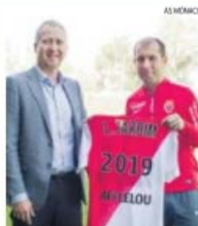
Vadim Vasilyev e Leonardo Jardim

Leonardo Jardim, 40 anos, vive segunda experiência num clube estrangeiro, após ter treinado o Olympiakos