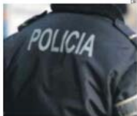
Processo envolve trinta suspeitos

A Estação de Radar N.º 4 (ER4), localizada no Pico do Arleiro, na Madeira, celebra, hoje, o segundo aniversário, numa cerimónia que terá início às 15 horas e que será presidida pelo Chefe do Estado-Maior da Força Aérea Portuguesa, General José António de Magalhães Araújo Pinheiro.