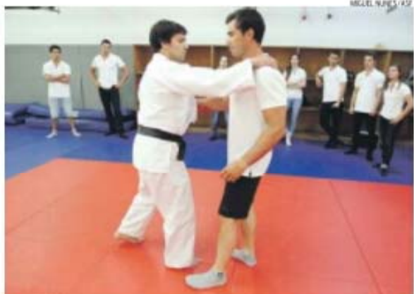
Pimenta (à dir.) brincou, dizendo que poderá aplicar técnicas de judo nos seus adversários...

«Foi uma boa experiência, mas nunca mudaria. A canoagem é a minha segunda paixão, depois da fami-