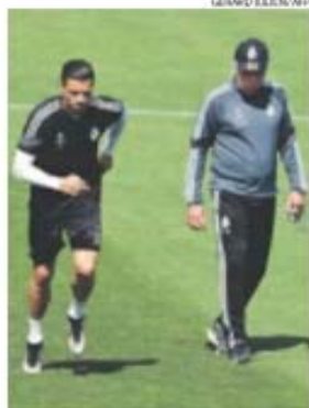
Ronaldo no treino, ontem, com Ancelotti