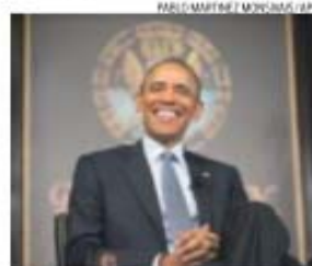
Barack Obama, presidente dos EUA

Milhares de refugiados da minoria étnica muçulmana Rohingya, perseguida em Myanmar estão à deriva na costa da Tailândia. A BBC dizia ontem que uma ofensiva tailandesa para reprimir a chegada de imigrantes fez com que muitos traficantes tivessem recusado o desembarque. São cerca de 8000 pessoas, entre elas também refugiados do Bangladesh.