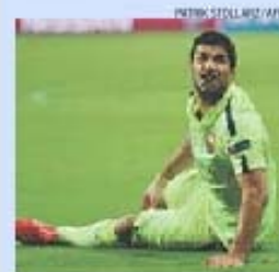
Suárez e as dores na perna esquerda

O presidente honorário do Bayern Munique, Franz Beckenbauer, afirmou, ao L'Équipe, antes do jogo, que o Barcelona só é o que é porque conta com o argentino Lionel Messi: «É ele que marca a diferença, sem Messi o Barça seria uma equipa vulgar.» Ainda assim, o antigo internacional alemão, de 69 anos, considera o brasileiro Pelé como o melhor jogador de sempre: «Ele era o melhor de todos.»