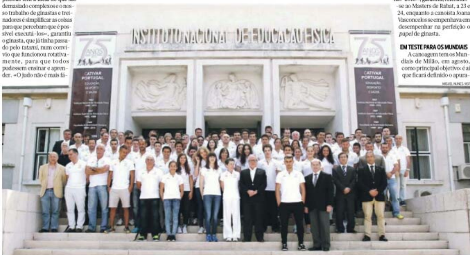
A comitiva portuguesa terá 101 atletas nos Jogos Europeus de Baku. Muitos deles estiveram ontem em convívio, na Faculdade de Motricidade Humana e no Jamor, participando em diversas atividades, com técnicos e dirigentes