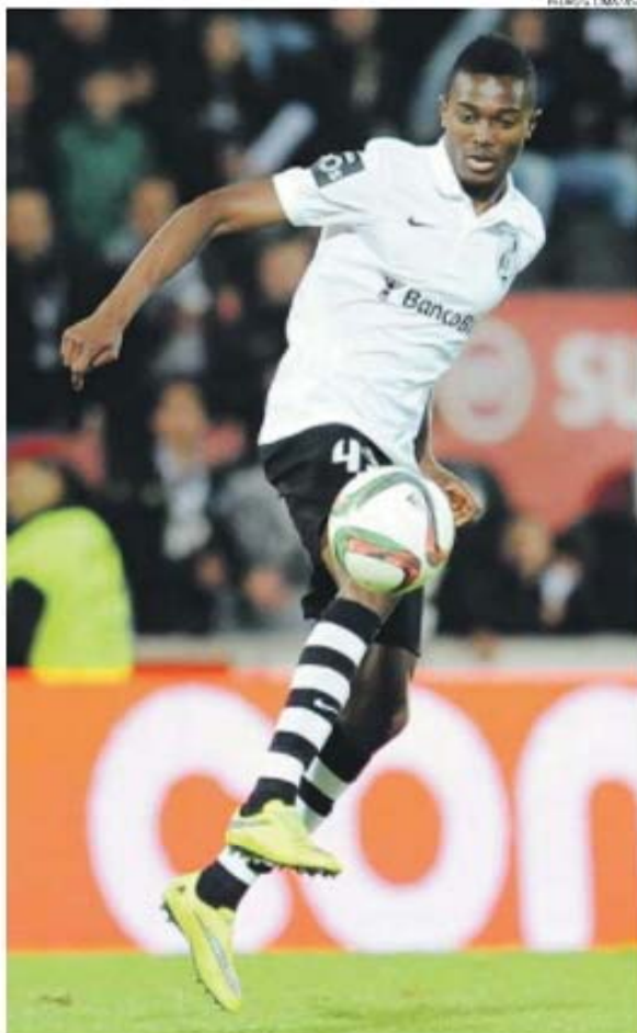
Bernard há muito que é seguido pelo Man. United, mas Valência e Mónaco também o querem

Em 2011, por exemplo, o Arsenal teve de ceder o avançado costa-riquenho Joel Campbell ao Lorient, da França, porque na época tinha 19 anos e não cum-