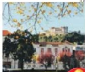
Leiria recebe prova pela 18.ª vez

→ Contrarrelógio no penúltimo dia será o tira-teimas depois da chegada ao Alto da Torre