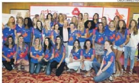
Rosa Mota é a madrinha da 10.ª Corrida da Mulher, apresentada ontem, em Lisboa

Neste momento, já há mais de 10.000 mulheres inscritas — o limite são 15.000 participantes — e a vencedora receberá 500 euros. Serão também distinguidos os vencedores de vários segmentos: Prémio Empresas (duas atletas), Prémio Mãe e filha (duas), Prémio Amigas (três) e Prémio Avó e Neta (duas).