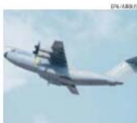
Modelo do avião que caiu no sábado

→ Voo de Toulouse (sede da Airbus) e Sevilha foi feito sem qualquer tipo de anomalias