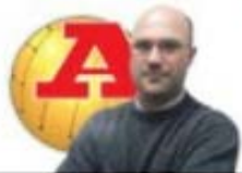
por ANDRÉ PIPA