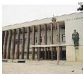
Septuagenário liberto em dois julgamentos

Desde então o recurso a cães para auxílio dos serviços das forças de segurança aumentou, tendo sido criado, em janeiro de 1986, o Centro de Instrução Cinófila da Polícia Aérea, no Aeródromo de Manobra N.º 1, que na próxima sexta-feira comemora o 29.º aniversário.