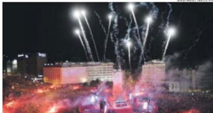
Tal como há um ano, a maré vermelha voltou a inundar o Marquês de Pombal e as artérias de acesso à praça; ao brilho do fogo de artifício juntaram-se os focos vermelhos no centro da festa

lado a lado com Luís Filipe Vieira, ao som de... «o campeão voltou». A passeira encerrou com a entrada da restante equipa técnica, de todo o departamento de futebol e dos familiares dos jogadores, também eles a experimentarem a emoção da... maré vermelha.