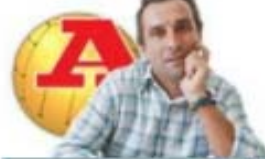
por ANTÓNIO SIMÕES