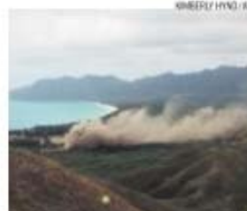
Aeroplano caiu durante um exercício militar

A polícia norte-americana anunciou ontem a detenção de mais de 190 pessoas em consequência do tirotoleto, registado no domingo, no Texas, em que nove pessoas morreram e pelo menos 18 ficaram feridas. O incidente deu-se entre dois clubes de motociclistas.