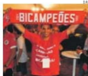
Nuno Gomes na tenda VIP do Marquês

Jogadores esperavam ansiosamente para se juntar à festa.