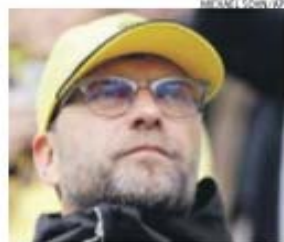
Klopp, 47 anos, de saída do Dortmund

Turco Cuneyt Çakir arbitra final da Champions A final da Liga dos Campeões, a 6 de junho, em Berlim, entre Juventus e Barcelona, será arbitrada pelo turco Cuneyt Çakir, 38 anos, árbitro internacional desde 2006, anunciou ontem a UEFA. O quarto árbitro será o sueco Jonas Eriksson. A final da Liga Europa, a 27 de maio, em Varsóvia, entre Dnipro e Sevilla, será dirigida pelo inglês Martin Atkinson, de 44 anos.