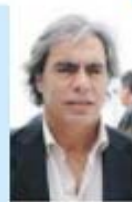
antigo jogador do fc porto

Nos 33 anos que leva na presidência Pinto da Costa só não ganhou na época do Quirito, no ano passado e agora. Algo terá de ser feito. Com certeza que no segundo ano o treinador não vai cometer os mesmos erros. Contudo, há que reconhecer que este ano o FC Porto foi muito prejudicado pelas arbitragens.