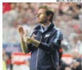
Villas Boas, 37 anos, campeão pelo Zenit