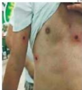
Imagem partilhada nas redes sociais

→ PSP usou balas de borracha para dispersar; confrontos entre benfiquistas e sportinguistas