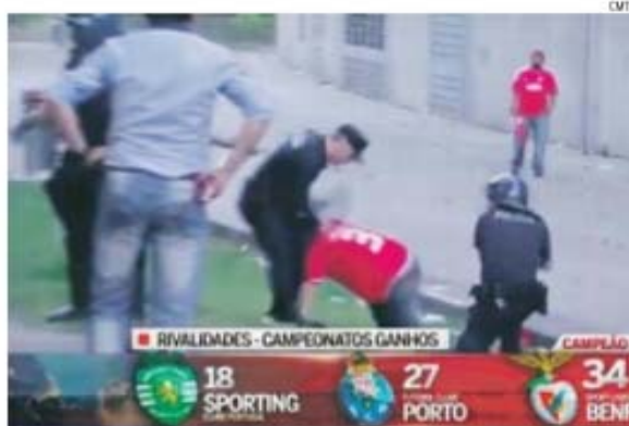
Imagens de grande agressividade deixaram o país revoltado contra o subcomissário