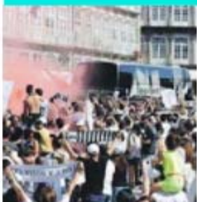
Vitorianos festejam no Toural

O vice dos vitorianos sublinhou a inexistência de relatos violentos envolvendo apolantes do clube minhoto: «Não houve confrontos com adeptos vitorianos e demarcámos-nos dos problemas que aconteceram. Aquilo que se verificou foram atos de vandalismo e os seus autores não gostam de futebol. Não confundimos a Instituição Benfica com estes atos.»