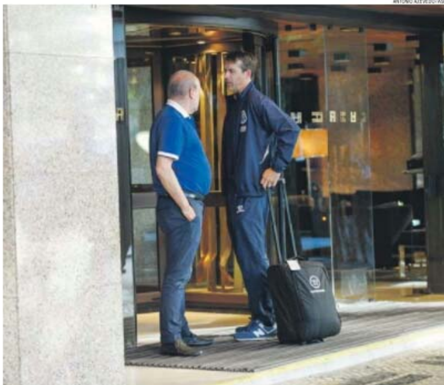
«Deve Pinto da Costa acreditar que Lopetegui aprendeu o suficiente para não cometer os mesmos erros?», pergunta Miguel Sousa Tavares

Por alguma misteriosa razão, este pequeno país produz jogadores e treinadores de categoria muito acima do que as regras da proporcionalidade poderiam prever.