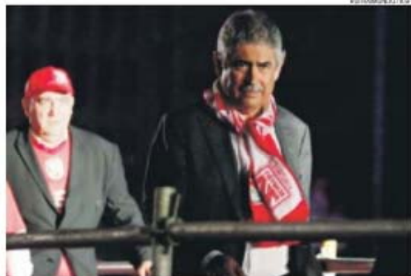
Presidente do Benfica ficou triste com os incidentes que estragaram a festa encarnada

Tochas, petardos, caixotes de lixo e outras estruturas vandalizadas, adeptos contra adeptos e adeptos contra a polícia. O Marquês de Pombal virou campo de batalha