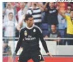
Ronaldo já contabiliza 310 golos pelo Real

Cristiano Ronaldo foi avisado por Pepe para não festejar, no final do jogo de anteontem, na vitória do Real Madrid sobre o Espanhol (4-1), em Barcelona. Algumas câmaras apanharam o momento: satisfeito por mais um hat trick , o avançado português preocupou-se em recolher a bola do jogo e cumprimentava os colegas de forma alegre, quando o central alertou-o para mostrar um ar mais sério, pois os merengues tinham acabado de perder a possibilidade de chegar ao título. E a verdade é que a expressão dele mudou. CR7 tomou-se o segundo melhor marcador da história do Real Madrid, com 310 golos, superando os 308 de Di Stéfano. O líder Raúl tem 323.