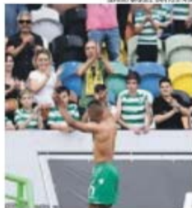
Nani despede-se dos adeptos em Alvalade

«O vosso apoio foi indescritível, tal como no passado levo o Sporting no meu coração! Obrigado.. Sporting sempre!», escreveu Nani na sua página oficial do Facebook, ontem, num post que pelas 22 horas já tinha perto de 18 mil gostos.