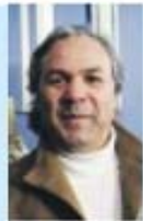
antigo jogador do fc porto

Estou triste pelo FC Porto, mas há que referir que o Benfica fez uma grande campanha. O campeonato foi decidido em detalhes. Na Champions a equipa esteve em plano excelente, mas o futebol é assim. Mudar de treinador? Depende dos dirigentes. O FC Porto tem, e continuará a ter, um plantel bom e forte.