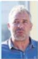
antigo jogador do fc porto

São duas épocas sem ganhar nada. Acho que é preciso refletir, para que o FC Porto volte forte para o ano. Não me parece que o mal esteja na parte técnica. A equipa é jovem, com jogadores novos que tiveram o seu primeiro ano em Portugal. Com confiança e paciência este grupo pode fazer muito melhor.