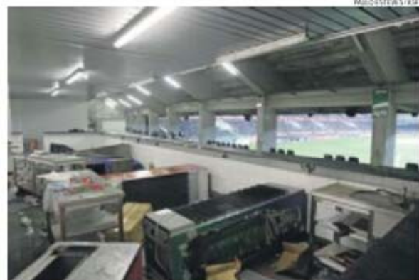
Bar do topo norte do D. Afonso Henriques ficou destruído e a caixa com o dinheiro assaltada

Os relatos dão conta de que adeptos benfiquistas passaram junto ao Estádio José Alvalade entoando cânticos e com a intenção de vandalizar as paredes do estádio, o que foi considerado ofensivo por parte dos adeptos do Sporting ali presentes, nomeadamente de elementos afetos à clique Diretivos Ultra XXI, que celebravam o 13.º aniversário do grupo. Rapidamente a troca de palavras terá passado a confrontos, com o Corpo de Intervenção da PSP segundo é visível num vídeo publicado ontem no YouTube a usar balas de borracha para dispersar os grupos em disputa. No meio dos confrontos, um adepto ligado ao Sporting terá sido atingido por balas de borracha. Esta foi apenas uma das zonas de Lisboa marcadas pela violência na madrugada de ontem. Os confrontos entre polícias e adeptos perto da rotunda do Marquês de Pombal acabaram por ditar o final prematuro dos festejos do 34.º título do Benfica.