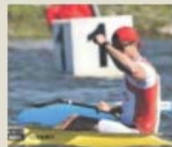
06.17 – Modalidades: Ténis: Canoagem Atletismo