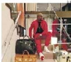
NBA valeu mais uns bons milhares a Floyd

Presença constante em jogos da NBA, Floyd Mayweather está a fazer uma maratona para acompanhar os jogos do play-off e ficou ainda mais rico no fim de semana graças a eles! Se há coisa de que o norte-americano não precisa é de dinheiro - não é por acaso que é conhecido por Floyd Money Mayweather -, sobretudo após ter arrecadado milhões na sequência da vitória sobre o filipino Manny Pacquiao, naquele que foi designado como o Combate do Século , realizado em Las Vegas, Estados Unidos. Mas a verdade é que o pugilista conseguiu ganhar em quatro dias. «Pagaram-me enquanto via os outros a traba-