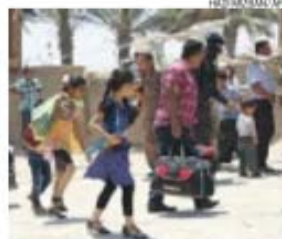
Civis tentam fugir aos avanços do EI

→ Depois de Ramadí, os 'jihadistas' querem tomar a capital; EUA recusam enviar militares