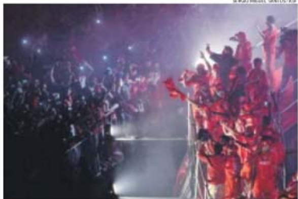
Plena comunhão entre adeptos e jogadores no Marquês de Pombal, onde o fogo de artifício abrihantou uma festa totalmente em tons de vermelho; e foi a 1:18 da madrugada que, de cachecóis no ar, cantou-se o hino do Benfica

jogadores desde Guimarães, sempre acompanhados por câmaras que iam partilhando com a maré vermelha no Marquês de Pombal o que se ia passando. Dois minutos depois da hora marcada (00:32), o autocarro estacionava no túnel do Marquês, onde os familiares dos