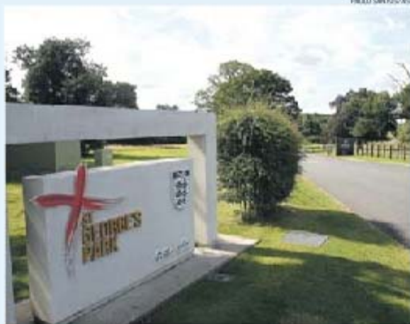
St. George's Park é um nome conhecido para grandes clubes do futebol internacional

Situado na zona central de Inglaterra, mais concretamente entre as cidades de Birmingham e Nottingham, o St. George's Park oferece todas as condições de trabalho que uma grande equipa profissional exi-