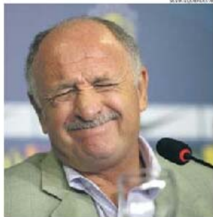
Luiz Felipe Scolari, 66 anos, deixou ontem o Grêmio de Porto Alegre

Scolari assinou pelo Grêmio semanas depois de ter saído da seleção brasileira na sequência da derrota para a Alemanha por 1-7 na meia-final do Mundial-2014. Gremista de coração e glória do clube — levou-o à conquista do Brasileirão de 1996 e da Taça dos Libertadores de 1997 — Felipe refugiou-se junto à única