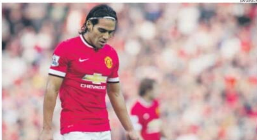
Falcao, 29 anos, chegou a chorar pela condição de segunda escolha no Manchester United treinado pelo holandês Louis van Gaal