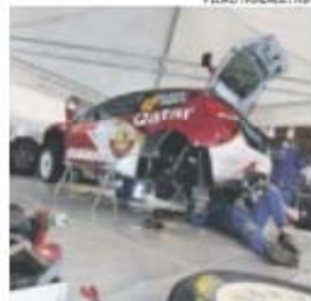
Azáfama grande à volta dos carros

mas não é menor, até pelo facto desta 5.ª etapa do Mundial ser uma espécie de prova dos nove à fiabilidade dos VW Polo, após o desastre na Argentina e os problemas de motor sentidos por Jari-Matti Latvala nos testes nortenhos.