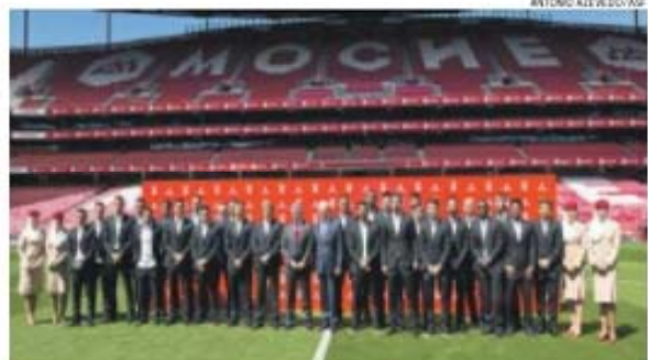
A foto de família no relvado com o novo patrocinador e o plantel bicampeão nacional