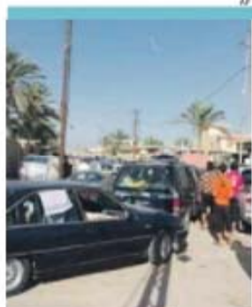
Habitantes de Ramadi procuram fugir

De acordo com relatos de residentes, mais de 25 mil pessoas deixaram a cidade para fugir ao massacre. Centenas de corpos de simpatizantes do governo foram lançados no rio Eufrates. A perda de Ramadi foi um sério revés para a estratégia do executivo iraquiano e dos Estados Unidos para a região.