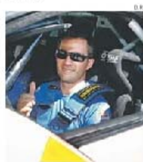
Ogier pode vencer rali pela quinta vez

Hoje, enquanto os pilotos concluem os reconhecimentos, as verificações decorrem na Exponor, preenchendo tarde e parte da noite.