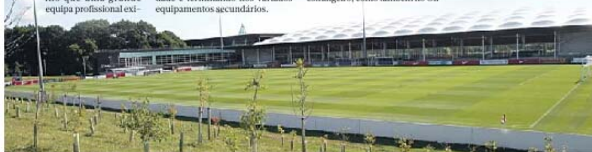
A casa da seleção inglesa oferece tudo aquilo que os encarnados necessitam para preparar a temporada 2015/16

val, vai faltar aos encarnados, que na temporada passada realizaram o estágio no Seixal.