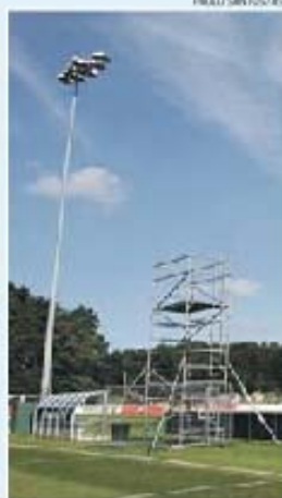
Torre permite visão abrangente

Nem mesmo uma célebre torre junto ao relvado, que Lopetegui utilizou para trabalhar não só no estrangeiro, como também no Oli-