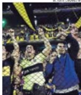
Adeptos do Boca no clássico com o River

De acordo com um comunicado do Boca, as imagens recolhidas pela Fox Sports já foram analisadas pela justiça, tendo per-