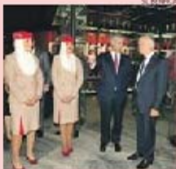
Tim Clark no museu do Benfica

A parceria com o Benfica reforça a presença da marca Emirates em Portugal e será acompanhada, no início de 2016, pela expansão da operação levada a cabo no nosso País, com a adição de um segundo voo diário entre Lisboa e Dubai. A operar na capital desde julho de 2012, a Emirates já transportou quase meio milhão de passageiros e o segundo voo diário significará mais dez mil lugares por semana.