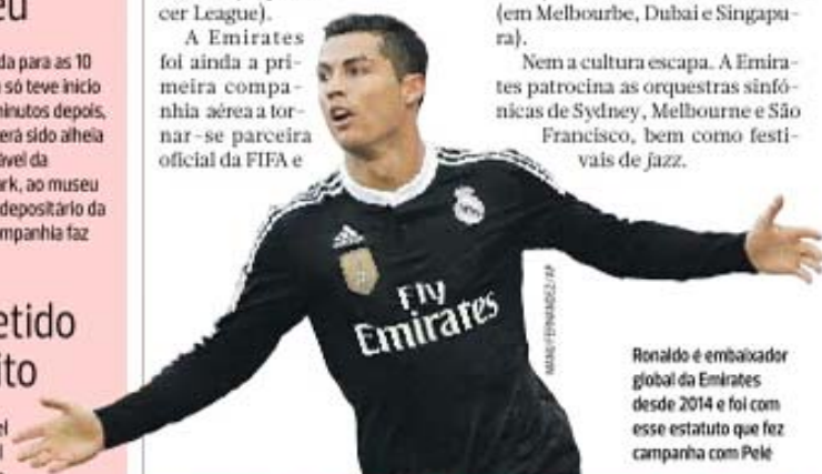
Ronaldo é embaixador global da Emirates desde 2014 e foi com esse estatuto que fez campanha com Pelé

Nem a cultura escapa. A Emirates patrocina as orquestras sinfónicas de Sydney, Melbourne e São Francisco, bem como festivais de jazz.