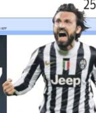
TACA DE ITALIA - FINAL EPOCA 2014/2015

ÁRBITRO Daniele Orsato ESTÁDIO Olimpico, em Roma, às 19.45h