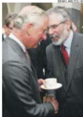
O aperto de mão de Carlos e Gerry Adams

O momento teve lugar na recepção a Carlos na Universidade Na-