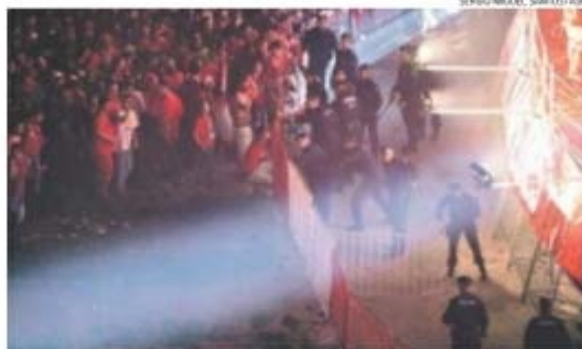
Confrontos no Marquês de Pombal continuam na ordem do dia

O presidente da Câmara Municipal de Lisboa admitiu ontem que «houve diferenças de opinião sobre o dispositivo de circulação no interior da rotunda do Marquês». Fernando Medina comentava, perante os jornalistas, a notícia de que a PSP se opôs à realização da festa do título benfiquista nos moldes em que esta veio a ocorrer por considerar insegura a instalação de um palco a 360 graus. O edil lisboeta, no entanto, fez questão de frisar também que apesar das cenas de violência que colocaram ponto final na festa, «foi feito um conjunto de recomendações que foram seguidas à risca», disse referindo-se ao «reforço de gradeamentos das zonas onde iriam circular veículos de emergência» e