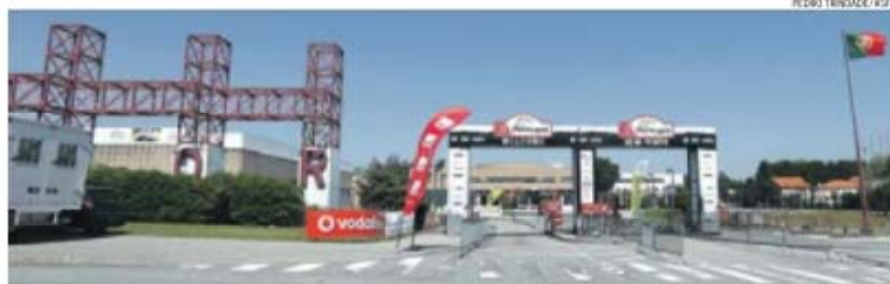
Exponor, em Matosinhos, é o quartel-general do rali que junta os melhores pilotos do Mundo

Para muitos, será o reavivar de memórias de outros tempos. Para os mais novos, o desafio de saberem merecer a oportunidade, de forma a garantirem, com o seu (bom e seguro) comportamento, a continua-