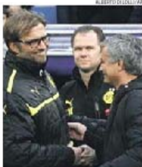
Klopp eliminou o Real de Mourinho em 2013

MADRID — Jürgen Klopp poderá suceder a Carlo Ancelotti (ontem colocado na órbita do Milan) como treinador do Real Madrid. Segundo a Radio Deutschland , o ainda treinador do Dortmund já tem um pré-acordo com os merengues, tendo aceitado uma proposta para comandar Cristiano Ronaldo e companhia nas próximas três temporadas e com um salário anual a rondar os €8 milhões.