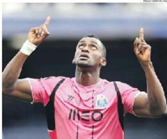
Marca portuguesa deverá dar lugar a uma multinacional chinesa nas camisas portistas

As ligações ao futebol são conhecidas há muito: a Huawei (lê-se uá-uei) tem parcerias com Santos (Brasil), Galatasaray (Turquia), Borussia Dortmund (Alemanha), Atlético Madrid (Espanha), Paris Saint-Germain (França) e até Benfica, sendo desde fevereiro deste ano o parceiro tecnológico oficial do clube da Luz.