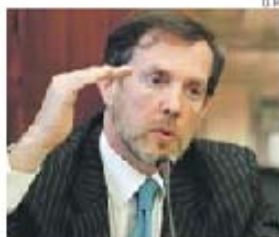
Pais do Amaral lidera consórcio internacional