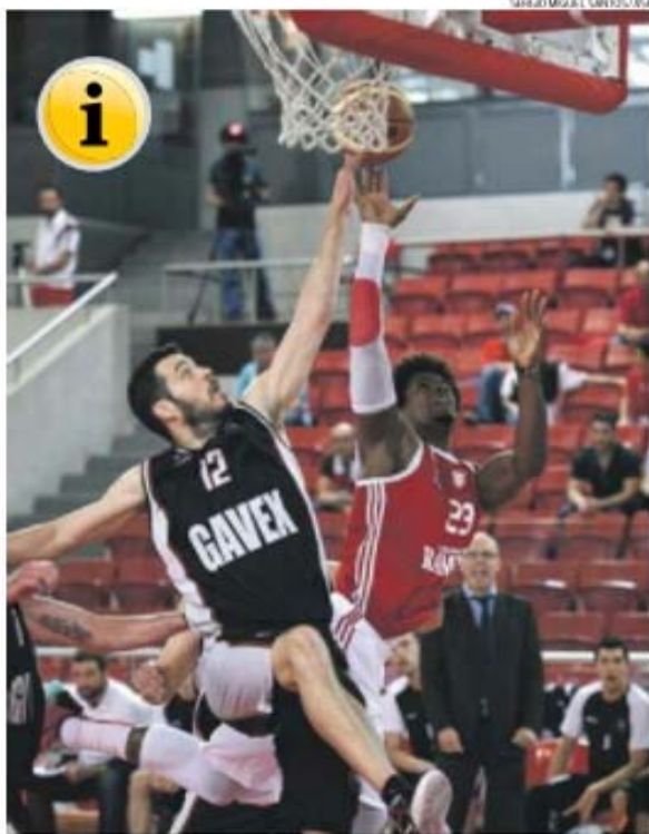
Benfica apela à presença de adeptos, esta noite, na Luz, onde vão receber os rivais vareiros