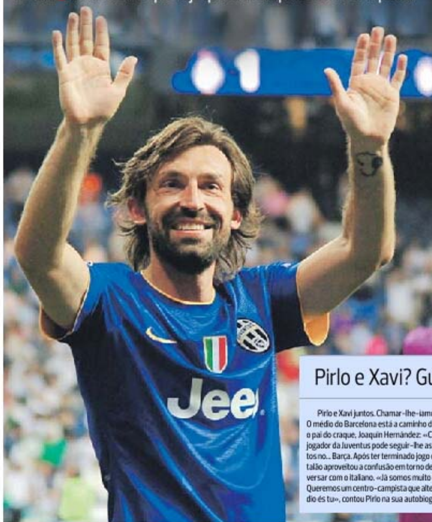
Andrea Pirlo, 36 anos, pode conquistar hoje, em Roma, o 19.º título de uma carreira única

No Pirlo, no party. Quem quiser vê-lo em ação faça favor de assistir, hoje, à decisão da Taça de Itália, em Roma, entre Juventus e Lazio (de Peireirinha e Mauricio), partida antecipada pelo facto de a vecchia signora ter duelo marcado com o Barça na final da Champions de Berlim a 6 de junho. Pressão? Hum, provavelmente não, a avaliar pela forma como passou o tempo antes da final do Mundial-2006: «Nunca me sinto pressionado. Passei a tarde de domingo 9 de julho de 2006, em Berlim, a dormir e a jogar Playstation. À noite sai e fui ganhar o Mundial.»