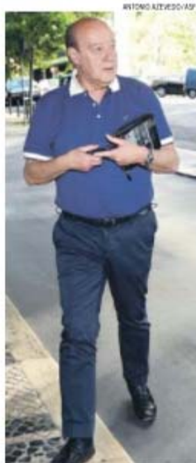
Adeptos querem ouvir Pinto da Costa