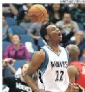
Andrew Wiggins destaca-se nos Wolves

Wiggins participou nos 82 desafios dos Wolves, a pior equipa nesta época, alcançando a média por jogo de 16,9 pontos, o segundo melhor registo da franquia de Minnesota por um estreante, após os 18,2 de Christian Laettner em 1992/93. O espa-