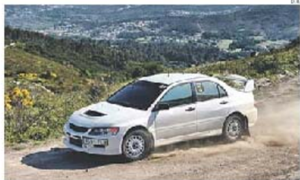
Pilotos já andaram ocupados ontem com os reconhecimentos