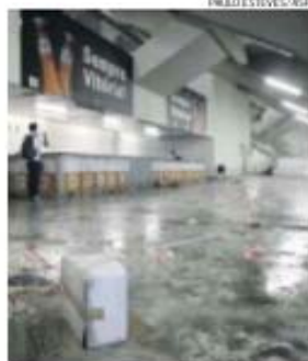
Armazém vitoriano ficou vazio

O Ministério Público instaurou um inquérito para investigar o saque ao armazém de material desportivo do Vitória, verificado após o jogo com o Benfica, realizado no passado domingo. A invasão de adeptos alegadamente afetos ao emblema encarnado ao armazém vitoriano culminou com furto de material desportivo do clube (chuteiras, sapatilhas, equipamentos e bolas).