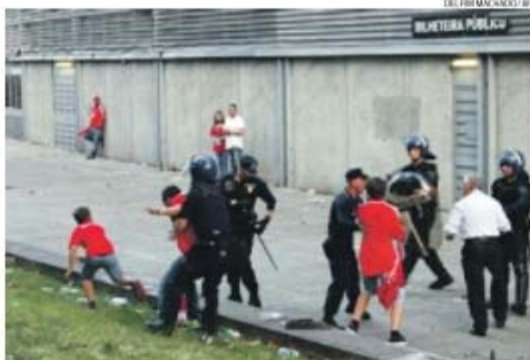
O momento em que o pai de família é imobilizado, antes de ser agredido