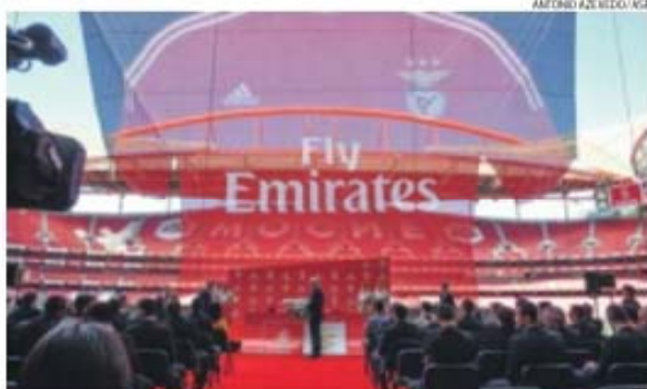
Segredo da nova camisola para 2015/16 foi revelado com enorme pano

O 34 já lá vai e na Luz já está a ser preparado o terreno para a equipa lutar pelo 35.º título da sua história. Voar para o tricampeonato será o designio na próxima época e as águilas irão fazê-lo à boleia da Emirates, companhia aérea sediada no Dubai, nos Emirados Árabes Unidos, que o Benfica oficializou, ontem, como novo patrocinador das camisolas da equipa principal. Válido por três épocas, ou seja, até 2017/18, o