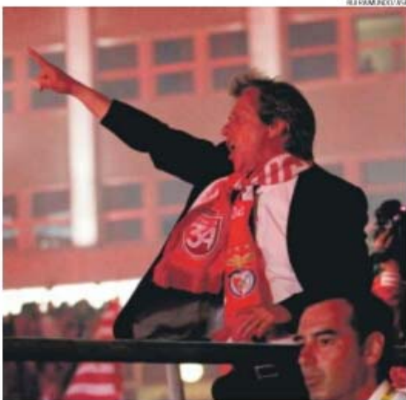
Jesus pode chegar aos 10 títulos se vencer a Taça da Liga

Dirão alguns críticos que Jorge Jesus é uma espécie de campeão de trazer por casa, incapaz de mostrar serviço na Liga dos Campeões. Há verdade no remoço. Só um cego não repara que Jesus tem chumbado consecutivamente no exame da Champions. E, convenhamos, é difícil considerar mestre da tática um treinador que, por norma, não consegue ultrapassar a fase inicial da competição mais importante, onde se forjam as grandes equipas, os grandes treinadores e os grandes jogadores. Essa é a grande pecha da carreira de Jesus. O ponto de inter-