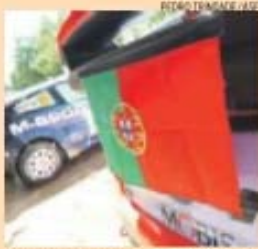
Belga Neuville está com os portugueses

Emílio Guerreiro, secretário de Estado do Desporto e Juventude, foi um dos convidados a apadrinhar o arranque da 49.ª edição do Rali de Portugal. O membro do Governo esteve durante muito tempo à conversa com Rui Vitória, treinador do Vitória de Guimarães, que não resistiu ao charme de uma prova de pujança impar.