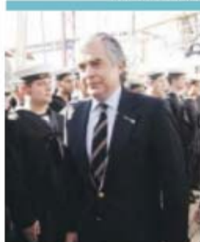
Jose Pedro Aguiar Branco, ministro da Defesa