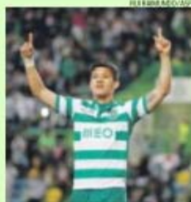
Montero espera muito apoio na Taça