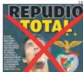
Capa da edição 'La Afición', de Monterrey

→ Adeptos do Monterrey não querem os encarnados na inauguração do estádio