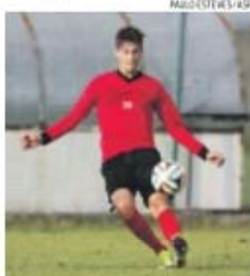
Rafa fez 22 jogos nesta edição da Liga

Médio, fez toda a formação no Penafiel e lá também se fez profissional, mas a estreia na Liga registou-se ao serviço do Nacional, há duas épocas. O regresso ao emblema penafielense deu-se na campanha que se conclui este fim de semana, por cedência dos madeirenses, tendo acumulado 1820 minutos na Liga. Será novamente o clube da Choupana a ter papel decisivo no futuro do atleta, até