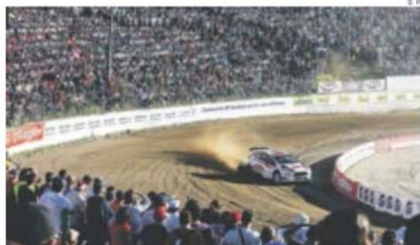
Miguel Campos (23.º da geral) foi o melhor português

Tratou-se apenas de um aperitivo para as dificuldades que se adivinham já na etapa de hoje