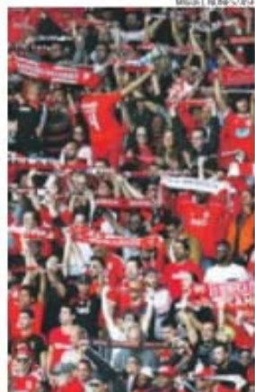
Clube vai fazer recontagem de sócios

Os adeptos do Monterrey continuam indignados com a Direção, por ter escolhido o Benfica para a inauguração do novo estádio, a 2 de agosto. «Repúdio Total!», é a ideia escolhida pelo jornal La Afición, para descrever o sentimento dos adeptos, que se sentem enganados. Segundo a publicação, num inquérito promovido na cidade, «95 por cento dos hinchas repudiam a Direção por tê-los feito acreditar que seria escolhido um rival de primeiro nível como o Real Madrid ou o Barcelona». O presidente do Monterrey, escreve o jornal, provocou uma das «maiores desilusões» ao anunciar um adversário «sem figuras ou estrelas».