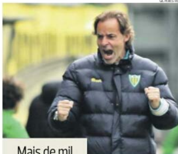
Mais de mil

«Fomos uma equipa extremamente regular. Por isso é que es-