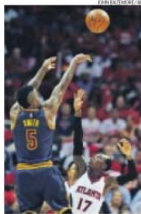
J.R. é amigo de LeBron desde a adolescência

Em dificuldades estão agora os Hawks, que viram DeMarre Carroll (5), responsável pela defesa de