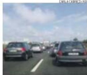
Trânsito vai estar condicionado