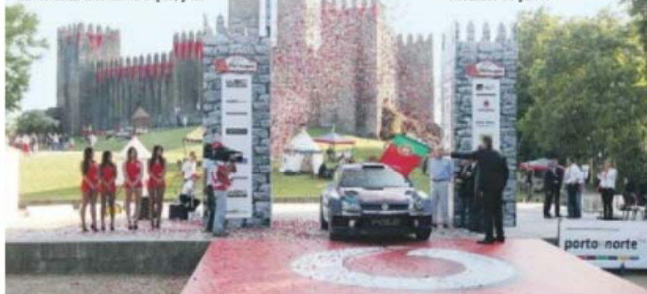
'Vestido' a preceito, o castelo da cidade em que Portugal nasceu serviu de cenário à partida dos melhores do Mundo nos ralis

Ambiente fervoroso em Guimarães, vendido ao mundo com o magnífico castelo em fundo. O Rali de Portugal arranca numa cidade rendida à alta velocidade. A organização esmerou-se, a segurança foi serena e o povo preencheu todos os lugares possíveis. Entre o Campo de São Medede, de onde saiu oficialmente a 49.ª edição, o imponente e aprazível átrio do Castelo, e o Toural, esse palco de azafama e celebração inconfundível da cidade, os populares avançaram o mais possível para tomar contacto com Ogier, Latvala, Sordo e companhia. Milhares acorreram-se, deliraram, posaram para a fotografia e arrancaram autógrafos dos ídolos, apelando ao espetáculo. O dinamarquês Andreas Mikkelsen foi, porém, o causador de euforia maior, com o clamor do seu motor, P. C.