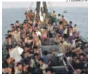
Migrantes na costa de Aceh (Indonésia)