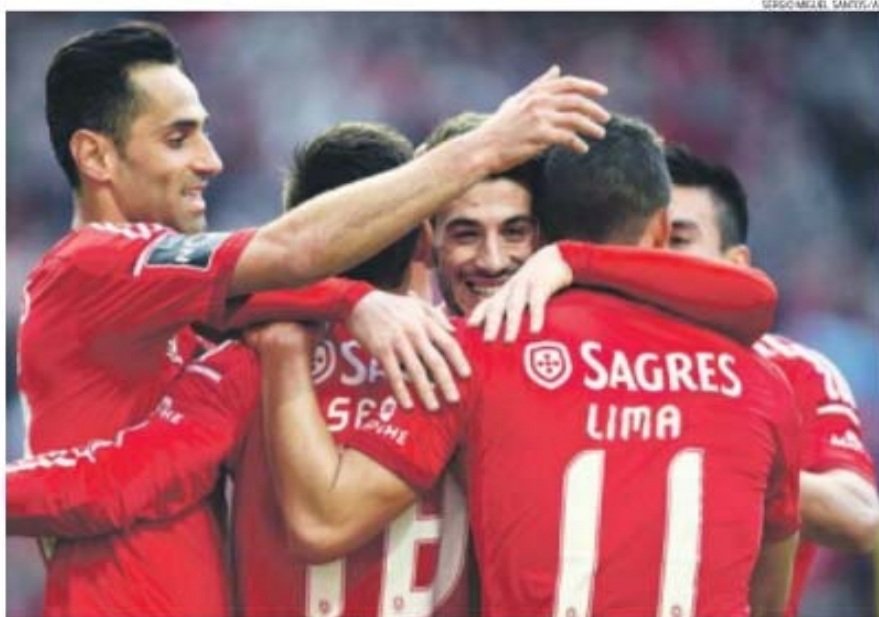
Do balneário para o relvado, a união foi um dos fatores em destaque ao longo da época para ajudar na concretização dos objetivos

O almoço, que pode ter sido o último da temporada para muitos jogadores — isto apesar de a SAD ainda ponderar oferecer um repasto oficial para todo o futebol encarnado, extensivo às respetivas famílias — tendo em conta que logo após o último jogo, na próxima sexta-feira em Coimbra, onde es-