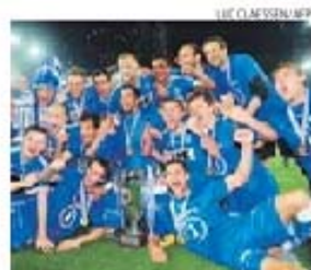
Festa dos novos campeões belgas