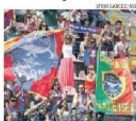
Muitos flavenses na bancada

Para o apoio à equipa, a claque do clube, a União Flaviense, está a preparar surpresas.