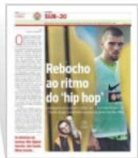
Paixão pelo 'rap' em A BOLA de 16 de maio

«O ambiente entre os jogadores é bom. Existe boa disposição e muita ambição. Estamos concentrados no trabalho e vamos lutar pelo mesmo objetivo. Central ou médio? A minha vontade é jogar e ser útil. Importante mesmo é a Seleção conseguir o apuramento para o Europeu!»