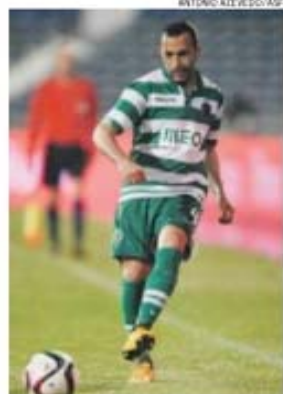
...tal como o brasileiro Jefferson...