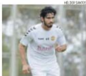
Freire aponta, com clareza, à Liga Europa

→ Central lembra, porém, que primeiro é preciso vencer o Paços de Ferreira