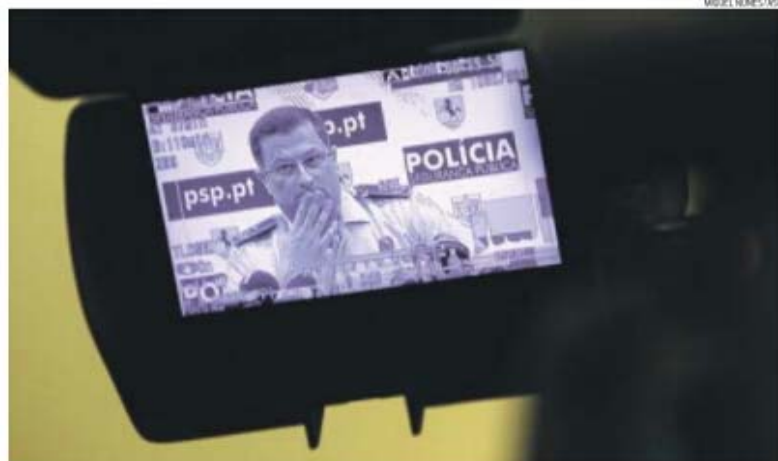
Pedro Pinho, subintendente da PSP de Lisboa, diz que não teria receio em levar a família dele ao jogo de hoje

• Jogo na Luz de risco elevado • Hoje é esperado ambiente de «festa»