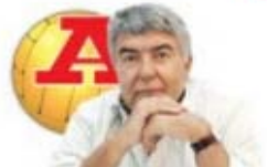
por VÍTOR SERPA

Agora que o futebol vai de férias, é boa altura para ver Portugal por dentro. Uma proposta: vá ao Douro e conheça a casa de Tormes, do Eça