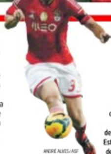
Jardel, 29 anos, deixou em estado de choque o Estádio José de Alvalade

➔ 20.ª jornada, Sporting-Benfica, no Estádio José de Alvalade. O Sporting coloca-se em vantagem, bem perto do final, por Jefferson, mas Jardel, no coração da grande área dos leões, em lance de insistência, remata para o fundo da baliza de Rui Patrício, fazendo o empate. O impacto psicológico foi enorme nas duas equipas.