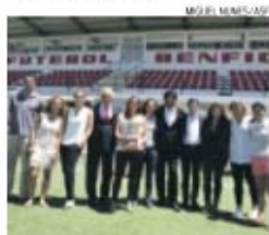
Entidades promoveram torneio em Benfica

→ Torneio Lisbon Women's Cup junta Fut. Benfica, Atlético Madrid, FC Eindhoven e Zaragoza