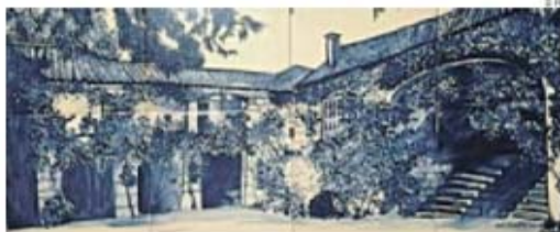
A célebre casa de Tormes, onde Eça se inspirou para escrever 'A Cidade e as Serras'

Agora que o futebol vai de férias, é boa altura para ver Portugal por dentro. Uma proposta: vá ao Douro e conheça a casa de Tormes, do Eça