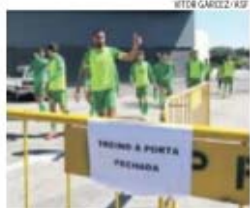
Jogadores agradeceram manifestação

Já na conferência de Imprensa, o treinador Paulo Fonseca comentou a iniciativa dos adeptos, mostrando-se satisfeito, esperando re-