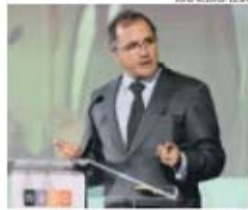
António Pires de Lima, ministro da Economia