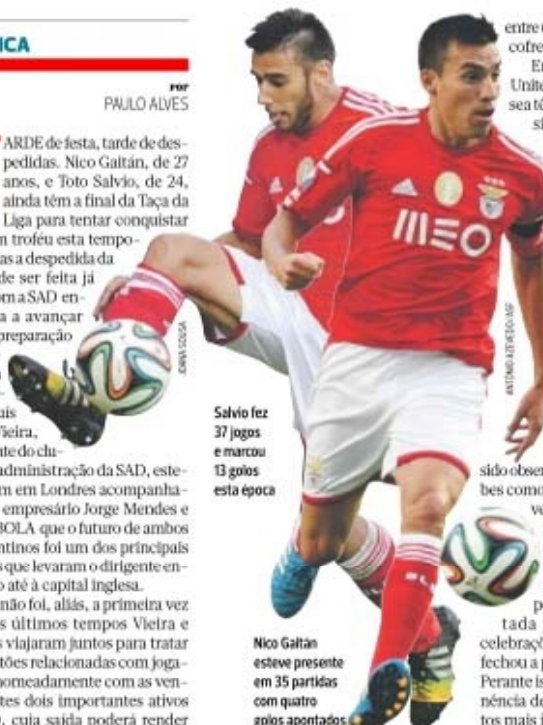
Salvio fez 37 golos e marcou 13 golos esta época

Esta não foi, aliás, a primeira vez que nos últimos tempos Vieira e Mendes viajaram juntos para tratar de questões relacionadas com jogadores, nomeadamente com as vendas destes dois importantes ativos da SAD, cuja saída poderá render