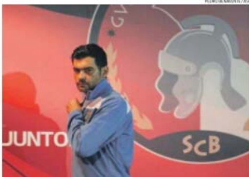
Sérgio Conceição, sem medo de ser castigado, disparou em várias direções

«Não estou preocupado com aquilo que a minha equipa vai fazer. O que me preocupa são as situações que se têm passado e que nós não conseguimos controlar. Eu prometi que não falaria mais das arbitragens mas, sinceramente, acho ridículo e inconcebível o que se passou em Alvalade. Tenho algum receio de que não podemos controlar, quer hoje, quer na final da Taça. Não quero ser o Zé Mota da situação, mas isto é ridículo demais. Não tenho medo de ser castigado, foi ridículo! Eu sei que vou pagar por isto, mas não posso deixar de dizer aquilo que sinto», afirmou, exaltado, o treinador dos bracarenses.