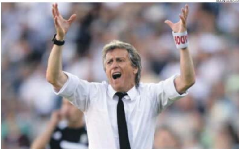
Jorge Jesus quer participar na festa do título, mas deseja terminar a Liga com mais uma vitória em casa

A semana foi diferente no Seixal, admite Jorge Jesus. Com o bicampeonato conquistado, e na resaca dos festejos em Guimarães e no Marquês de Pombal, em Lis-