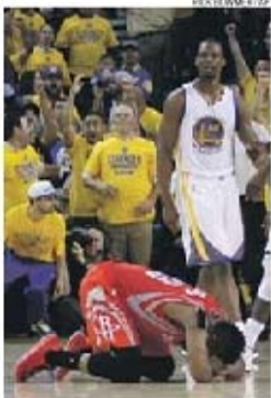
A desilusão de James Harden

Mas falhou. Tendo recuperado a bola de um ressalto a 7 segundos do fim, Harden (38 pts, 10 res, 9 ass), percorreu o campo e, sem que solicitasse - ou alguém de Houston - desconto de tempo, pôs parecia estar em vantagem, tentou atacar o cesto contrário. Hesitou face ao dois contra um de Stephen Curry e Klay