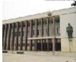
Argüido disse estar arrependido