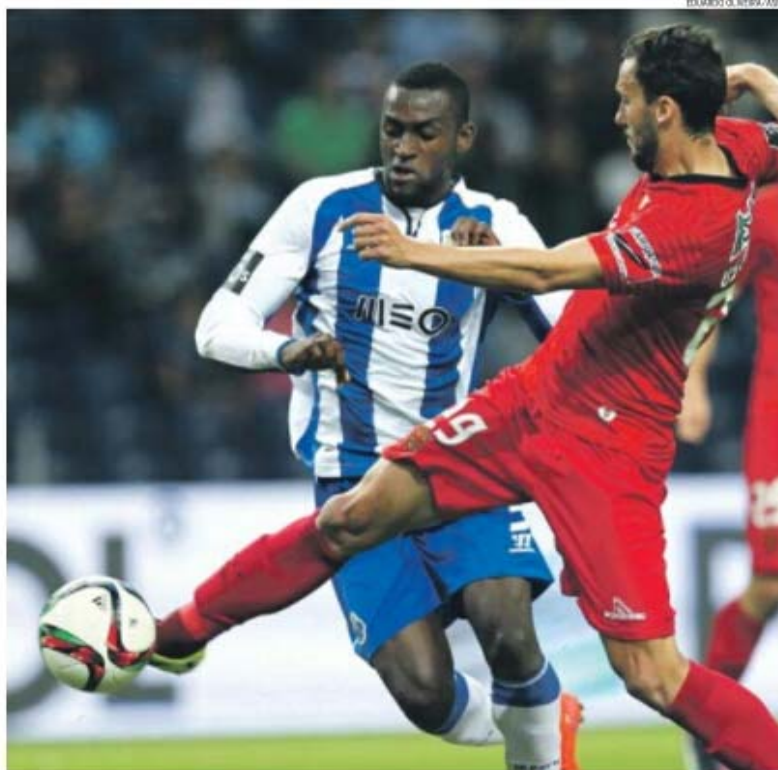
Muito rematou Jackson, mas não marcou ao Penafiel; imagem de um jogo triste para as duas equipas

O estrodo do estampanço azul e branco ouviu-se para lá do País Basco, de onde é natural o técnico contratado no verão passado, que caiu em desgraça junto dos adeptos (ontem muitos deles a comemurar de um voto de silêncio sepulcral, apenas quebrado por muitos assobios), mas que parece continuar a ter a confiança plena de Pinto da Costa, ao ponto de a permanência do espanhol no comando técnico dos dragões para lá desta época ser quase uma garantia, conforme mensagem feita passar pela SAD.