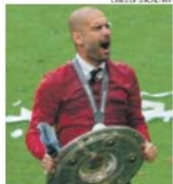
Guardiola frisou importância da Bundesliga

ga, para nós, é o mais importante. Inclusive, ganhámos muitas cervejas no fim desta temporada», brincou Guardiola.