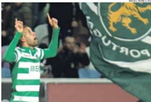
Slimani aquece em Vila do Conde: objetivo é estar a 100 por cento na final da Taça