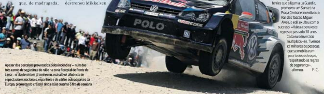
Apesar dos percalços provocados pelos incêndios - num dos três carros de segurança do rali e na zona florestal de Ponte de Lima - o dia de ontem já conheceu assinalável afluência de espectadores nacionais, espanhóis e de vários outros países da Europa, prometendo crescer ainda mais durante o fim de semana