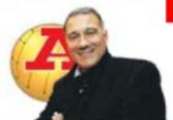
por JOSÉ EDUARDO