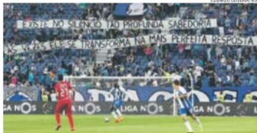
A culminar semana que incluiu pás e picaretas no Centro de Estágio do Olival, as claques do FC Porto não deixaram passar em claro o que consideram uma temporada negativa do FC Porto

Ponto final numa época que esteve longe de correr de feição, embora nunca um segundo classificado tenha feito tantos pontos, 82, como este FC Porto.