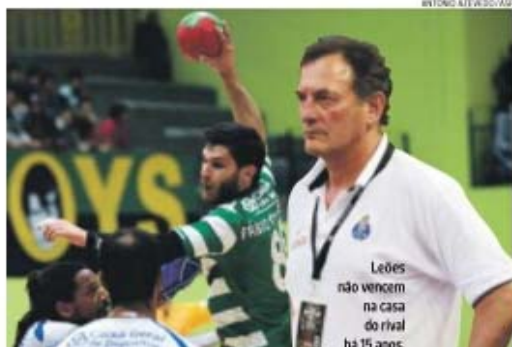
Leões não vencem na casa do rival há 15 anos. Obradovic crítico

Preparado para um jogo de emoções está Ljubomir Obradovic, técnico do FC Porto, mostrando insatisfação. «Não estou contente com a arbitragem. No terceiro jogo não foi má, foi péssima! A Federação tem de avaliar se esta fase foi pensada para o play-off despetado ou para favorecer uma equipa. Nós temos três cartões vermelhos e o Sporting nenhum. Isto não é voleibol, é uma modalidade com contacto. Uma equipa pode fazer certas coisas, outra não. No último jogo estivemos duas ou três vezes com 3 golos de vantagem e logo apareceu uma penalização — 2 minutos a um jogador