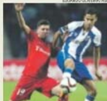
Reyes voltou à titularidade