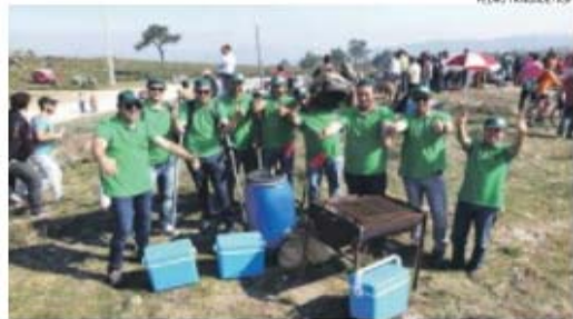
Estes dez espectadores de Barcelos fecharam a empresa onde trabalham para ver o rali