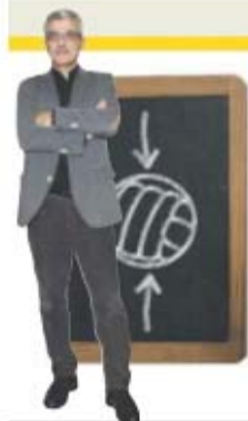
por HENRIQUE CALISTO