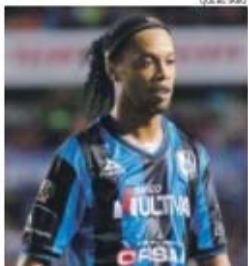
Ronaldinho não gostou de ser substituído

técnico, tendo posteriormente abandonado o local, antes do jogo terminar. Vucetich garantiu que o caso será tratado pela direção.