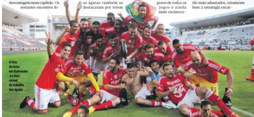
A foto da festa em Guimarães é a face visível do trabalho das águias