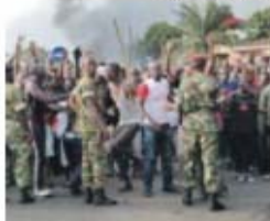
População continua descontente