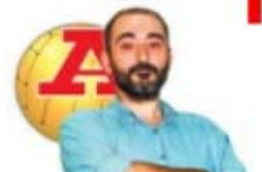
por LUÍS AFONSO