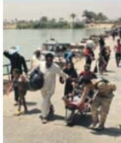
Habitantes de Ramadi fogem do EI

A ONU anunciou ontem que foram detetados cerca de três mil novos casos de cólera na Tanzânia e que o ritmo de infetados por dia é de cerca de 400, principalmente entre refugiados da violência política no Burundi. «A situação é muito séria», disse aos jornalistas o médico especialista do Alto-Comissariado das Nações Unidas para os Refugiados, Paul Sptegler.