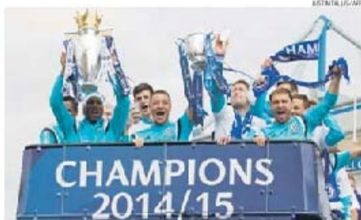
Drogba e John Terry, dos mais antigos do plantel, na frente do autocarro dos campeões

Em três autocarros (um deles para os sub-21, que venceram a Champions e a taça inglesa), jogadores, staff técnico e respetivas famílias, além do dono, Roman