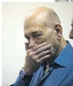
Ehud Olmert, ontem, no tribunal

O tribunal considerou que ficou provado que o antigo chefe do governo recebeu subornos do empresário de Nova Iorque, Morris Talansky, entre finais dos anos 90 e começo da década de 2000.