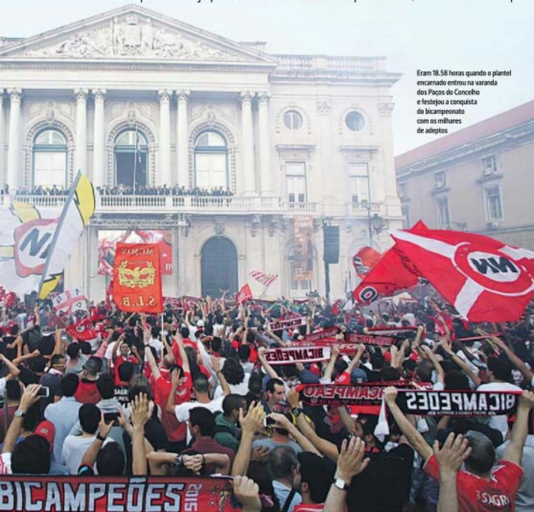
Eram 18.58 horas quando o plantel encarnado entrou na varanda dos Paços do Concelho e festejou a conquista do bicampeonato com os milhares de adeptos

Benfica recebido em apoteose na Praça do Município, em Lisboa • Milhares de adeptos celebraram o bicampeonato e já pedem 35.º título • Gritos por Luisão, Maxi... e Paulo Lopes