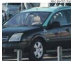
Taxi circulava na Segunda Circular

A PJ apreendeu, ontem, no aeroporto de Lisboa, um total de 6 milhões de euros. O dinheiro encontrava-se em duas malas de viagem, uma com cerca de um milhão de euros e a outra contendo três milhões e meio de yuans, o equivalente a 5 milhões de euros. Os suspeitos, um homem, de 47 anos, e uma mulher, de 22, foram detidos quando se preparavam para embarcar com destino a Xangai (China).