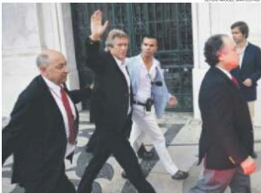
Jorge Jesus agradeceu aos adeptos, numa festa que já é habitual para o treinador