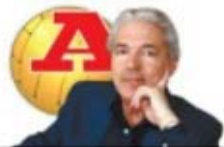
por FERNANDO GUERRA

Lopetegui esforçou-se na defesa da doutrina portista, mas no curso intensivo a que deve ter sido sujeito, aspetos houve que não lhe explicaram ou ele captou com demasiado ruído