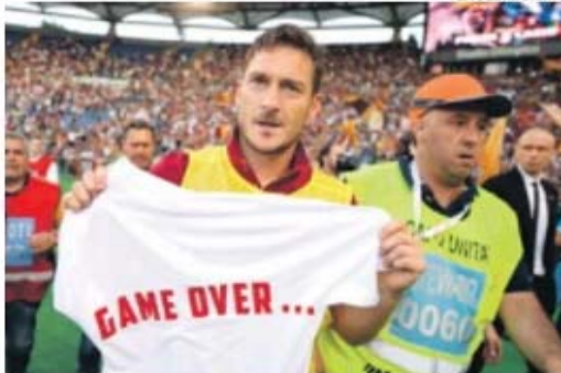
A provocação do capitão da Roma, Totti, de 38 anos, à rival Lazio: «Game over»

De Rossi foi mais longe: «Festejar, divertirmo-nos e provocar o adversário: isso que é importante! Imaginei que Iturbe e Yanga-Mbiwa iam marcar. Iturbe ainda não deu tudo o que pode dar, mas é forte e jovem. Pesa-lhe nas costas os €25 milhões que custou.»