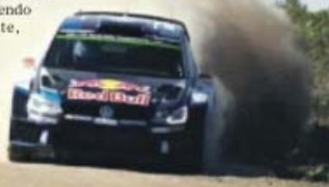
Embora tenha conquistado a vitória no Rali de Portugal, o finlandês voador do VW não teve direito a folga no dia de ontem