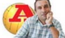
por ANTÓNIO SIMÕES