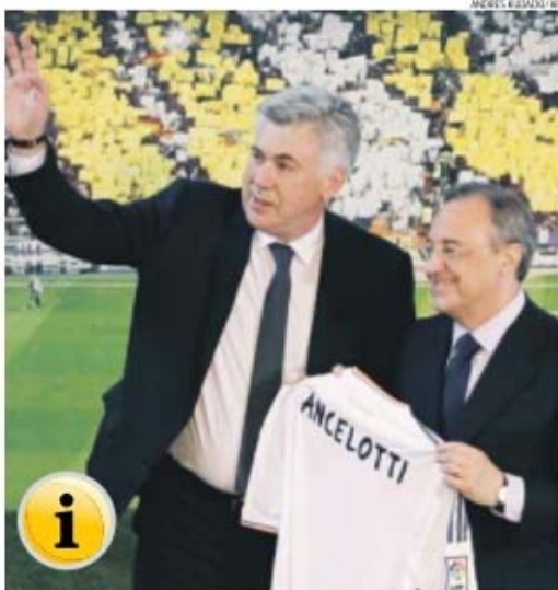
Carlo Ancelotti, 55 anos, diz adeus ao Real Madrid presidido por Florentino Pérez

Os candidatos não são muitos: os espanhóis Unai Emery (que amanhã tentará vencer a Liga Eu-