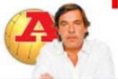
MIGUEL SOUSA TAVARES

Se querem mesmo resolver o problema, comecem a castigar tudo o que acontecer doravante, deixando de recorrer ao passado e à estafada 'verdade' de que são todos iguais