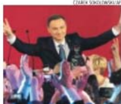
Andrzej Duda na hora de festejar a vitória

→ Alcançou, no domingo, uma vitória surpreendente na segunda volta das presidenciais