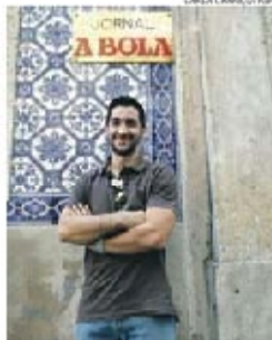
Deleza-médio voltou a visitar A BOLA

— Tanta coisa!... Sentimos que houve coisas que ficaram por vencer e algumas ficaram-nos atravessadas. Sobre tudo a Supertaça, mas também a Liga Europeia. No entanto, essas derrotas acabaram por nos vir dar maior força para conquistar o que ainda nos faltava. Não podemos ser arrogantes ao ponto de pensar que vamos conseguir sempre ganhar tudo. Não jogamos sozinho e tanto em Portugal como lá fora o hóquei em patins está de boa saúde e qualidade. Não é fácil vencer.