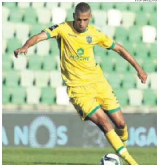
Slimani, com 14 golos, é o melhor marcador dos leões a par de Montero

po jogou nas grandes decisões da época (Ewerton é exceção pelas razões conhecidas). A saber: Rui Patrício, Cédric, Paulo Oliveira, Ewerton e Jefferson; João Mário, William Carvalho e Adrián; Carrillo, Slimani e Nani.