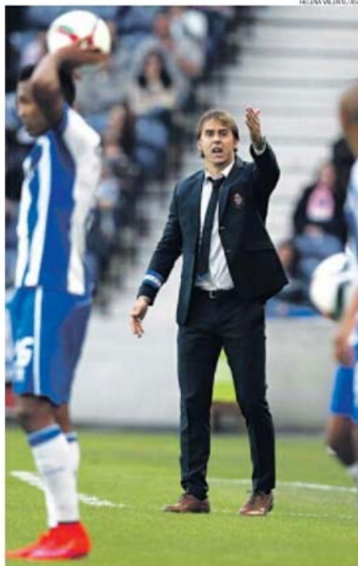
Miguel Sousa Tavares espera que Lopetegui, ficando no FC Porto, mostre muito mais

Nota — Miguel Sousa Tavares opta por escrever as suas crónicas na orthografia antiga