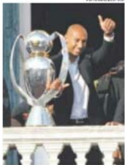
Luisão entrou na Câmara com o troféu

Entrou no Salão Nobre dos Paços do Concelho a sorrir, com o troféu de campeão nas mãos. Agradeceu o apoio e mostrou surpresa quando viu os benfiquistas a celebrarem na Praça do Município. «Não sabia que esta praça ficava tão bem assim, de vermelho», disse Luisão, ontem, à RTPV. O capitão encarnado, 34 anos, agradeceu todo o apoio.