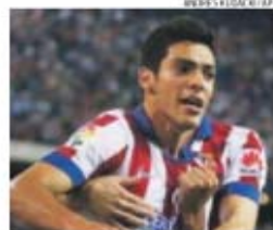
Jiménez esteve perto do FC Porto em 2014

→ Internacional mexicano de 24 anos seria cedido pelo Atlético de Madrid; agente nega hipótese