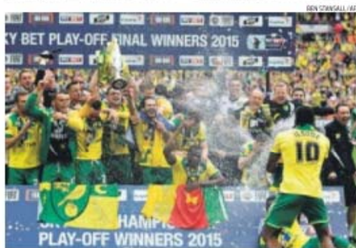
A festa dos jogadores do Norwich, após a vitória sobre o Middlesbrough, em Wembley