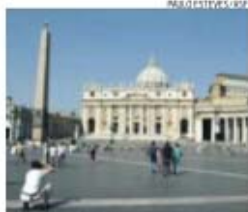
Referendo na Irlanda embaraça Vaticano

Subiu para pelo menos 500 o número de mortos, vítimas de uma onda de calor tórrida nas regiões de Andhra Pradesh e de Telangana. Segundo o The Times of India , a situação pode agravar-se. Os serviços de meteorologia preveem manutenção das altas temperaturas - têm rondado os 50 graus - nos próximos três dias.