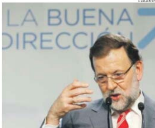
Mariano Rajoy não conseguiu passar mensagem política com total eficiência

O PP foi o partido mais votado nas regionais de domingo (municipais e autonómicas), mas perdeu todas as maiorias absolutas de que dispunha nas regiões e está agora em posição de vulnerabilidade, perante a hipótese de acordos entre os partidos de esquerda que podem afastar o poder os seus cabeças de lista. Além disso, o PP