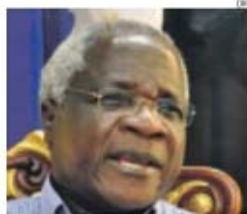
Alfonso Dhlakama, líder da Renamo

→ Líder do maior partido da oposição anuncia acordo com Presidente da República