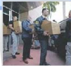
Uma carrinha da polícia suíça junto ao hotel onde se registaram detenções, em Zurique: um dos detidos tapado com um pano enquanto entra para um carro da polícia; agentes do FBI apreendem objetos na sede da CONCACAF, em Miami, EUA; seis dos arguidos: Jeffrey Webb, Jose Marin, Nicolas Leoz, Eugenio Figueredo, Jack Warner e Eduardo Li