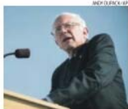
O senador Bernie Sanders