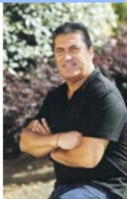
José Peseiro, 55 anos, está sem clube