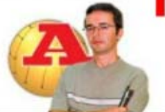
par RICARDO GALVÃO