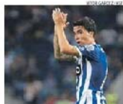
FC Porto quer cinco milhões pelo médio

→ Vice-presidente do Bursaspor não admite perder o médio; segue outra proposta para o Dragão