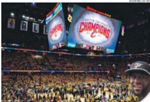
A festa na Quicken Loans Arena depois de quatro anos fora do 'play-off'

Já os Cavs chegaram à decisão do título da NBA, pela segunda ocasião em 46 anos de história, e apenas lhes resta esperar pelo campeão de Oeste, onde os Warriors lideram por 3-1 face aos Rockets. Os Finals arrancam a 4 de junho. Descanso precioso para James (problemas nas costas e joelho esquerdo) e sobretudo para Kyrie Irving (torção do joelho e joelho esquerdo), que, após ausência nas duas últimas partidas, regressou à ação com 16 pontos, 4 ressaltos e 5 assistências em 22 minutos.