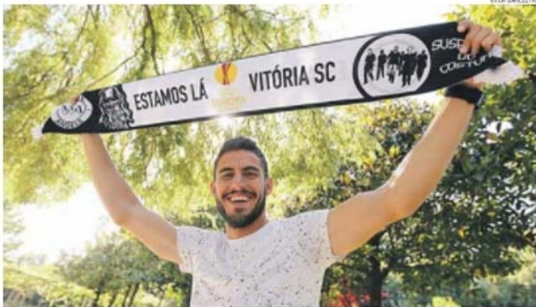
Chegou a ter contrato assinado com o SC Braga, mas não guarda memórias dessa curta passagem. No Vitória, sim, já tem o que contar...