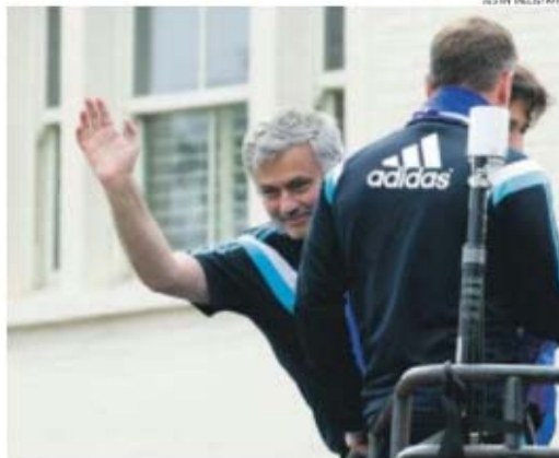
José Mourinho, 52 anos, deu um 'show' para os adeptos do Chelsea

Seguiu-se o Man. City, que pretendia «jogar com uma baliza só». «Foram fantásticos. Marcaram muitos golos e nunca concederam