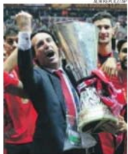
Mais uma, diz Emery, técnico vencedor

→ Treinador do Sevilla emocionado; famílias viajaram para a capital polaca