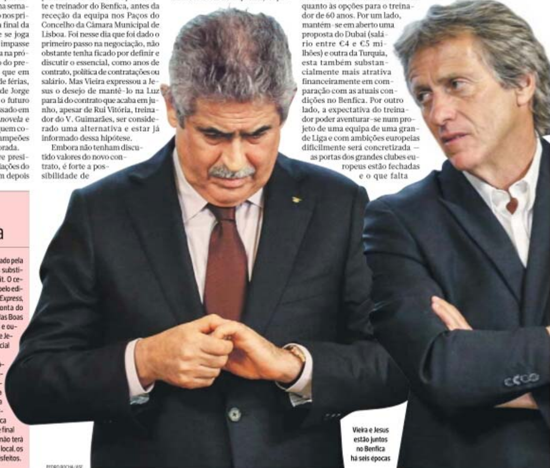
Vieira e Jesus estão juntos no Benfica há seis épocas

Neste momento, essa hipótese não passa de especulação. Villas Boas conduziu o Zenit ao título de campeão da Rússia, mas o falhanço na Liga dos Campeões (ficou em terceiro lugar no grupo do Benfica e foi eliminado nos quartos de final da Liga Europa pelo Sevilla) não terá deixado, segundo a imprensa local, os dirigentes do Zenit muito satisfeitos.