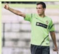
Podstawski só pensa em Portugal

«Já entramos em contacto comigo, apesar de me sentir português. O meu pai é polaco, a minha mãe é portuguesa, e eu sinto-me português», diz o médio do FC Porto B, nascido na pátria de Camões. «Não desistiram e de certeza que vão