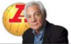
par SANTOS NEVES