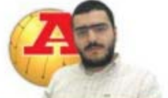
par HUGO VASCONCELOS

“ Foi um dia memorável. E teve um sabor especial, é claro, por ser contra um eterno rival para mim, já que joguei no Sporting e no FC Porto BETO sobre a final da liga Europa contra o sevilha, setembro de 2004