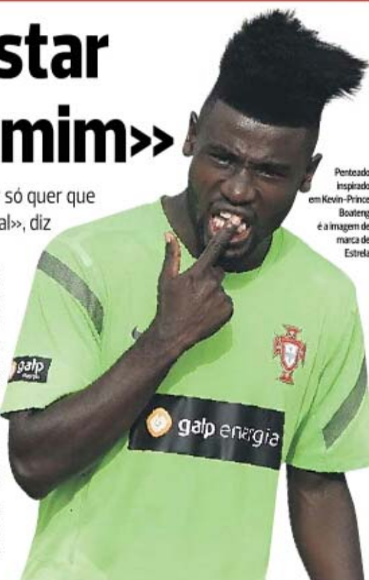
Penteado inspirado em Kevin-Prince Boateng é a imagem de marca de Estrela

— Guardo bons momentos, foi um clube que me abriu as portas, uma casa à qual tenho de estar grato toda a minha vida, é o meu clube do coração.