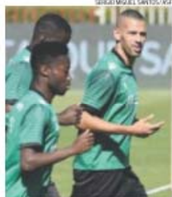
Mané tem contrato até 2018