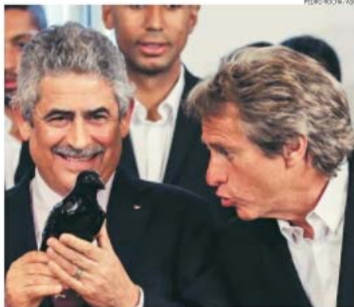
Jesus e Vieira restituiram ao Benfica a identidade combativa, empolgante e ganhadora

Por algum lado se tem de começar, não é? No caso do Benfica, começou-se pela Taça da Liga que é troféu nacional e oficial e, por isso mesmo, entra na contabilidade dos títulos conquistados.