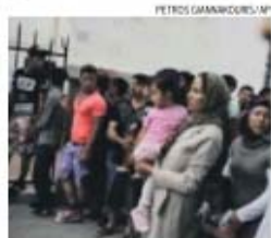
Migrantes serão divididos por vários países

→ Bruxelas propõe que estados-membros recebam 40 mil migrantes da Síria e Eritreia