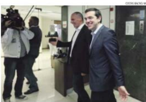
O PM grego, Alex Tsipras, foi hoje recebido pelo ministro das Finanças, Yanis Varoufakis

do a mesma fonte de Atenas, inclui uma reforma do IVA e metas de saldo orçamental primário (sem