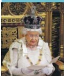
Isabel II lê o discurso no parlamento

Os pormenores da lei serão oficialmente apresentados aos deputados hoje, à exceção da data exata do referendo.