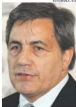
Fernando Gomes, presidente da FPF

Os custos com a arbitragem permanecerão nos 5,6 milhões de euros enquanto que o novo formato da Taça de Portugal, o apuramento para o Mundial de Futsal, a Final Eight da Taça de Portugal de Futsal e a Taça da Liga de Futsal, contribuirão para o aumento das despesas com provas oficiais.