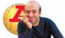
par JOÃO BONZINHO