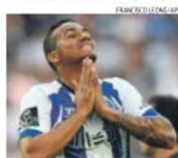
Brasileiro despediu-se do Dragão em alta

→ Rumo a Madrid, lateral-direito construiu, marcou e garantiu 1.º triunfo semanal em Portugal