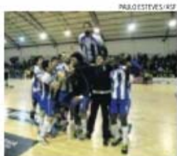
FC Porto conquistou a última Supertaça

Castelo Branco vai receber a 29 e 30 de agosto o início oficial da temporada 2015/16 com a realização das Supertaças masculina e feminina. A cidade já foi o palco de duas finais da Taça de Portugal masculina, em 1983/84, com a vitória do Belenenses sobre o Benfica, e 20 anos depois, em 2003/04 com o sucesso do Sporting sobre os azuis do Restelo. O distrito albergou também a Supertaça feminina 2002/03, na qual a Madeira SAD bateu o GI Eanes por 26-23, em Penamacor, e ainda a final da Taça de Portugal da mesma temporada, com as madeirenses a vencerem novamente as algarvias mas por 26-21, no Fundão. E se a Supertaça masculina está já definida, com o heptacampeão FC Porto a medir forças com o ABC, vencedor da Taça de Portugal, a prova feminina só será conhecida este fim de semana: a Madeira SAD tem já lugar garantido após conquistar a prova ninha em Loulé. Contudo, as madeirenses estão na final do campeonato feminino diante do Alvarium. Se as avelanenses conquistarem o título, então serão estas a jogarem com as insulares. Mas se a SAD se sagrar campeã, então é o IAC - Aicanena, derrotado na final da Taça, o oponente da Madeira SAD. H.C.