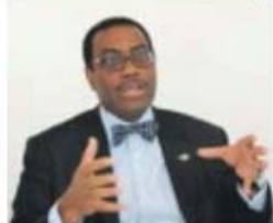
Adesina e o novo presidente do BAD