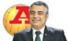
par JOSÉ COUCEIRO