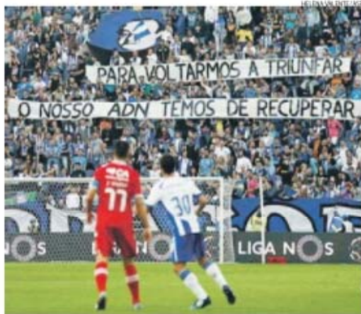
«Seremos mais portistas, se ganharmos, e menos, se perdermos?»

tenha de recordar outro campeonato como o de 1977, porque apesar de ter sido o que mais celebri é o que me faz lembrar o que pode acontecer se vacilarmos como vacilámos durante um longo período, o que me recorda o que pode acontecer se não exigirmos o que temos de exigir, o que temos de guardar na memória para percebermos que jamais podemos deixar a gente que nos quer derubar sem resposta.