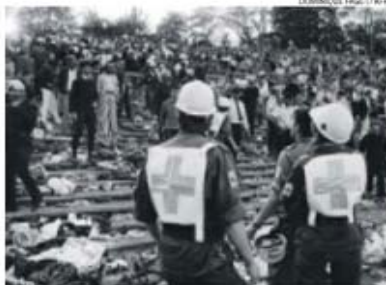
Equipes médicas demoraram muito tempo a socorrer as vítimas