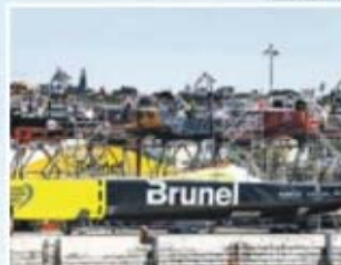
Porto de Lisboa quer ser a oficina de reparações da Volvo Ocean Race, onde os veleiros farão quatro inspeções por ano