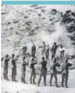
Italianos vítimas do terror nazi