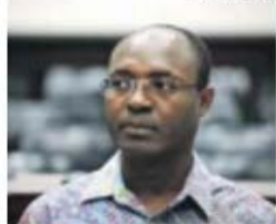
O jornalista Rafael Marques

O tribunal provincial de Luanda condenou Rafael Marques a seis meses de prisão com pena suspensa, no processo de difamação sobre a violação dos direitos humanos na exploração de minas, apesar de um acordo estabelecido com os sete generais queixosos, na semana passada. O ativista estava em tribunal por ter exposto alegados abusos dos direitos humanos com a publicação do livro Diamantes de Sangue: Tortura e Corrupção em Angola . O advogado de defesa do jornalista interpôs recurso à sentença, que considera «nula» por várias irregularidades.