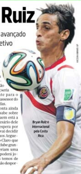
Bryan Ruiz e Internacional pela Costa Rica