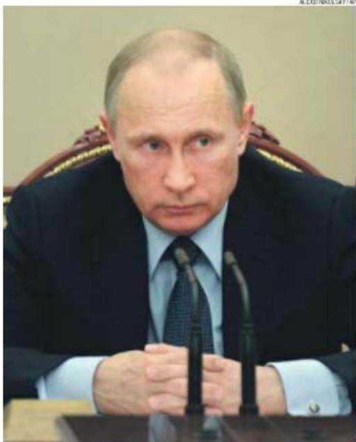
Presidente da Rússia, Vladimir Putin, considera que há ingerência dos Estados Unidos

Ao lado do homem que adjudicou o Mundial de 2018 na Rússia — também a atribuição do Campeonato do mundo de 2022 ao Catar está a ser investigada —, Putin continuou o ataque aos EUA: «Querem impor a sua jurisdição noutros países. Se calhar algum deles [referindo-se aos dirigentes detidos] violou alguma lei, mas os Estados Unidos não têm nada a ver com isso. Estes dirigentes não são cidadãos norte-americanos. E se algo aconteceu, não aconteceu em ter-