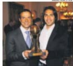
Futuro de Falcao passa por Jorge Mendes

Que futuro para Radamel Falcao? O avançado, 29 anos, após época para esquecer no Manchester United, por empréstimo do Mónaco, não deve prosseguir a carreira no Principado. O Superdeporte, jornal de Valência sempre bem informado sobre a atualidade che, noticiou ontem que o antigo goleador do FC Porto pode jogar sob as ordens de Nuno Espírito Santo na próxima época. O