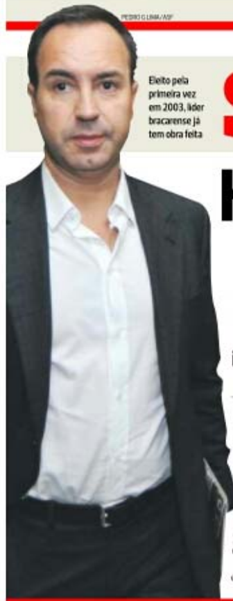
Eleito pela primeira vez em 2003, líder bracarense já tem obra feita