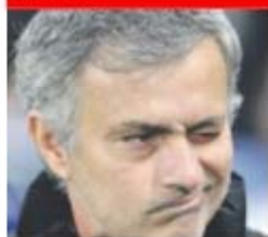
José Mourinho, 52 anos