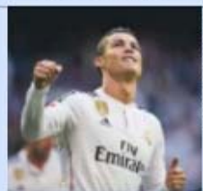
Ronaldo está no Real desde 2009