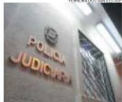
PI desindou mais um caso de burla qualificada