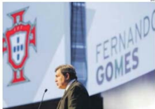
Presidente da FPF, Fernando Gomes, devere votar no jordano Ali Bin Al-Husseini

marca o último dia (início às 8.30 horas portuguesas) do 65.º Congresso da FIFA, em Zurique. Em boletim secreto, as 209 federações (cada uma com um voto) distribuídas por Europa (53), África (54), Ásia (46), América do Norte, Central e Caraíbas (35), Oceânia (11) e América do Sul (10) vão eleger o presidente para os próximos quatro anos, eleição que termina à primeira se o vencedor somar 2/3 dos votos. Caso contrário, realizar-se-á uma 2.ª volta em maioria simples, ou seja, mais de 50 por cento dos votos.