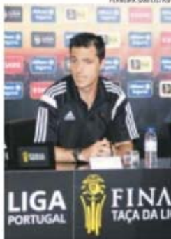
Xistra já apitou a final da Taça de Portugal

— São ações importantíssimas nas vidas das instituições e o Marítimo preocupa-se com os jovens. Dar estas alegrias às crianças é muito mais importante do que um simples jogo de futebol.