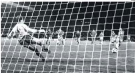
O momento em que Michel Platini engana, de 'penalty', o guarda-linha do Liverpool, Grobbelaar