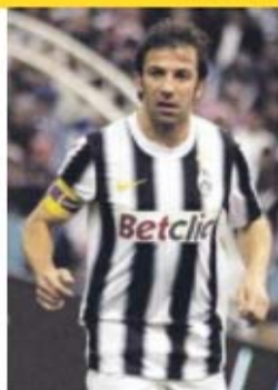
Decisão de Del Piero por respeito às vítimas

«As negociações com o Sydney já estavam adiantadas quando o Liverpool fez uma proposta, mas, então, pensei no que aconteceu em Heysel. Juventus e Liverpool foram capazes de reatar as relações, mas aquela tragédia ficará para sempre nas nossas memórias», frisou Del Piero, que, ao serviço dos bianconeri, ganhou oito campeonatos, quatro Supercups, 1 Taça, 1 Liga dos Campeões, 1 Supercopa europeia, 1 Taça Intercontinental e 1 Taça Intertoto.