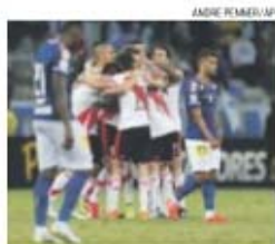
Festa do River em mais um 'Mineirão'

→ Argentinos ganham em Belo Horizonte, por 3-0, após terem perdido 0-1 em Buenos Aires