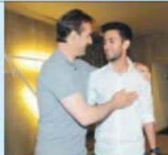
Bueno assinou pelo FC Porto esta semana

«No futebol tentas absorver o que cada um tem para te ensinar e a mim Lopetegui ensinou-me muito. Ensinou-me a ser profissional e a saber o que era uma equipa de elite. Também melhorou os meus conceitos desportivos e foi com ele que dei o salto para ser um futebolis-