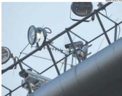
Finalmente a nova tecnologia de baliza vai ser utilizada numa prova oficial

De entre os jogadores encarnados há um que, curiosamente, já