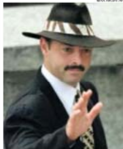
Bruce Grobbelaar vive hoje no Canadá

«Em Heysel, há uma placa, uma data, os nomes das vítimas, mas a Bélgica podia fazer mais pelas famílias dos adeptos italianos que morreram. E seria maravilhoso que a Juventus e o Liverpool disputassem um jogo todos os anos para sentirem-se mais unidos pela tragédia. Voltei a todos os lugares onde vivi tormentos, no sentido de lidar e exorcizar os fantasmas. Agora, já não tenho pesadelos, estou em paz», concluiu Bruce Grobbelaar, de 57 anos, que atualmente vive no Canadá e é treinador de guarda-redes do clube Ottawa Fury.