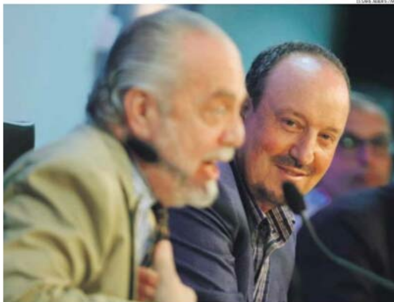
A Aurelio de Laurentiis, presidente do Nápoles, só faltou dizer, ontem, que Rafael Benítez, de saída do clube italiano, vai mesmo para o Real

«O meu ciclo no Nápoles chegou ao fim. Quero agradecer ao presidente e a todos os adeptos. É sempre triste deixar um sítio onde nos estimam», declarou Benítez, que, depois de amanhã, decide em duelo em casa diante da Lazio a presença do Nápoles no play-off de acesso à Liga dos Campeões através do terceiro lugar na Série A (romanos ocupam essa posição com três pontos de vantagem): «Queremos ganhar no domingo para terminar a temporada em beleza. O mais importante agora é a Lazio. Depois, darei o máximo a partir de segunda-feira no clube para onde for.»