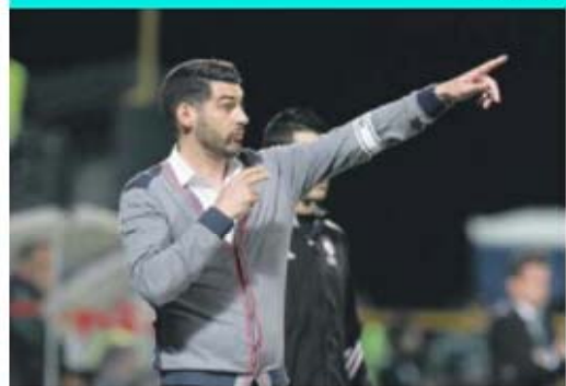
Pacenses começam a prevenir-se para a eventualidade de Paulo Fonseca sair