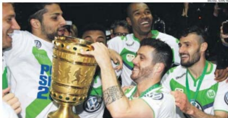
A felicidade de Vieirainha, a segurar o troféu, depois de ter ganho a primeira taça na carreira numa época de sonho ao serviço do Wolfsburg

Lobos erguem pela primeira vez o troféu. No adeus ao Dortmund Jurgen Klopp ainda sonhou (Aubameyang fez 1-0) mas levou três socos