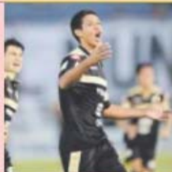
Benfica volta ao mercado paraguaio