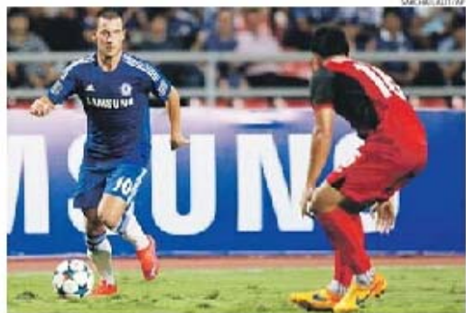
Eden Hazard foi dos jogadores que mais curiosidade despertaram em Banguecoque