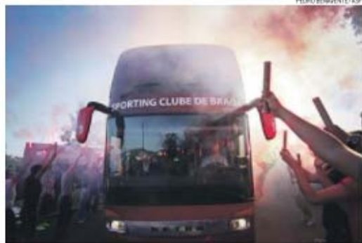
SC Braga não terá falta de apoio no Jamor, tal é o entusiasmo dos adeptos

150 autocarros percorrem a A1 rumo ao Jamor • Apoio em peso da Cidade dos Arcebispos