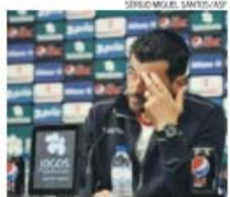
Técnico quer ganhar a Taça para os adeptos