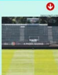
Relvado será constantemente regado