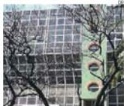
Imagem exterior do CC das Olaias

Um incêndio que deflagrou, ontem, num apartamento na rua Elísio de Moura, em Braga, foi fatal para um agente da PSP reformado. O homem, de 83 anos, vivo e a viver sozinho, não terá resistido ao muito fumo inalado, mas fonte da Proteção Civil adiantou à Lusa que a vítima poderá ter sofrido um ataque cardíaco.