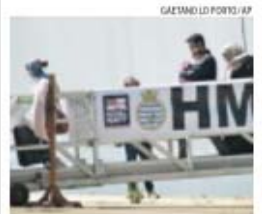
Alguns arriscam a vida dos próprios filhos

O Salvamento Marítimo espanhol resgatou, ontem, no Mediterrâneo, 29 pessoas (19 homens, nove mulheres e duas crianças) que se encontravam numa embarcação à deriva, 15 milhas a noroeste da ilha de Alborán. Os naufragos, cuja nacionalidade não foi revelada, foram transportados para Almería.