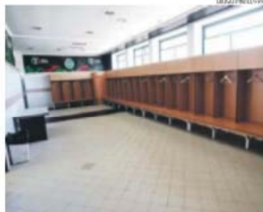
O balneário que espera os jogadores do Sporting