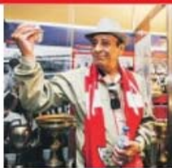
Perrichon é um dos heróis bracarense