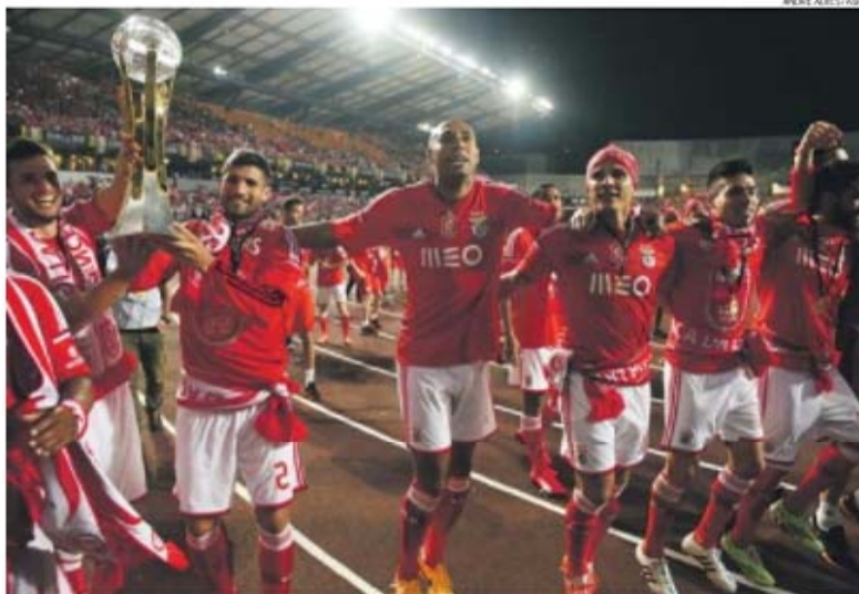
Benfica venceu em Coimbra a Taça da Liga e fez nova festa numa temporada em que os benfiquistas sorriem em várias modalidades