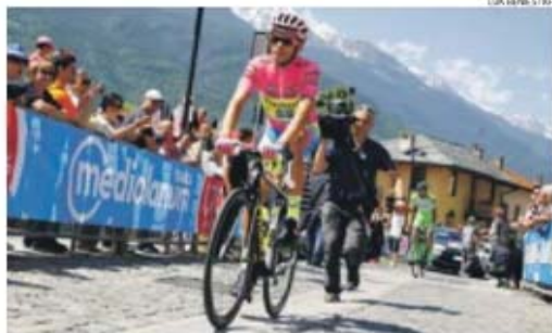
Mesmo 'despido' da camisola rosa em 2011 por 'doping', Contador volta a brilhar na Itália

«Foi um dia duro e não tive boas sensações. A Astana esteve muito forte em Finestre e paguei o esforço dos dias anteriores. Sabia que tinha