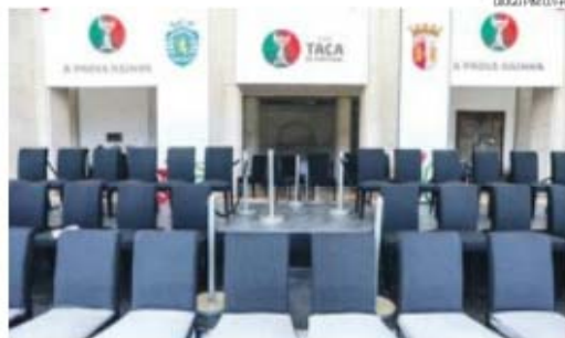
A tribuna de honra já 'vestida' a rigor