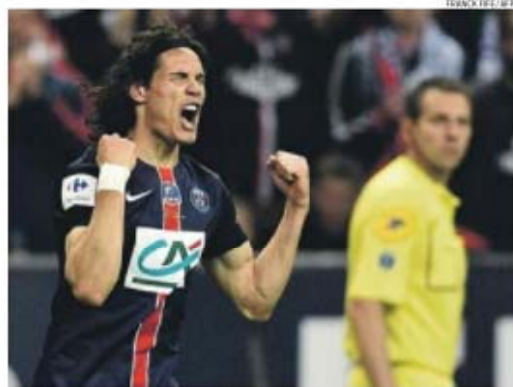
Cavani marcou de cabeça golo que derrotou o Auxerre e ofereceu quarto título da época ao PSG