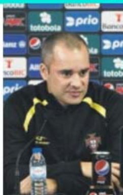
A PROVA RAINHA

Apesar de muitos focos estarem sobre si hoje, o juiz da AF Madeira garantiu que nada alterou em termos de plano de preparação. «Como árbitros, a nossa responsabilidade é igual. Não é por ser uma final que vamos alterar o que quer que seja. A preparação para este jogo foi idêntica e não senti maior pressão. Não gosto de sair da minha zona de con-