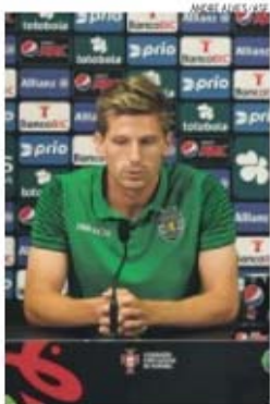
Igualar FC Porto

“ Este ambiente à volta desta grande competição, que envolve muitas equipas... Estar aqui é um sonho que está bem presente, bem como o de conseguirmos estar nesta grande festa