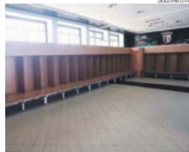
Os jogadores do SC Braga terão todas as regalias no balneário