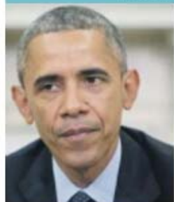
Lei das escutas preocupa Barack Obama