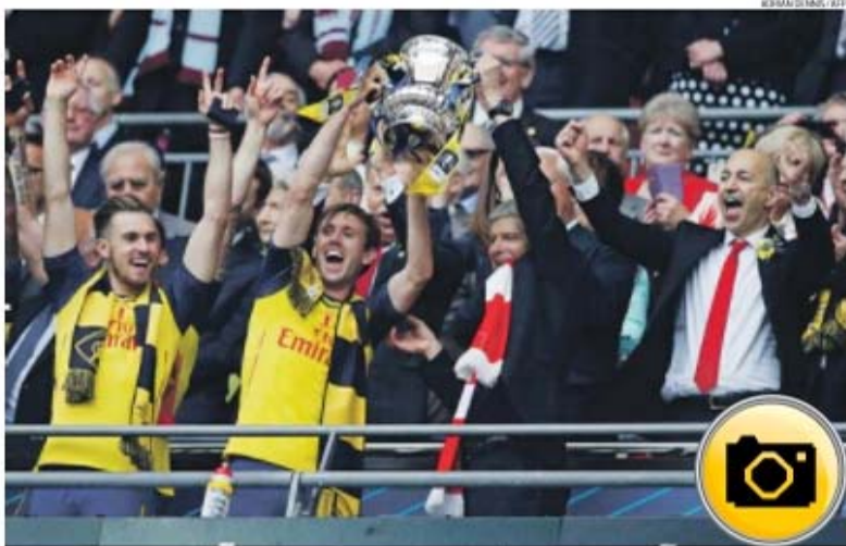
Festa dos jogadores do Arsenal (no caso concreto com Morreal a segurar no troféu) e do treinador, o francês de 65 anos Arsène Wenger

osas 1-0, por Walcott (40); 2-0, por Alexis Sánchez (50); 3-0, por Mertsecker (62); 4-0, por Giroud (90+3) DISCIPLINA: Cartão amarelo a Cleverley (34), Hutton (33), Delph (38), Westwood (52) e Agbonlahor (82)