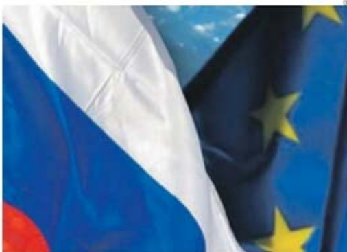
As relações entre a Rússia e a União Europeia já tiveram melhores dias

Segundo um porta-voz da comissão para a política externa da UE, além de uma lista (já batizada de 'negra') com nomes, «não é fornecida qualquer informação sobre os fundamentos jurídicos, os critérios e o processo que conduziu a esta decisão».