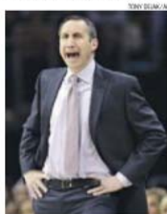
Blatt foi ao 'draft' de 1981 e não foi escolhido