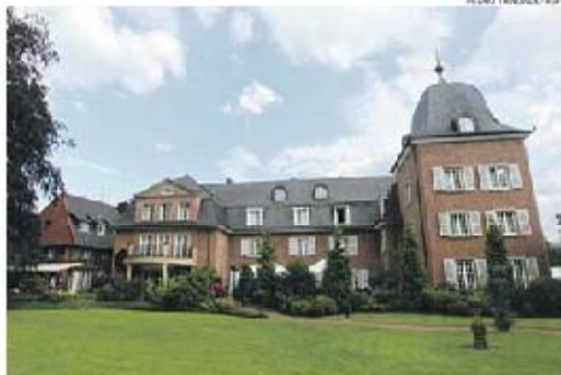
Marienfeld é local de boas recordações para os portistas