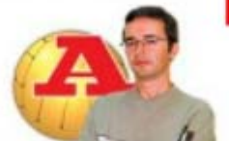
par RICARDO GALVÃO