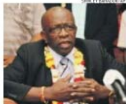
Jack Warner, antigo 'vice' da FIFA

→ Mais quatro pessoas na lista negra; governos têm ordens para prendê-los e extraditá-los