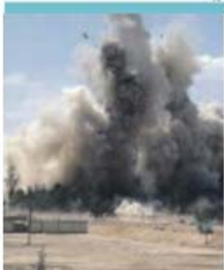
El tem espalhado terror na Síria e no Iraque

«Temos visto enormes perdas para o EI e isto vai acabar por ter um impacto», declarou, numa entrevista à rádio France Inter. Blinken salientou que depois de cerca de quatro mil ataques aéreos o EI controla agora «menos 25 por cento do Iraque, tendo muito do seu equipamento sido destruído». No entanto, o número dois da diplomacia dos EUA admitiu que se trata de um grupo com «resistência e capacidade de iniciativa».