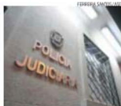
Suspeito abusava sexualmente de menor

Um imigrante brasileiro, de 32 anos, foi condenado pelo Tribunal de Évora à pena máxima de 25 anos de prisão. O arguido estava acusado de ter matado a namorada, de 27 anos, a mouro e pontapé, em maio de 2014.