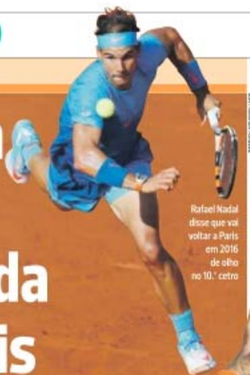
Rafael Nadal disse que vai voltar a Paris em 2016 de olho no 10.º cetro

bater o também espanhol David Ferrer por 7/6 (7-4), 6/2, 5/7 e 6/1. Mais fácil parece ser o percurso de Serena Williams. Campeã em 2002 e 2013, reforçou o estatuto de principal candidata ao 3.º cetro em Paris. Vencedora (6/1 e 6/3) da italiana Sara Errani (17.ª), a norte-americana defronta hoje a suíça Timea Bacsinszky (24.ª) que, por sua vez, levou a melhor (6/4 e 7/5) sobre a belga Alison van Uytvanck (93.ª).