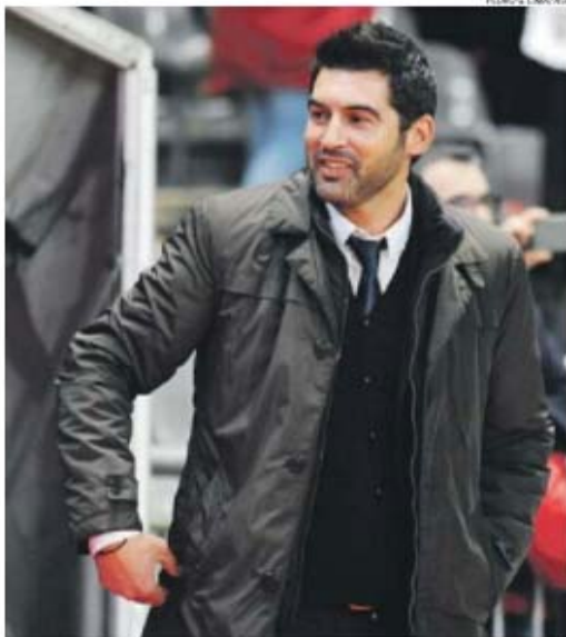
Paulo Fonseca treinará o terceiro clube na Liga, depois de FC Porto e Paços de Ferreira

No SC Braga, Paulo Fonseca terá à disposição meios financeiros mais poderosos para contratar jogadores e, assim, construir um plantel forte para as frentes nacionais. Terá, ainda, o desafio de poder competir na Liga Europa, com os minhotos a entrarem diretamente na fase de grupos. A experiência de Paulo Fonseca no FC Porto fez dele um técnico mais conhecedor de uma realidade que é a exigida por António Salvador. E na segunda passagem pelo Paços de Ferreira, com um grupo bastante limitado, recuperou a imagem de treinador competente, colocando o emblema pacense a lutar até à última jornada pela segunda presença na competição da UEFA.