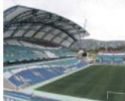
Estádio do Algarve acolhe Supertaça

A Supertaça Cândido de Oliveira, que irá opor o Benfica ao Sporting, a 9 de agosto, no primeiro jogo oficial da nova época — embora represente um troféu relativo a 2014/2015 —, vai ser disputada no Estádio Algarve, em Faro/Loulé. Nos últimos anos o troféu conheceu como casa anfitriã o Municipal de Aveiro, precisamente desde 2009, mas a atual realidade do futebol do Beira-Mar, em crise, bem como a ausência de outros apoios, designadamente materiais, por parte dos organizadores, fez com que a FPF optasse pelo Algarve. O anúncio oficial será feito brevemente. J. A.