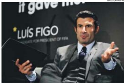
Luis Figo, 42 anos, prefere esperar para decidir se avança para nova candidatura

«Considero que, agora, é o momento para refletir algum tempo no que aconteceu. Sei da responsabilidade que tenho neste processo e quando for oportuno decidirei se direi presente outra vez às eleições ou não», acrescentou.