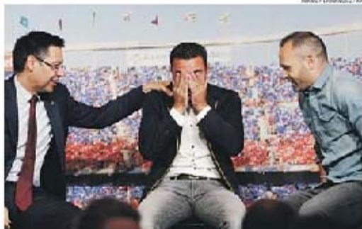
Josep Maria Bartomeu e Iniesta confortam Xavi, que está de saída dos blaugrana

O avançado da Juventus, Carlos Tevez, vencedor da Champions pelo Manchester United em 2008, elogiou, em entrevista concedida ao site da UEFA, o Barcelona: «É a melhor equipa do mundo. O nosso desempenho terá que ser mais que perfeito». No treino de ontem da equipa italiana, Giorgio Chiellini apresentou lesão no gêmeo esquerdo e será hoje submetido a exames médicos para saber a sua condição física.