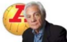
par SANTOS NEVES