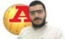
par HUGO VASCONCELOS

“E todos querem, regateiam, Amarguras, ilusões, Trapos e cacos e contradições” SERGIO GODINHO na cação “1ª terça-feira”