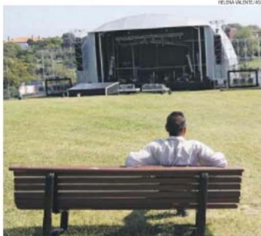
Os palcos do NOS Primavera Sound já ontem estavam montados no Parque da Cidade

De Patti Smith, qual papisa do rock e do punk, a que os longos e esbranquiçados cabelos ajudam a reforçar a aura de figura icónica do som mais alternativo proveniente das Américas, aos Interpol; de Antony and The Johnsons aos Belle and Sebastian, sem esquecer os ingleses Ride, mestres do shoegazing , movimento que na década de 1990 era venerado em terras de Sua Majestade e tudo à volta, os os inefáveis Underworld, que se encarregarão de interpretar