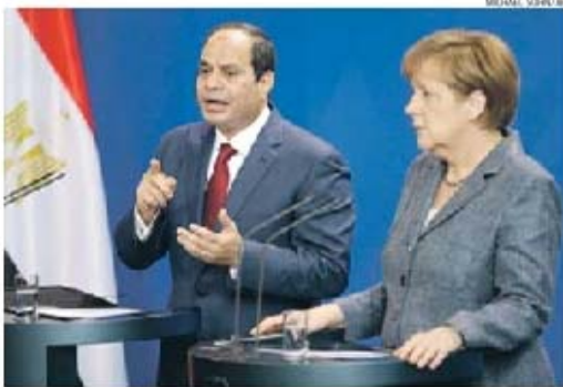
Al-Sissi, presidente do Egito, ao lado da chanceler germânica, Angela Merkel, em Berlim

Numa conferência conjunta, a líder do governo germânico teve algumas críticas ao sistema judicial do Egito, condenando a aplicação da pena capital. «A Alemanha não admite a pena de morte em circunstância alguma», mesmo tratando-se de «atividades terro-