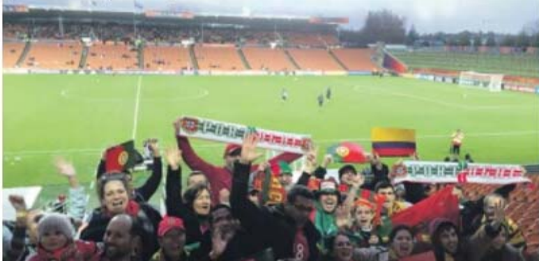
Nas bancadas cerca de três dezenas de vozes gritaram bem alto pela equipa portuguesa; o apoio tem sido uma constante

Lusofonia unida no apoio a Portugal • Jogos da equipa das quinas têm permitido a aproximação da comunidade lusitana na Nova Zelândia