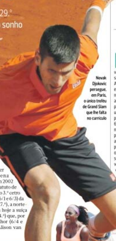
Novak Djokovic persegue, em Paris, o único troféu de Grand Slam que lhe falta no currículo