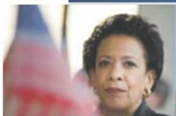
A procuradora dos EUA, Loretta Lynch

Um dia depois de ter anunciado a intenção de se demitir, Joseph Blatter regressou ontem ao