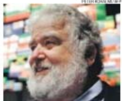
Chuck Blazer, o 'garganta funda'

→ Antigo membro do Comité Executivo confessa ilegalidades relativas aos Mundiais de 1998 e 2010