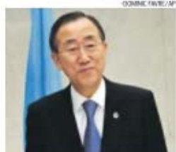
Ban Ki-moon, secretário-geral da ONU

→ Ban Ki-moon admite investigar denúncias de agressões na República Centro-Africana