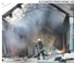
Confrontos voltam a ascender no leste