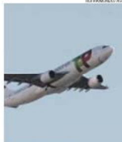
Futuro da transportadora nacional em jogo

Ainda hoje, em Conselho de Ministros, o executivo deverá aprovar a resolução fundamentada, que invoca o interesse público da privatização, para que amanhã, às 17 horas, sejam entregues