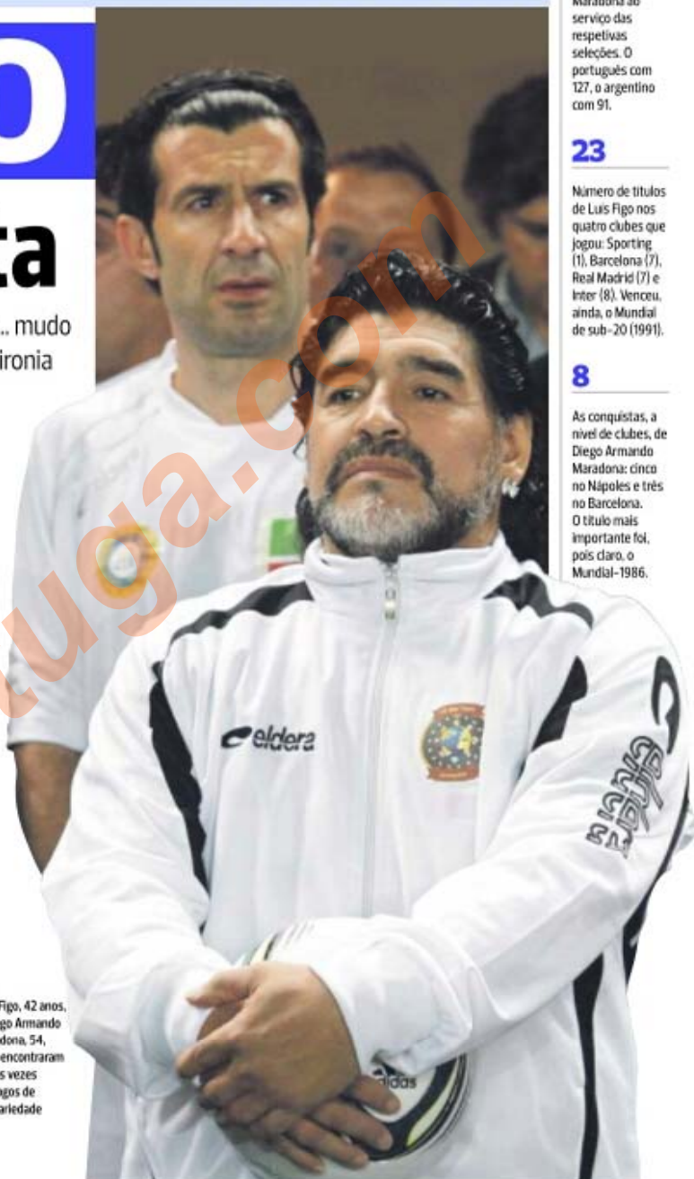
Luis Figo, 42 anos, e Diego Armando Maradona, 54, já se encontraram várias vezes em jogos de solidariedade