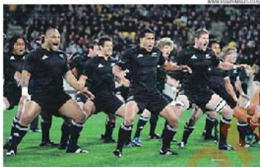
A seleção da Nova Zelândia num momento em que pratica a célebre dança de guerra

O som ambiente não podia ser melhor, um vibrante relato radiofónico bem antigo de um jogo dos All Blacks acompanha-nos por entre vários artigos históricos, entre eles alguns dos primeiros equipamentos da mítica seleção nacional de rúgbi da Nova Zelândia. E a dada altura é possível ver abordado o mito sobre a origem do nome All Blacks. Reza a história (ou a lenda) que o primeiro repórter que escreveu sobre a equipa em