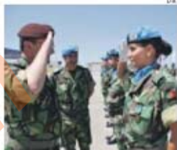
Ausência será forma de mostrar desagrado

→ Associações de militares recusaram-se a estar presentes nas celebrações do Dia de Portugal