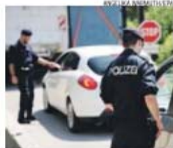
Reunião sob apertado controlo da polícia

→ Ex-presidente da Comissão Europeia, Durão Barroso, vai render Francisco Pinto Balsemão