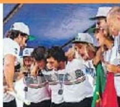
Seleção festejou no pódio de Popoyo