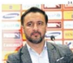
Vitor Pereira vai trocar Atenas por Istambul

→ Técnico tem princípio de acordo com o clube turco e ainda esta semana será apresentado