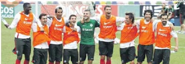
Alegria da equipa de Ronaldo, que venceu a 'peladilha' durante o treino de ontem

Mas para prevenir quaisquer interpretações erradas, Fernando Santos já afirmou, na conferência de imprensa de divulgação dos convocados, que foi «muito bem recebido» pelos dirigentes armênios.