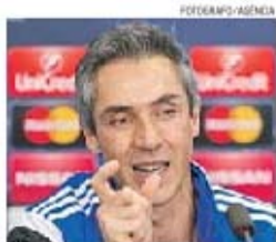
Paulo Sousa, 44 anos, técnico do Basileia

→ Paulo Sousa garante estar focado na Basileia, apesar do interesse de outros clubes