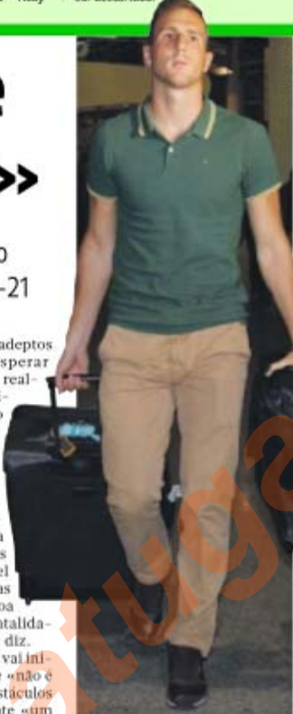
Oblak destaca qualidades do compatriota