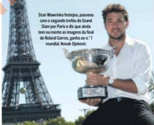
Stan Wawrinka festejou, passou com o segundo troféu do Grand Slam por Paris e diz que ainda tem na mente as imagens da final de Roland Garros, ganha ao n.º 1 mundial, Novak Djokovic