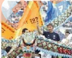
Dança do Dragão faz parte do espetáculo

feira de apresentação aos sócios e adeptos no Estádio do Dragão. Os italianos devem assim suceder aos franceses do Saint-Étienne, num jogo que contará com o habitual espetáculo de apresentação do plantel.