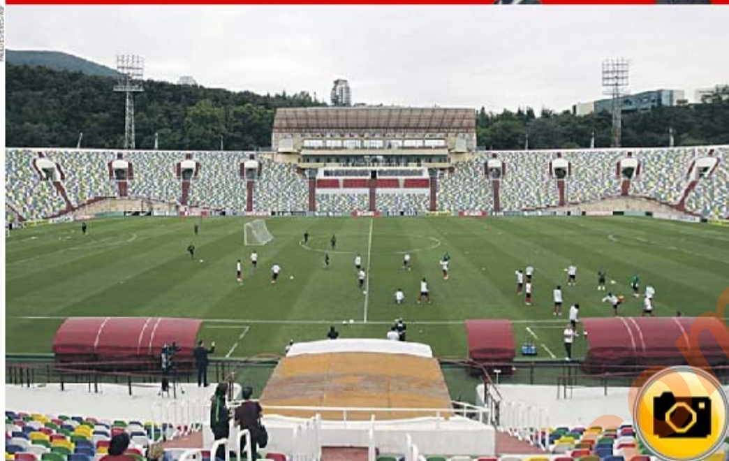
A Seleção Nacional encontrou na Geórgia as condições ideais para trabalhar: perto de Erevan, mas longe dos olhares armênios