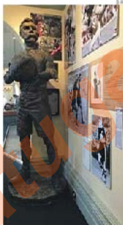
Exposição sobre rúgbi em Dunedin