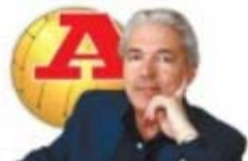
PAR FERNANDO GUERRA

Não é crime Jesus ir atrás do dinheiro, mas sabia que, ao optar pelo Sporting, incomodava o presidente que o tirou do anonimato e feria o orgulho de muitos milhares de benfiquistas