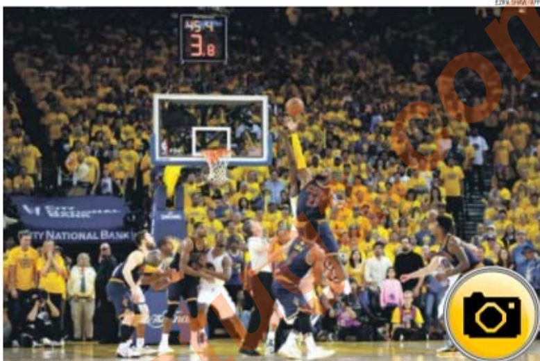
LeBron James esteve em campo 50 minutos, tempo suficiente para marcar 39 pontos, fazer 11 assistências e ganhar 16 ressaltos