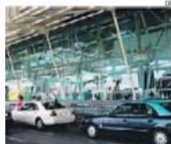
'Correio' de droga foi apanhado em Lisboa

Um homem, com idade a rondar os 50 anos, morreu, ontem, na sequência de uma explosão num posto de transformação subterrâneo de eletricidade, em Lisboa. O acidente, que ocorreu na Avenida António Serpa, junto ao número 23, provocou ainda um apagão na zona.