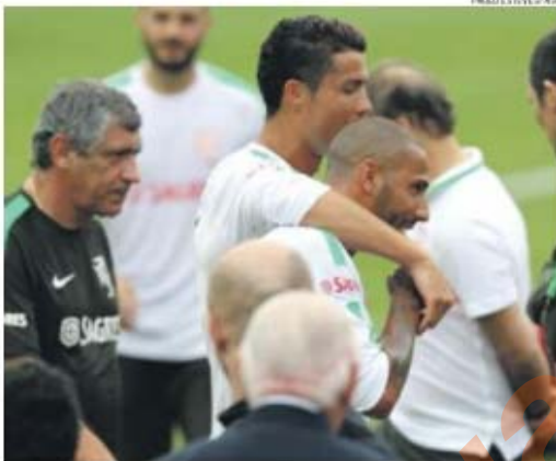
Ronaldo e Quaresma revelaram sintonia no treino, deseja-se que seja assim na Arménia

Não podemos dizer qual a real intenção do madeirense em deixar esta mensagem, mas a verdade é que RQ7 voltou a ser fundamental na Seleção. Basta lembrar que foi ele a dar a assis-