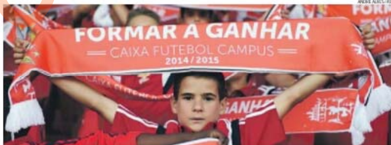
Aos jovens formados no Seixal, Luis Filipe Vieira deixou mensagem de confiança para o futuro

Luis Filipe Vieira dedicou parte do dia à formação • Garante cinco jovens 'made in' Seixal no próximo plantel • Nomes estão definidos