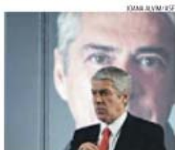
Sócrates foi detido em novembro de 2014

→ Ex-primeiro-ministro opta por permanecer em prisão preventiva no Estabelecimento de Évora