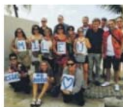
Jesus à direita na imagem

Ontem surgiu uma fotografia na rede social Facebook na