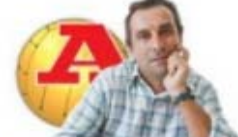
PAR ANTÓNIO SIMÕES