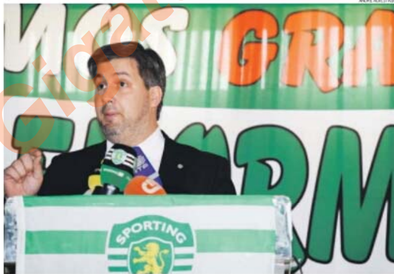
«Bem pior do que a contratação de Jesus, má ou boa, foi a forma como Bruno de Carvalho se desfez de Marco Silva», lembra MST

5 Com a contratação de Jesus, Bruno de Carvalho e os seus seguidiores acham que já conquistaram, ipso facto o estatuto de principais candidatos a vencer o campeonato que se segue. Vamos assim ver, desde a primeira jornada, o Sporting a reclamar contra tudo e contra todos, convencidos que, via Jesus, lhes assiste o direito divino a proclamarem-se campeões, façam os outros o que fizerem e tenham os méritos que tiverem. E, no final da época, quando Jesus tiver falhado o milagre, talvez alguns sportinguistas, mais do que os de agora, tenham vergonha da forma indecente como o clube tratou o treinador que lhe deu o primeiro título em oito anos. E talvez se lembrem das palavras que um sportinguista com 50 anos de sócio, Henrique Monteiro, escreveu este sábado, no Expresso : «A entrega de um clube com o histórico do Sporting a interesses obscuros, duvidosos, senão criminosos, é algo que nos deve preocupar para lá dos simples meandros do futebol... Não se pode ganhar sacrificando a decência, derrubando os alicerces daqueles que construíram o clube».