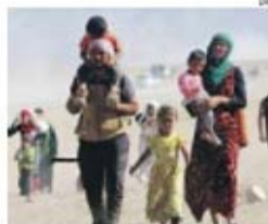
Famílias inteiras sem destino nem abrigo

O Presidente José Mário Vaz disse, ontem, que se «trabalha pouco» no país, sobretudo ao nível da Função Pública, setor, onde, segundo se queixou, os funcionários «entram em debandada geral» a partir das 13 horas. Estas críticas foram feitas no seu discurso como convidado de honra na tomada de posse dos novos corpos sociais da Câmara do Comércio.