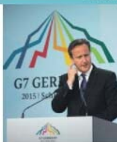
David Cameron recela oposição no partido

Os principais patriarcas das diversas igrejas do Médio Oriente, reunidos, ontem, na Síria, lançaram um apelo ao mundo para que ajudem os cristãos a sobreviver na região, fazendo frente ao radicalismo do Estado Islâmico.