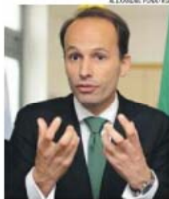
Pedro Mota Soares, ministro do Emprego

Os parceiros sociais terão, novamente, de avaliar alterações ao Código do Trabalho, desta feita até setembro, o que poderá mudar as regras associadas às convenções coletivas de trabalho, ou seja, contratos ou acordos assinados entre associações sindicais e empregadores. Significa isto também que o processo de alteração da lei deverá aproximar-se das legislativas, que serão marca-