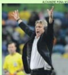
Jorge Jesus já só pensa no leão

Sarr deve sair. O brasileiro é aposta para segundo elemento, Paulo Oliveira bom para terceiro central. Tobias ainda precisa de crescer. Por isso, a contratação desse líder para a defesa é questão de extrema importância. Bruno Alves, um dos nomes recentemente apontados ao Sporting, encaixa no perfil. Já Bruno Uvini, 23 anos, deve passar para leões ser descartado.