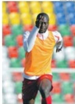
Danilo é nome em destaque no mercado