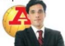
por MÁRIO SANTOS