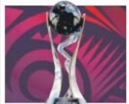
meias-finais a 17 de junho; 3.ª e 4.ª lugares e final a 20 de junho