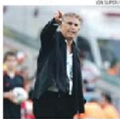
Carlos Queiroz, selecionador do Irão

O Irão, de Carlos Queiroz, foi vencer a Tashkent o Usbequistão, por 1-0, mereço do golo de Torabi (90+3'), de 20 anos, um dos cinco estreantes lançados pelo português. O jogo serviu de preparação para o duelo no Turquemenistão (perdeu, ontem, fora, com Guam, por 0-1), na terça-feira, para a 2.ª