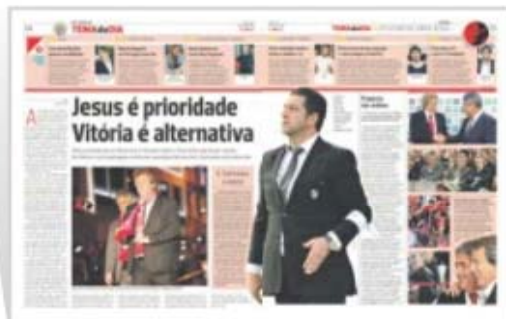
A 21 de maio, A BOLA revelou em primeira mão a intenção das águias: renovar com Jesus, mas não a qualquer preço, tendo Rui Vitória na linha de sucessão. Três semanas depois, é oficial