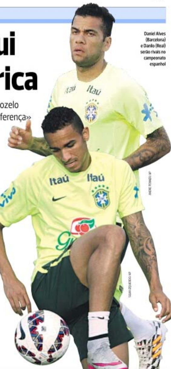
Daniel Alves (Barcelona) e Danilo (Real) serão rivais no campeonato espanhol

O Brasil entra em campo na madrugada de domingo para segunda-feira com o Peru e deve alinhar então com Jefferson; Daniel Alves; Miranda, David Luiz e Filipe Luís; Ferdinand e Elias; Willian, Philippe Coutinho e Neymar; Diego Tardelli. Jogadores como Roberto Firmino ou Robinho, também especulados entre os titulares, devem ser opções de Dunga no banco para o seu primeiro jogo oficial no regresso à seleção.