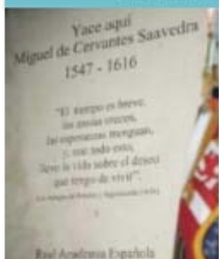
Inscrição em homenagem a Cervantes

Este acontecimento representou o culminar de um longo processo de busca pelos restos mortais de Miguel de Cervantes.