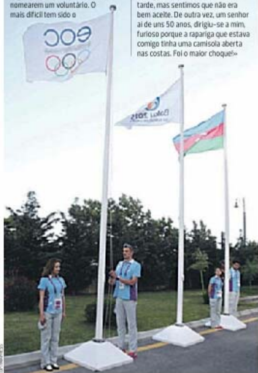
O hastear das bandeiras dos jogos, do país organizador e do Comité Olímpico Europeu