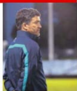
O treinador Hélio Sousa

“Não estávamos à espera que fosse fácil, eles também têm pontos fortes. Na primeira parte estivemos por cima, mas na segunda fomos um pouco passivos e eles aproveitaram. Estávamos fortes no meio-campo e com muito espaço para jogar, mas felizmente conseguimos marcar novamente. Vamos dar uma boa resposta com o Brasil”