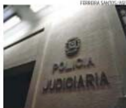
PJ deteve suspeito de violência doméstica