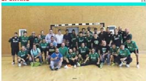
Membros da classe quiseram mostrar que estão a apoiar a equipa a 100 por cento