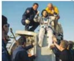
Alegria no regresso a casa dos astronautas