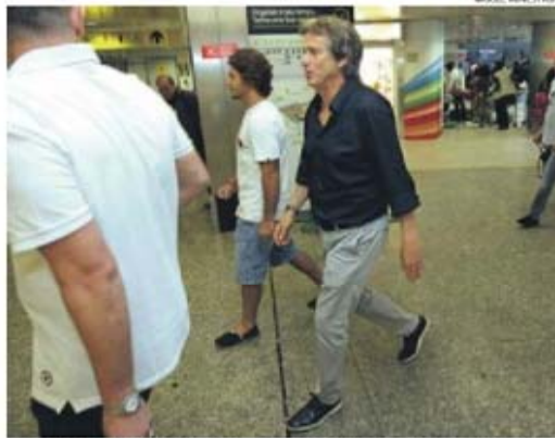
Jesus partiu de férias antes de voltar para assumir o Sporting e uma época que promete..