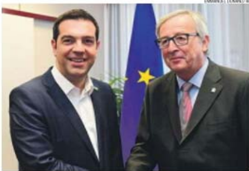
Alexis Tsipras, PM da Grécia, ao lado de Juncker, presidente da Comissão Europeia

A equipa do Fundo Monetário Internacional (FMI) que se deslocou a Bruxelas (Bélgica) para mais