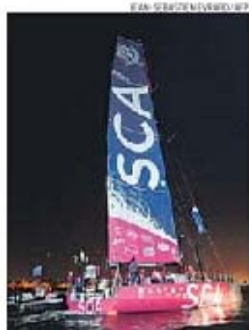
As mulheres não ganhavam desde 1989-90

→ Team SCA ganha 8.ª etapa da Volvo Ocean Race; Abu Dhabi Racing garante triunfo na prova