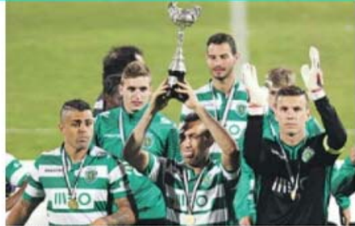
Sporting foi o vencedor da edição da Taça de Honra da AF Lisboa em 2014

Com o objetivo de preservar a importância da Taça de Honra da AF Lisboa, os clubes e a associação concordaram ainda criar uma comissão que discuta e apresente propostas. E tudo pode ser reequacionado, nomeadamente a calendarização, para se evitarem situações semelhantes. J. P. S.