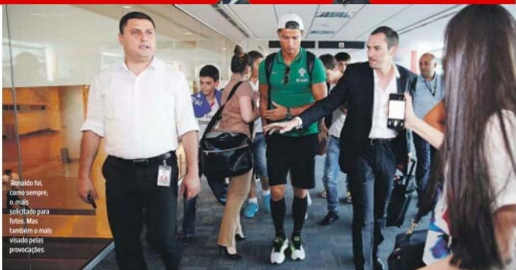
Ronaldo foi, como sempre, o mais soliciado para fotos. Mas também o mais visado pelas provocações