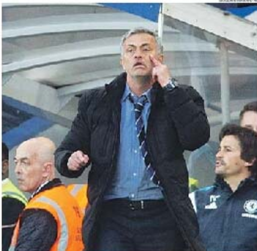
Mesmo de férias, José Mourinho continua a marcar a atualidade do futebol inglês

Onze anos depois, o tema voltou a estar bem presente e o técnico luso, de 52 anos, recorreu à ironia, bem ao seu estilo, para contrariar as críticas à tática defensiva da sua equipa, defendendo que recorrer ao «autocarro» não é para qualquer um. «Primeiramente, tenho um grande respeito pelos motoristas de autocarros», começou por afirmar, com um sorriso nos lábios, em declarações à BT Sports, no lançamento do novo canal europeu do grupo televisivo, em Londres. «Se não tiveres ajuda para