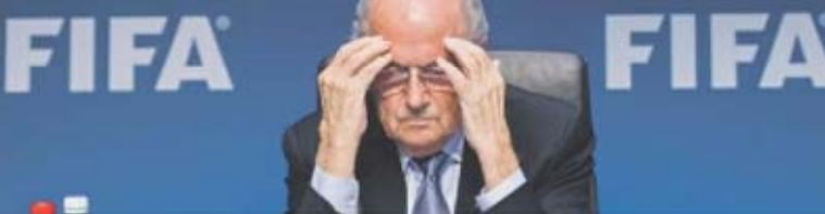
O cerco a Joseph Blatter e à FIFA aperta à medida que avança, também, a investigação aos negócios do organismo