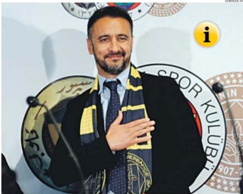
«É com orgulho que chego a este grande clube», destacou Vitor Pereira, de 46 anos, ontem num discurso carregado de ambição