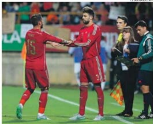
Piqué substituiu Sergio Ramos, aos 59 minutos, e o público de León não foi brando

A remontada seria consumada aos 30', quando Fábregas aproveitou um passe de Nolito (somou a segunda internacionalização), antigo jogador do Benfica agora no Celta, para finalizar certeiro. A partir de então o ritmo do en-