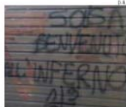
Insultos ao treinador nas ruas de Florença

→ Aficionados da Fiorentina não querem que o novo treinador seja um antigo jogador da Juventus