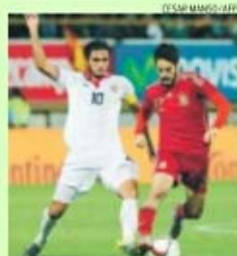
Bryan Ruiz com Isco