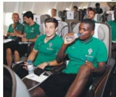
Depois de curta viagem de avião de Tbilissi, na Geórgia, até Erevan, na Arménia, os jogadores portugueses foram cumprimentados por uns mais validos por outros