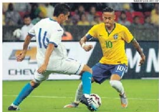
Neymar começou no banco de suplentes e saiu de campo sem agradecer aos adeptos