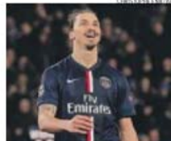
Ibrahimovic, 33 anos, avançado do PSG

O italiano Maurizio Sarri é o novo treinador do Nápoles, sucedendo no cargo ao espanhol Rafael Benítez, que se transferiu para o Real Madrid. Com 56 anos, Sarri estava desde 2012 no Empoli, clube no qual orientou o lateral-esquerdo português Mário Rui.