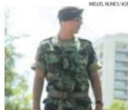
Militares na reserva vão ajudar as escolas

segurar a continuidade da atividade de vigilância das escolas», indicou um comunicado do Governo.