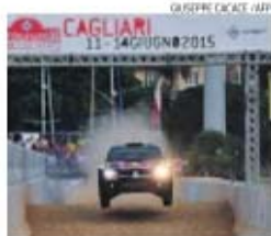
Mikkelsen é 2.º classificado e melhor VW

→ Martin Prokop está na frente do rali italiano; português Bernardo Sousa é 9.º no WRC2