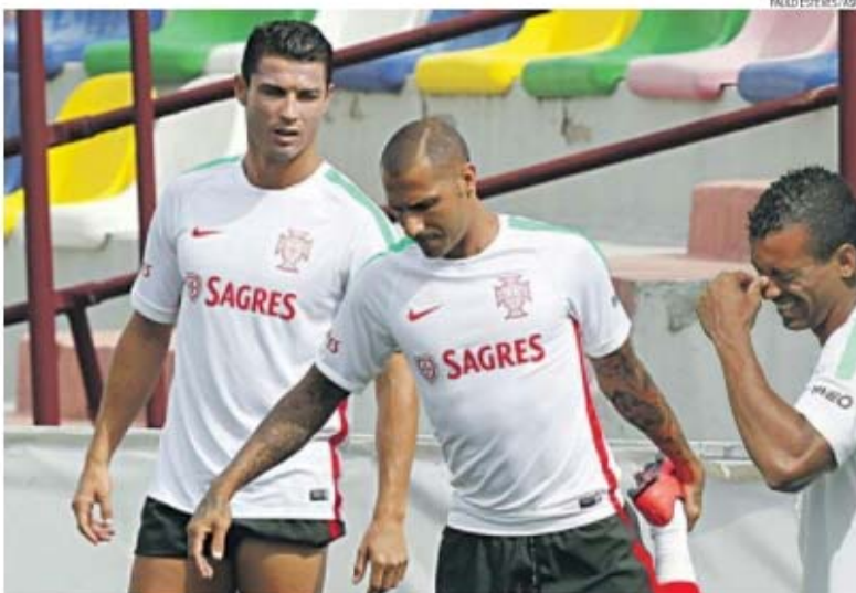
Cristiano Ronaldo, Ricardo Quaresma e Nani: Fernando Santos tem muito talento por onde escolher na Seleção Nacional

Assim, é muito provável que o onze titular seja formado por um meio-campo composto por Quaresma, João Moutinho, Tiago e Fábio