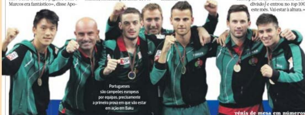
Portugueses são campeões europeus por equipas, precisamente a primeira prova em que vão estar em ação em Baku