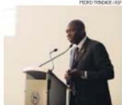
Domingos Simões Pereira, PM guineense

→ Air Guiné-Bissau será detida em 40% pelo Estado e em 60% pelo grupo romeno Tender