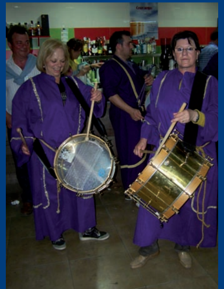
“en imágenes” La Semana Santa de Agramón